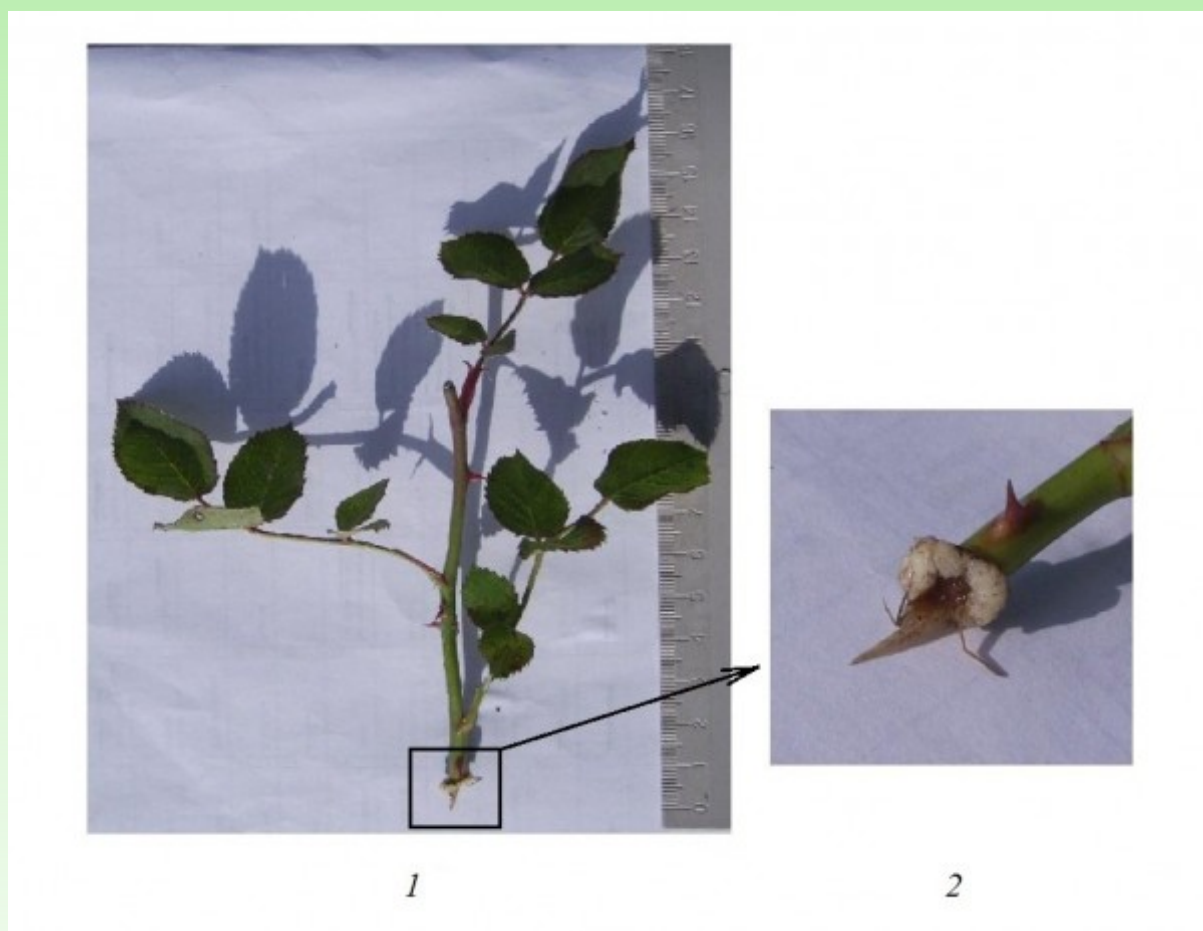
Рис. 1. Укоренение черенков роз группы patio. Появление корней. 1 — черенок сорта 'Bright Smile' (посадка — 01.06.2009 г., фотографирование — 23.06.2009 г.); 2 — каллюс с первыми корнями (увеличено)

Fig. 1. Rooting of Patio rose cuttings. Emergence of roots. 1— a cutting of cultivar 'Bright Smile' (planting — 01.06.2009; photo — 23.06.2009); 2 — callus with the first roots (enlarged).