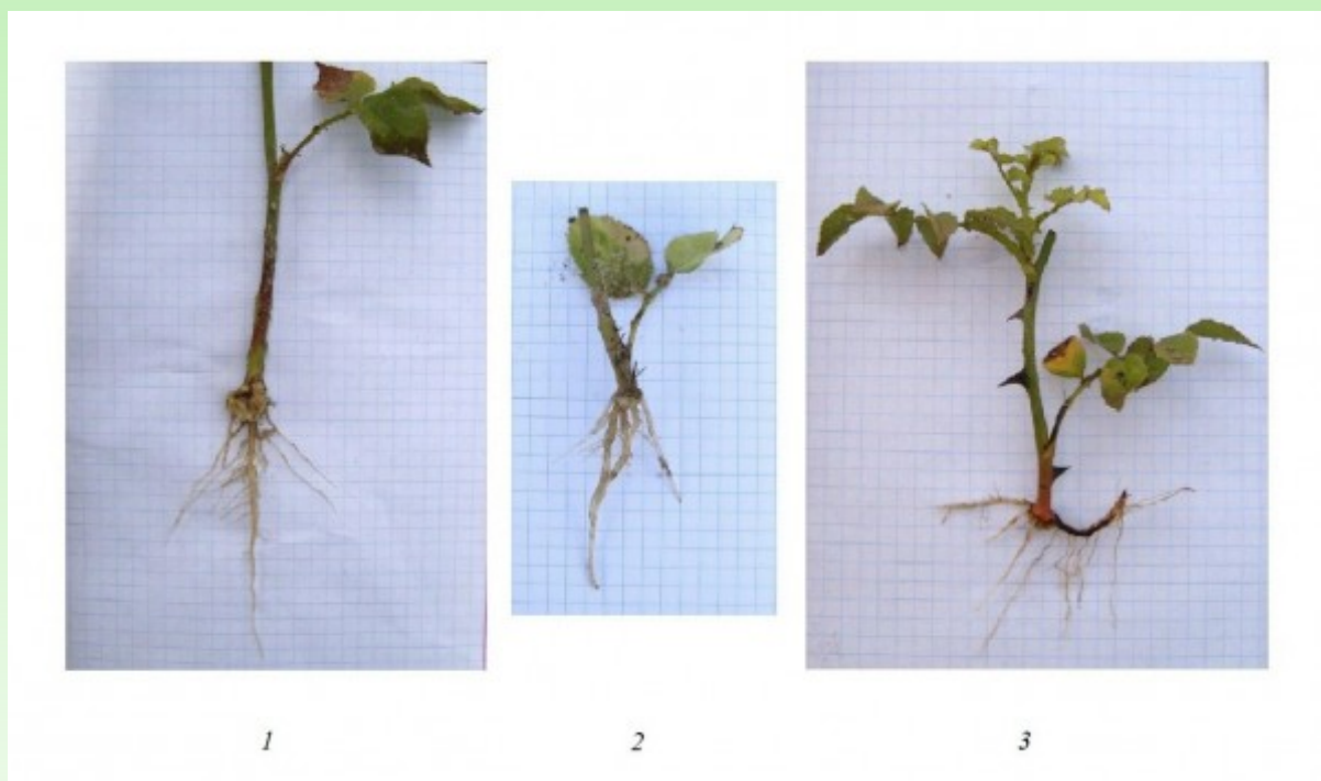
Рис. 2. Корнеобразование у черенков роз группы patio разных сортов (посадка — 01.06.2009 г., фотографирование — 21.07.2009 г.): 1 — 'Festival'; 2 — 'Bright Smile'; 3 — 'Buttons'.

Fig. 2. Rhizogenesis of different Patio rose cultivars' cuttings (planting — 01.06.2009, photo — 21.07.2009): 1 — 'Festival'; 2 — 'Bright Smile'; 3 — 'Buttons'.