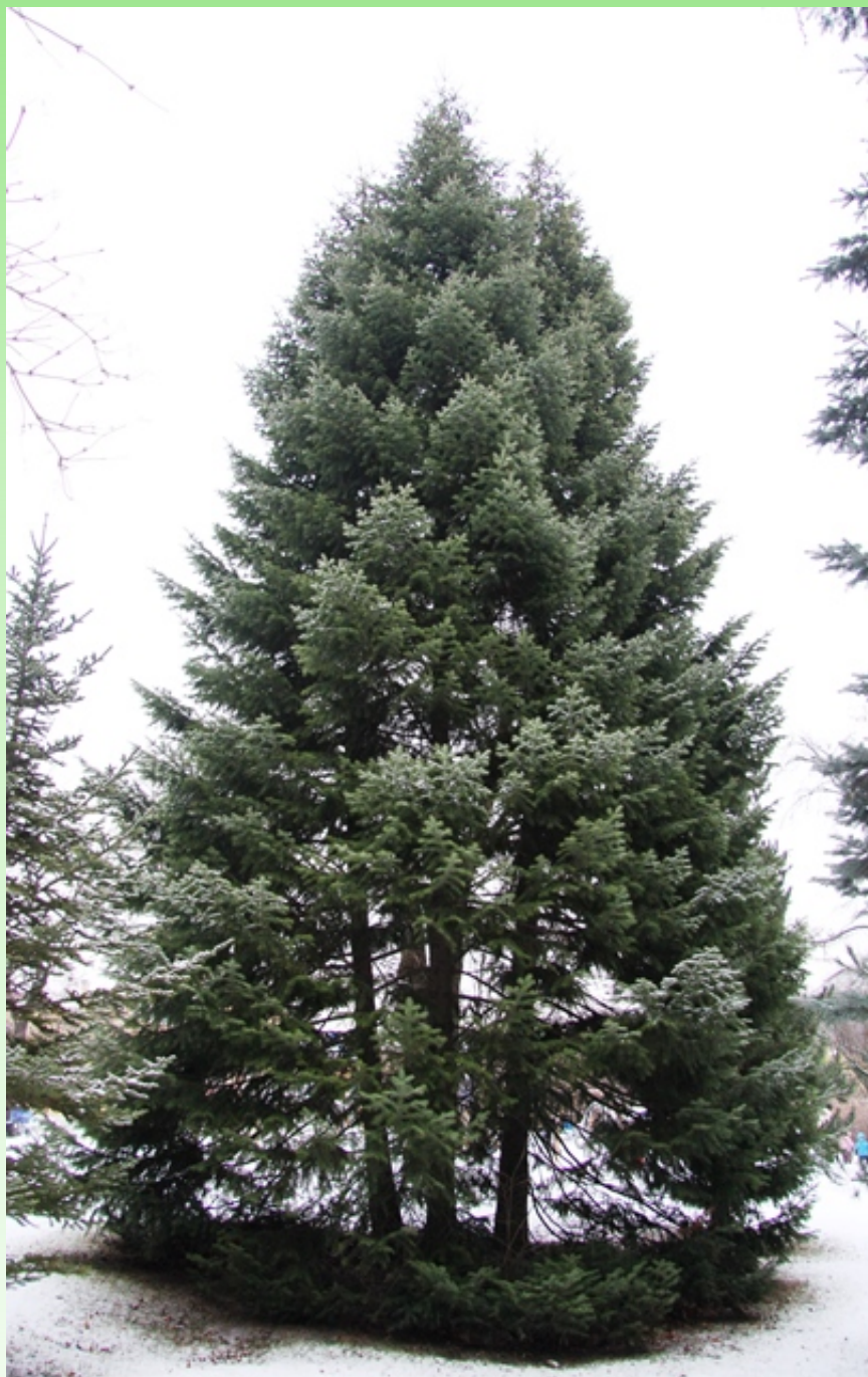
Рис. 2. Abies semenovii в парке Ботанического сада Петра Великого, декабрь 2015.

сохраняющейся хвоей на побегах, а также вступление её в репродуктивное состояние, с образованием нормально развитых и всхожих семян. Важным фактором интродукции для закрепления в культуре является получение молодых растений этого вида второго поколения. Семенное потомство от Abies semenovii получено впервые за 67 лет выращивания этого вида в Санкт-Петербурге. Пихту Семёнова следует рекомендовать для разведения в Санкт-Петербурге и Ленинградской области, и продвижения в Карелию и более северные районы Европейской части России в качестве декоративного растения для городского озеленения.