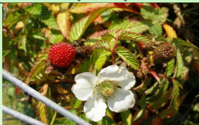
Рис. 6. Малина тибетская.