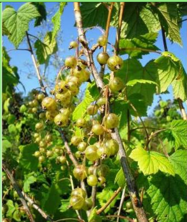
Рис. 8. Смородина зеленоплодная 'Верти'.