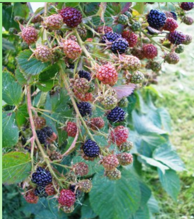
Рис. 4. Ежевика Агавам.

Новинка для Карелии – малина тибетская, низкорослый полукустарник, с крупными белыми цветами и крупными темно красными направленными вверх плодами, созревающими в конце лета (Рис.6). В условиях Карелии надземная часть растения на зиму отмирает. Оригинальное растение – малина желтоплодная, больше похожая на морошку (Рис.7), высажена на выступе скалы, т. е. в условиях приближенным к скальным районам Китая, откуда она родом.