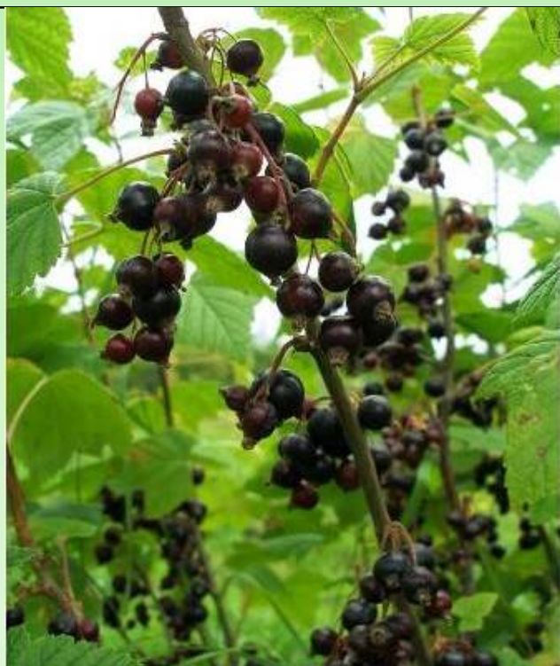
Рис. 10. Смородина чёрная 'Мелалаhti'.