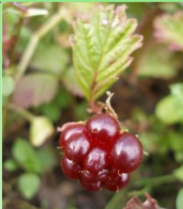
Рис. 5. Поленика арктическая.