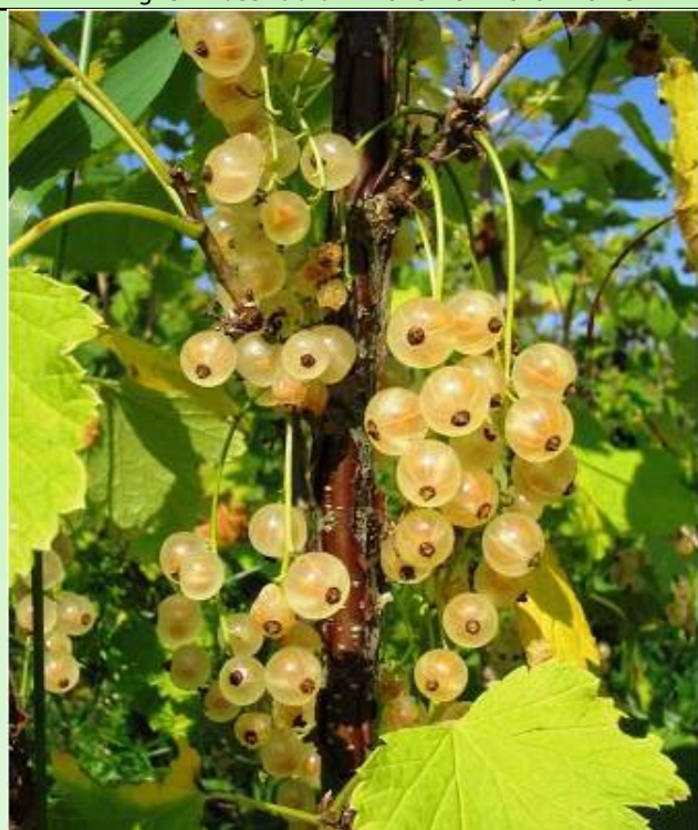
Рис. 11. Смородина белая 'Валкойнен Хаммас'.