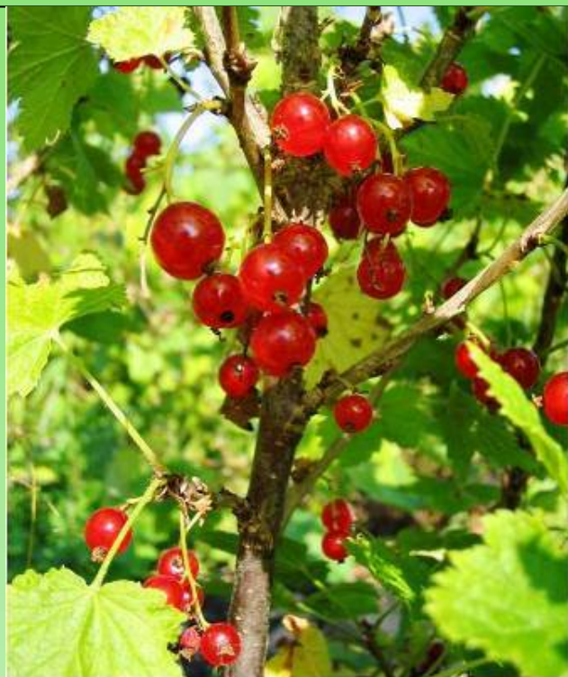
Рис. 9. Смородина красная 'Пунайнен Холантилайнен'.