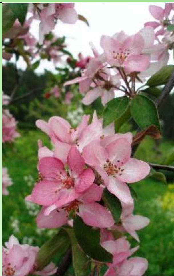
Рис. 12 - 13. Яблоня обильноцветущая.