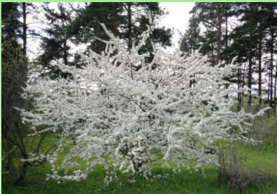
Рис. 3. Алыча или слива растопыренная 'Подарок Санкт-Петербургу'

Редкая для Севера косточковая культура алыча или слива растопыренная ( Prunus cerasifera Ledeb.) 'Подарок Санкт-Петербургу' в начале лета обильно цветет (Рис. 3) и регулярно плодоносит, плоды имеют желтую окраску. Устойчивы в условиях Карелии сорта вишни обыкновенной ( Prunus cerasus L.) 'Десертная Морозовой' (сорт отечественной селекции) и 'Облачинская' (сорт, выведенный в Сербии).