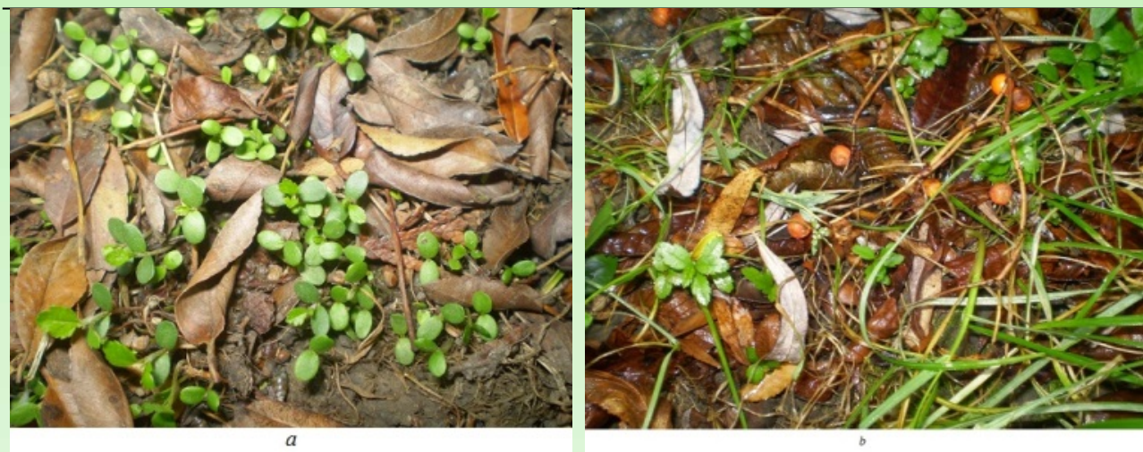
Рис. 4. Самосев P. crenulata в условиях Национального дендропарка "Софиевка" НАНУ: а) Дата фотографирования 19.05.09 г.; б) Дата фотографирования 04.09.09 г.