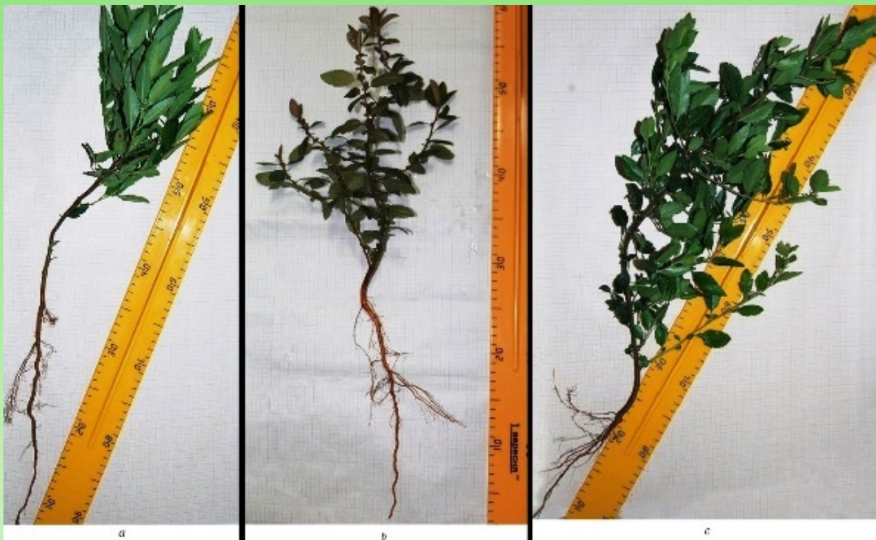
Рис. 3. Сеянцы второго года а) P. crenulata , б) P. koidzumii , в) P. crenatoserrata

высевали во влажную почву. Всхожесть составила у P. coccinea — 38 \pm 1,5\% , P. coccinea — 37 \pm 0,9\% , P. crenulata — 36,5 \pm 2,4\% , P. koidzumii — 32,5 \pm 2,4\% . Семена мелкие, поэтому одной из причин низкой всхожести могут быть механические повреждения зачатка при скарификации. Во второй декаде марта высевали сухие семена. Через 28 дней появились первые всходы. Всхожесть в текущем году составляет у P. coccinea — 54 \pm 8,27\% , P. crenulata — 51 \pm 5,51\% , P. crenatoserrata — 50,33 \pm 8,7\% , P. koidzumii — 45,5 \pm 5,32\% (Рис.2).