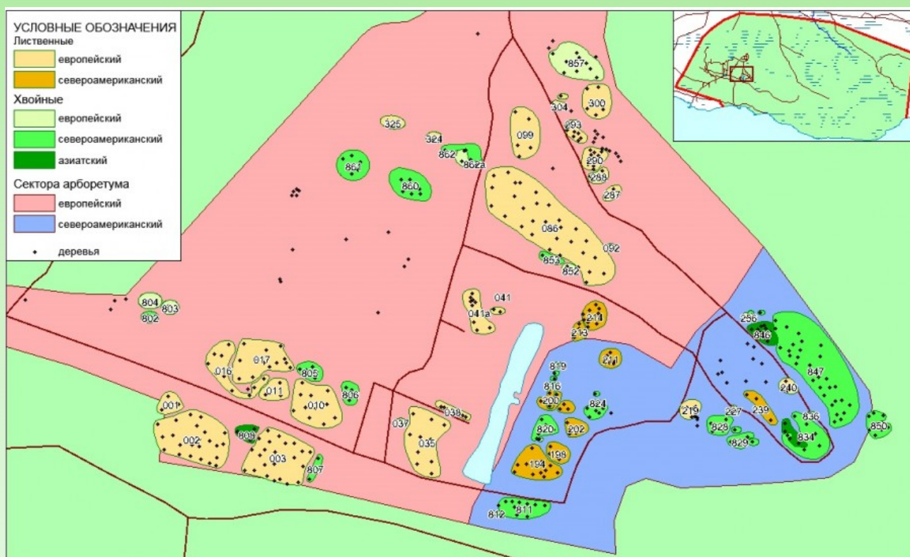
Рис. 1. Расположение закартированных деревьев на территории европейского и североамериканского секторов.

В настоящее время, на территории арборетума, площадь которого составляет 12 га, проведена инвентаризация более 730 деревьев. В пределах европейского и североамериканского секторов закартировано 526 экземпляров, объединенных в 61 группу по видовому составу и годам посадки (рис. 1).