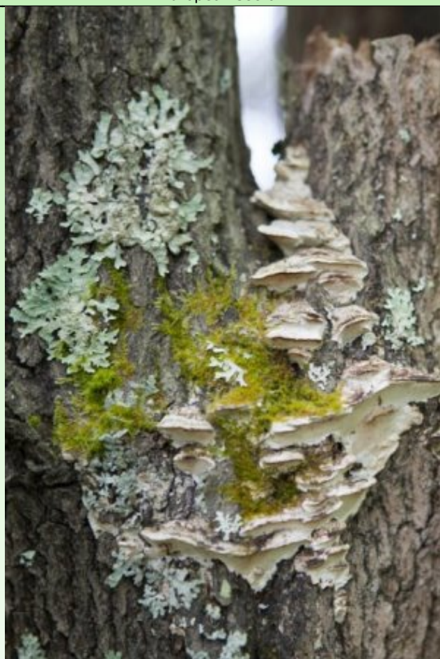
Рис. 5. Эпифитная флора на Acer platanoides (кк002).