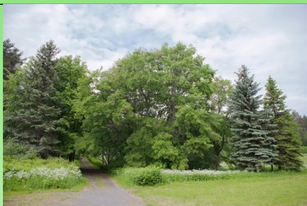
Рис. 3. Picea pungens Engelm. (кк806) на территории европейского сектора.