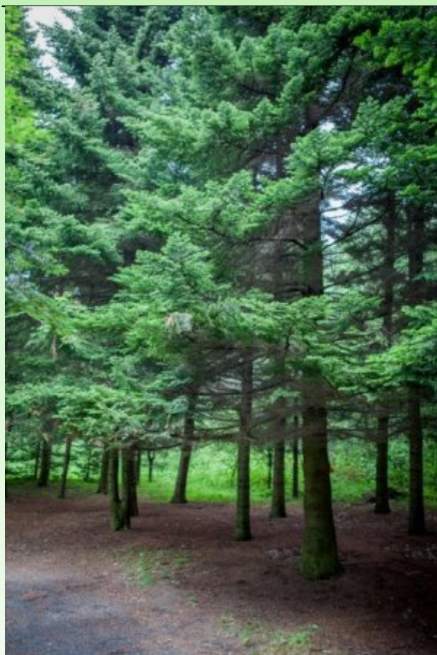
Рис. 4. Группа Abies balsamifera Michx. (кк847)