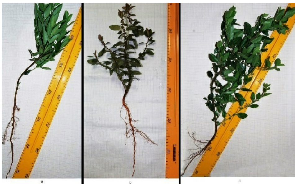
Рис. 3. Сеянцы второго года а) P. crenulata , б) P. koidzumii , в) P. crenatoserrata

составляет у P. coccinea — 77 \pm 2,9\% , P. crenatoserrata — 75 \pm 5,8\% , P. crenulata — 77,5 \pm 9,2\% , P. koidzumii — 76,5 \pm 5,3\% . Чтобы ускорить прорастание семян пираканты проводили скарификацию. Скарификация состоит в том, что механическим путём повреждаются твердые семенные покровы. Осторожно, в ступке растирали семена с крупнозернистым песком на протяжении 2-х, 4-х и 6-ти минут. После этого семена тщательно промывали, замачивали в воде на протяжении 12-ти часов, высушивали до состояния сыпучести и высевали во влажную почву. Всхожесть составила у P. coccinea — 38 \pm 1,5\% , P. coccinea — 37 \pm 0,9\% , P. crenulata — 36,5 \pm 2,4\% , P. koidzumii — 32,5 \pm 2,4\% . Семена мелкие, поэтому одной из причин низкой всхожести могут быть механические повреждения зачатка при скарификации. Во второй декаде марта высевали сухие семена. Через 28 дней появились первые всходы. Всхожесть в текущем году составляет у P. coccinea — 54 \pm 8,27\% , P. crenulata — 51 \pm 5,51\% , P. crenatoserrata — 50,33 \pm 8,7\% , P. koidzumii — 45,5 \pm 5,32\% (Рис.2).