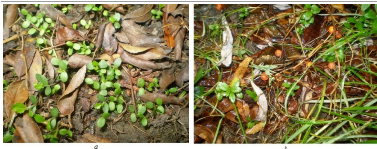
Рис. 4. Самосев P. crenulata в условиях Национального дендропарка "Софиевка" НАНУ: а) Дата фотографирования 19.05.09 г.; б) Дата фотографирования 04.09.09 г.