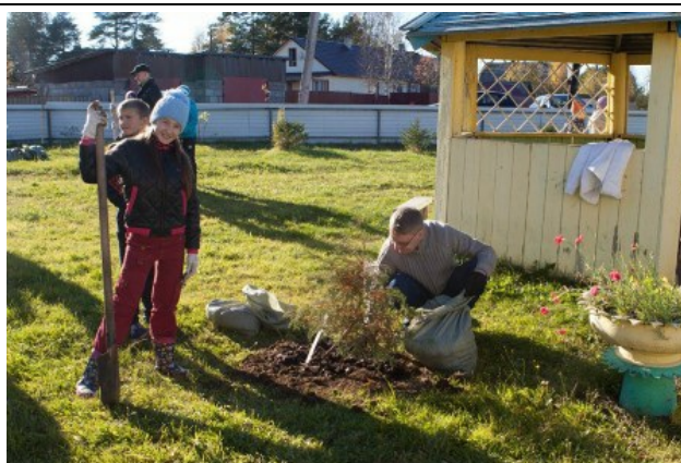
Рис. 5. Создание "Гостеприимного сада" в поселке Эссоила.

Pic. 5. Buildup of the "Open garden" in the village of Essoila.