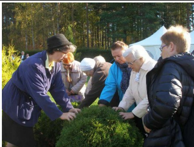
Рис. 3. Ощущение формы

Pic. 2. Guests, veterans and retire workers of Petrozavodsk, taking the route "Garden path - on the road to health".