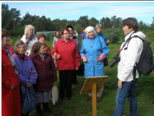
Рис. 2. Гости - ветераны войны и труда г. Петрозаводска - на маршруте "Садовая дорожка - путь к здоровью".

Pic. 2. Guests, veterans and retire workers of Petrozavodsk, taking the route "Garden path - on the road to health".