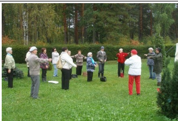
Рис. 4. Веселая физзарядка.