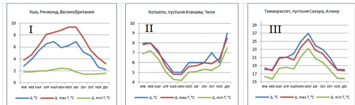
Рис. 2. Среднемесячные отклонения температуры воздуха от точки росы для средних ( \Delta T_{AD} ), максимальных ( \Delta T_{AD, \max T} ) и минимальных ( \Delta T_{AD, \min T} ) температур воздуха.

Fig. 2. Monthly average air temperature deviation from the dew point at average ( \Delta T_{AD} ), max ( \Delta T_{AD, \max T} ) and minimum ( \Delta T_{AD, \min T} ) air temperatures.