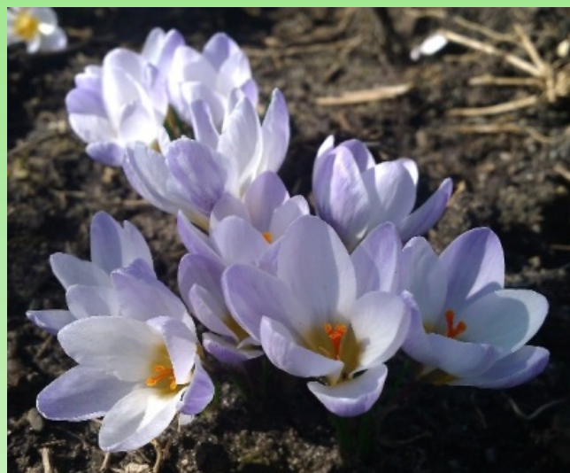
Рис. 5. Крокус золотистый 'Блю Перл'.

Crocus chrysanthus 'Blue Pearl' – Крокус золотистый 'Блю Перл' (рис. 5). Голландия. Срок цветения: ранний.