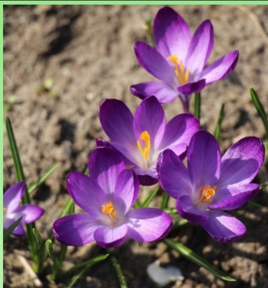
Рис. 6. Крокус Томазини 'Руби Гигант'.

Высота растения до 4.2 см. Цветок чашевидной формы: высотой – 2.7 см, диаметром – 2.8 см. Окраска долей околоцветника: белая с темно-фиолетовыми мазками по каждому лепестку. Листья узколинейные, прикорневые, растущие пучком, появляются во время цветения. Длина листа: 8.2 см, ширина 0.2 см. Продолжительность цветения 29 дней. Коэффициент размножения – 2.4.