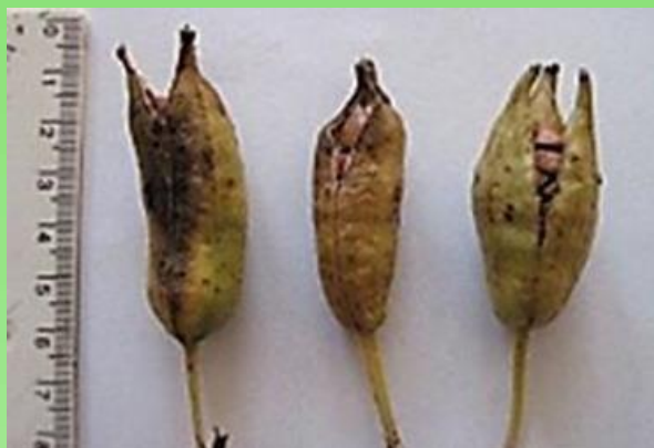
Рис. 1. Плоды Iris pseudacorus L.