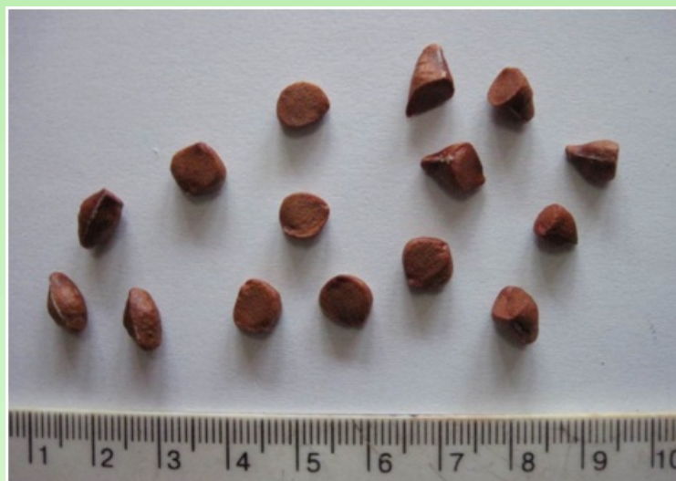
Рис. 2. Полиморфизм семян Iris pseudacorus L.

Примечание: M±m – средняя величина ± ошибка среднего; CV % – коэффициент вариации.