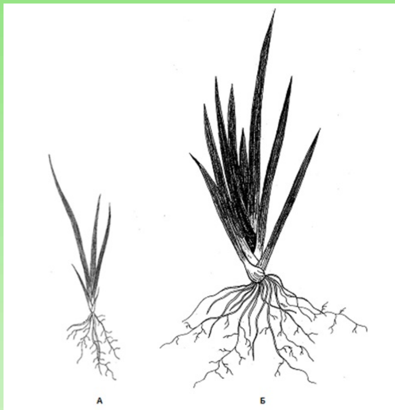
Рис. 4. Ювенильная (А) и имматурная (Б) особи Iris pseudacorus L.

азрируемыми грунтами в местах естественного произрастания вида. В нашем же случае, в условиях частого пересыхания верхних слоев почвы уже в мае и даже конце апреля, эту особенность I. pseudacorus можно считать важной адаптационной стратегией вида, дающей возможность проросткам благополучно развиваться в засушливых условиях степной зоны: более глубокая заделка семян при посеве создает проросткам оптимальные условия увлажнения, повышая их жизнестойкость.