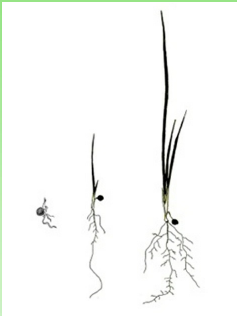
Рис. 3. Развитие проростка Iris pseudacorus L.

Проростки. При осеннем посеве всходы появляются во второй половине апреля следующего года. Это возрастное состояние наиболее динамично, структура проростков очень быстро усложняется, а потому можно выделить ранние и поздние проростки (рис. 3).