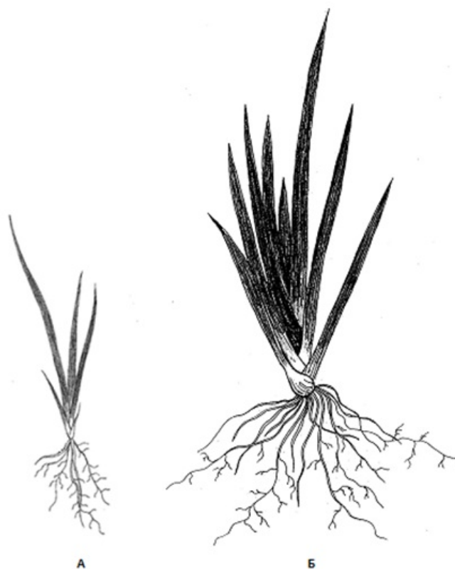
Рис. 4. Ювенильная (А) и имматурная (Б) особи Iris pseudacorus L.

азрируемыми грунтами в местах естественного произрастания вида. В нашем же случае, в условиях частого пересыхания верхних слоев почвы уже в мае и даже конце апреля, эту особенность I. pseudacorus можно считать важной адаптационной стратегией вида, дающей возможность проросткам благополучно развиваться в засушливых условиях степной зоны: более глубокая заделка семян при посеве создает проросткам оптимальные условия увлажнения, повышая их жизнестойкость.