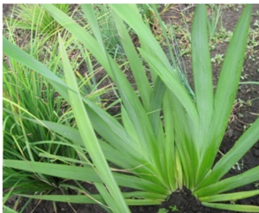
Рис. 5. Виргинильная особь Iris pseudacorus L.

состояния – становление жизненной формы в результате перехода от моноподиального к симподиальному нарастанию побегов с образованием первичного куста (рис. 5). На третьем году развития в результате ветвления корневища формируются особи с двумя или четырьмя вегетативными побегами. Каждый побег состоит из 8–12 срединных мечевидных листьев длиной 40–70 см, шириной 2,2–2,8 см. Подземная часть представлена коротким корневищем с множеством придаточных корней. Половина из них разветвленные, более длинные (до 15 см длиной), остальные более короткие и толстые (до 10 см длиной, 2–4 мм толщиной), шнуровидные, в конце лета превращающиеся в контрактивные. В этом году завершается прегенеративный период онтогенеза I. pseudacorus .