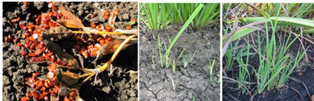
Рис. 8. Развитие самосева Iris pseudacorus L. в Донецком ботаническом саду.

На основании проведенных исследований, I. pseudacorus нами рекомендуется как устойчивое и неприхотливое растение для широкого использования в зеленом строительстве Донбасса – для водоемов, миксбордеров, рокариев и гравийных садов, а также для срезки. В экспозициях ландшафтного типа он хорошо сочетается с нивяником, дербенником иволистным, ирисом сибирским, мелколепестником крупноцветковым, колокольчиком средним, лихнисом халцедонским, маком восточным и другими высокими многолетниками.