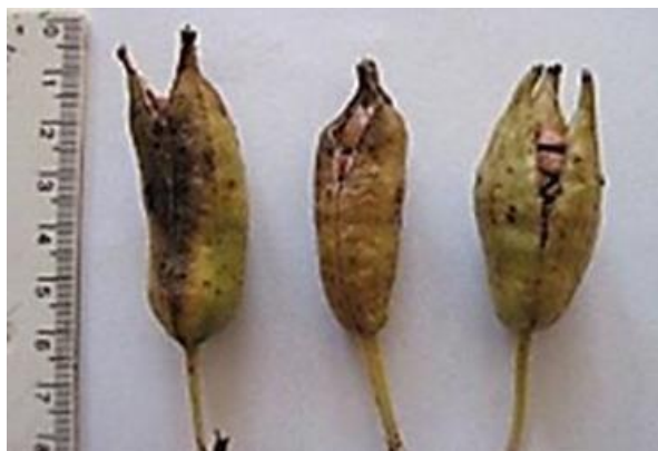
Рис. 1. Плоды Iris pseudacorus L.