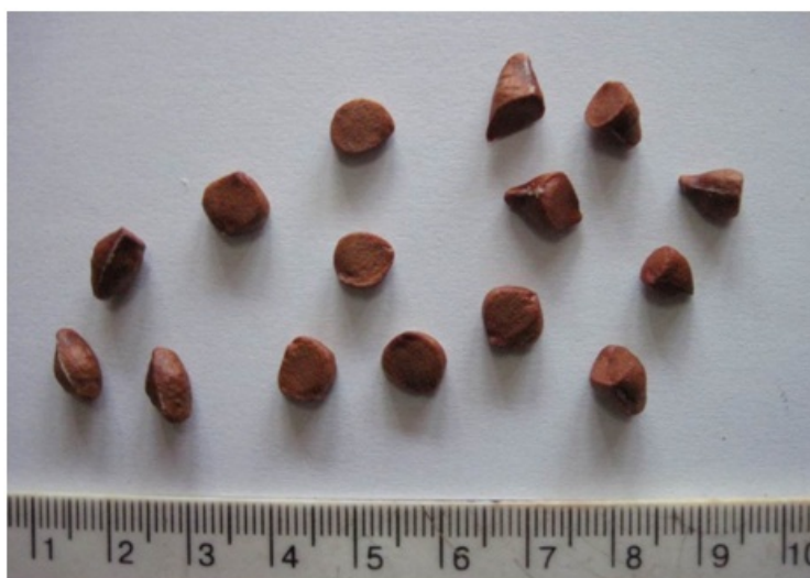
Рис. 2. Полиморфизм семян Iris pseudacorus L.

Примечание: M±m – средняя величина ± ошибка среднего; CV % – коэффициент вариации.