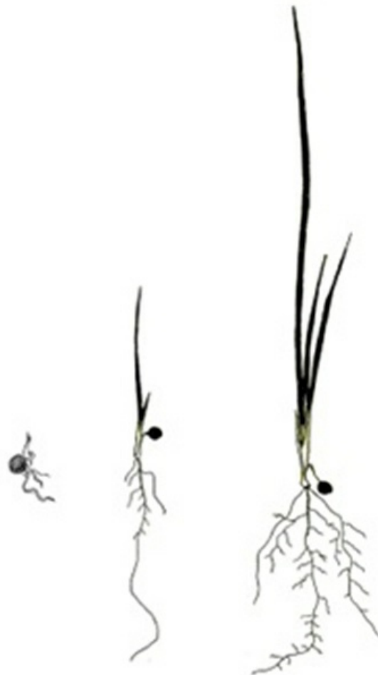
Рис. 3. Развитие проростка Iris pseudacorus L.

Проростки. При осеннем посеве всходы появляются во второй половине апреля следующего года. Это возрастное состояние наиболее динамично, структура проростков очень быстро усложняется, а потому можно выделить ранние и поздние проростки (рис. 3).