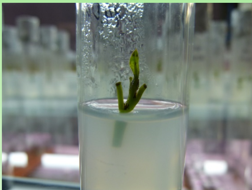
Рис. 1. Введение R. diamantica in vitro .

Полученный стерильный жизнеспособный материал высаживали на питательные среды Мурасиге и Скуга с различным содержанием регуляторов роста.