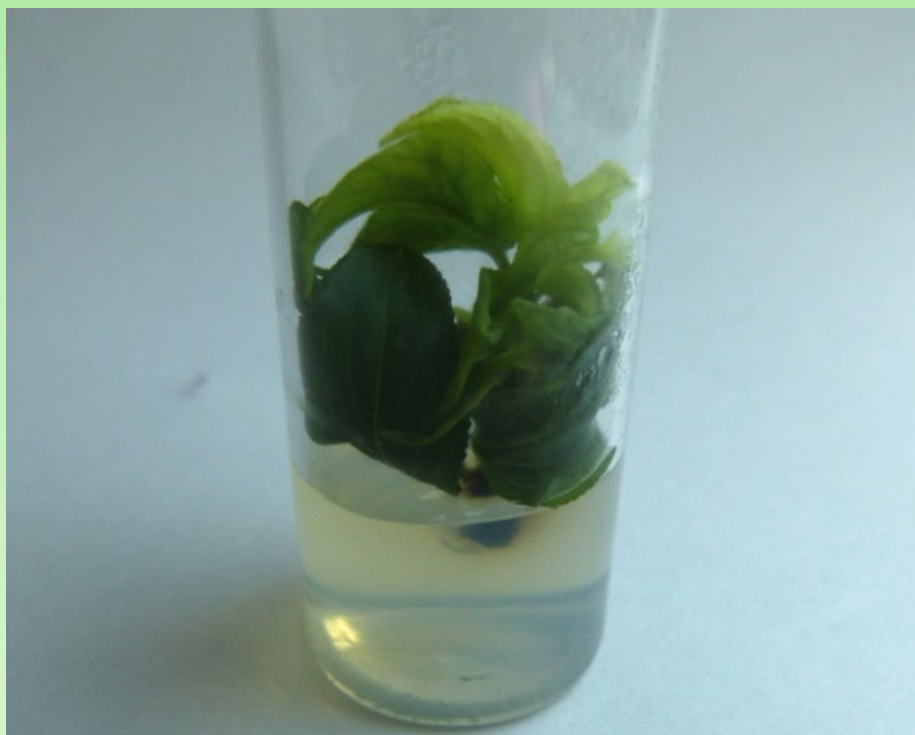
Рис. 3. Морфогенез R. diamantica in vitro .

Под влиянием различных концентраций фитогормонов наиболее активно процессы морфогенеза происходили на среде IV при концентрации в питательной среде 6-БАП — 2,0 мг / л, \beta -ИМК — 1,0 мг / л, где коэффициент размножения при втором пассаже составил в R. diamantica — 5,3, у R. tinctoria — 4,4, R. alnifolia — 3,5. У R. cathartica и R. imeretina коэффициент размножения был значительно ниже и соответственно составил 2,0 и 2,4.