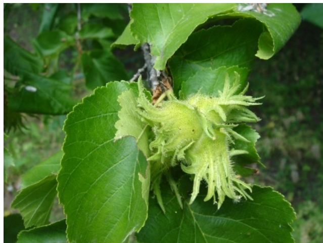
Рис. 2. Плодоношение Corylus colurna L.