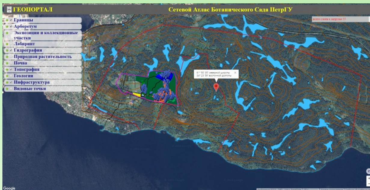
Рис. 1. Интерфейс веб-ГИС БС ПетрГУ.

Поле завершения тестирования ГИС была перемещена на сервер БС ПетрГУ и стала доступна всем пользователям. Пример интерфейса веб-ГИС БС представлен на рисунке 1.