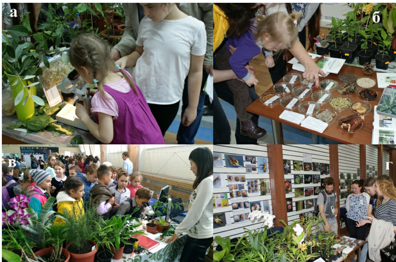
Рис 2. Площадки оранжереи Ботанического сада Самарского университета на Фестивале NAUKA0+. Фотография а - дата проведения 28.04.2018, фотографии б и г - дата проведения 29.04.2017, фотография в- дата проведения с 6 по 8 октября 2017.

подготовку тематического стенда, экспозиции и интерактивной экскурсии на 7-10 минут для организованных групп и индивидуальных посетителей (рис. 2).