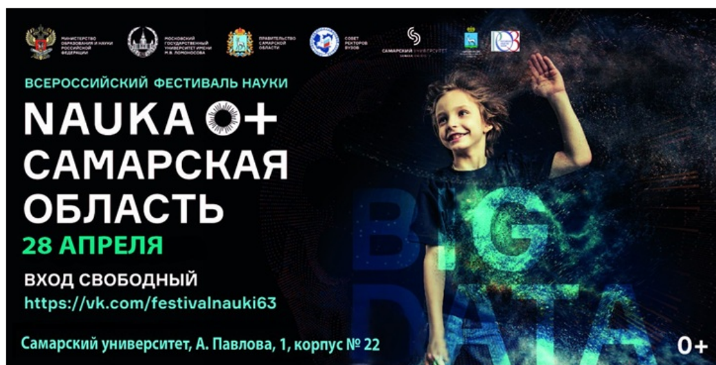
Рис.1 Реклама Фестиваля NAUKA 0+ в г. Самаре, 2018г.

Основополагающей задачей для организаций, занимающихся экологическим образованием, становится пробуждение интереса к познанию природы у потенциального посетителя и поднятие у него желания прийти в ботанический сад.