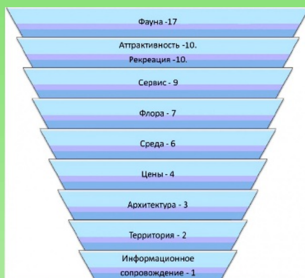
Рис. 3. Встречаемость факторов, оцениваемых в положительных отзывах