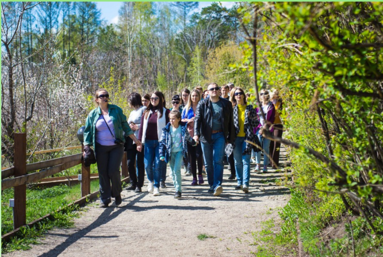
Рис. 2. Экскурсия «Когда цветет сакура». 2018 г.

экообразовательных проектов. Это «Зимний лекторий для садоводов и цветоводов», в рамках которого сотрудники Ботанического сада ИГУ делятся профессиональными секретами, проводят мастер-классы, читают лекции, отвечают на вопросы. Это серии сезонных (весна, лето, осень) тематических экскурсий по дендрарию, которые проводят как экскурсоводы Ботанического сада, так и привлеченные специалисты. Это семейный образовательный проект «Воскресные встречи в Саду», целевой аудиторией которого являются семьи с детьми, а тематика встреч довольно широка – знакомство с растительным миром Приангарья, насекомыми, птицами, пресмыкающимися, экосистемой в целом.