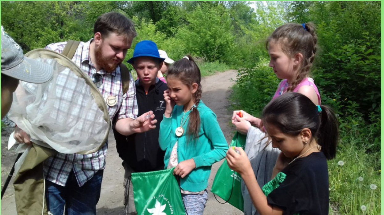
Рис. 6. «Умные каникулы в Ботаническом саду». 2018 г.