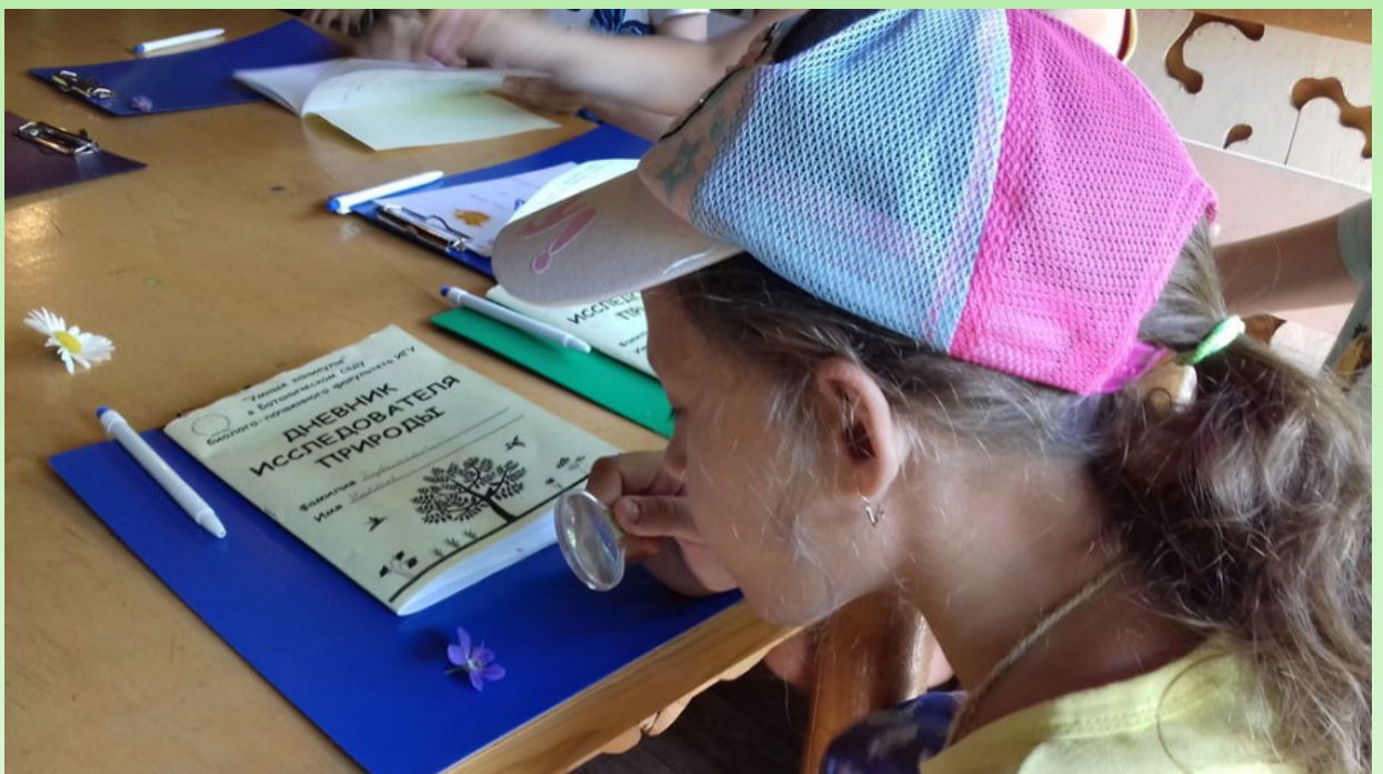
Рис. 6. «Умные каникулы в Ботаническом саду». 2018 г.