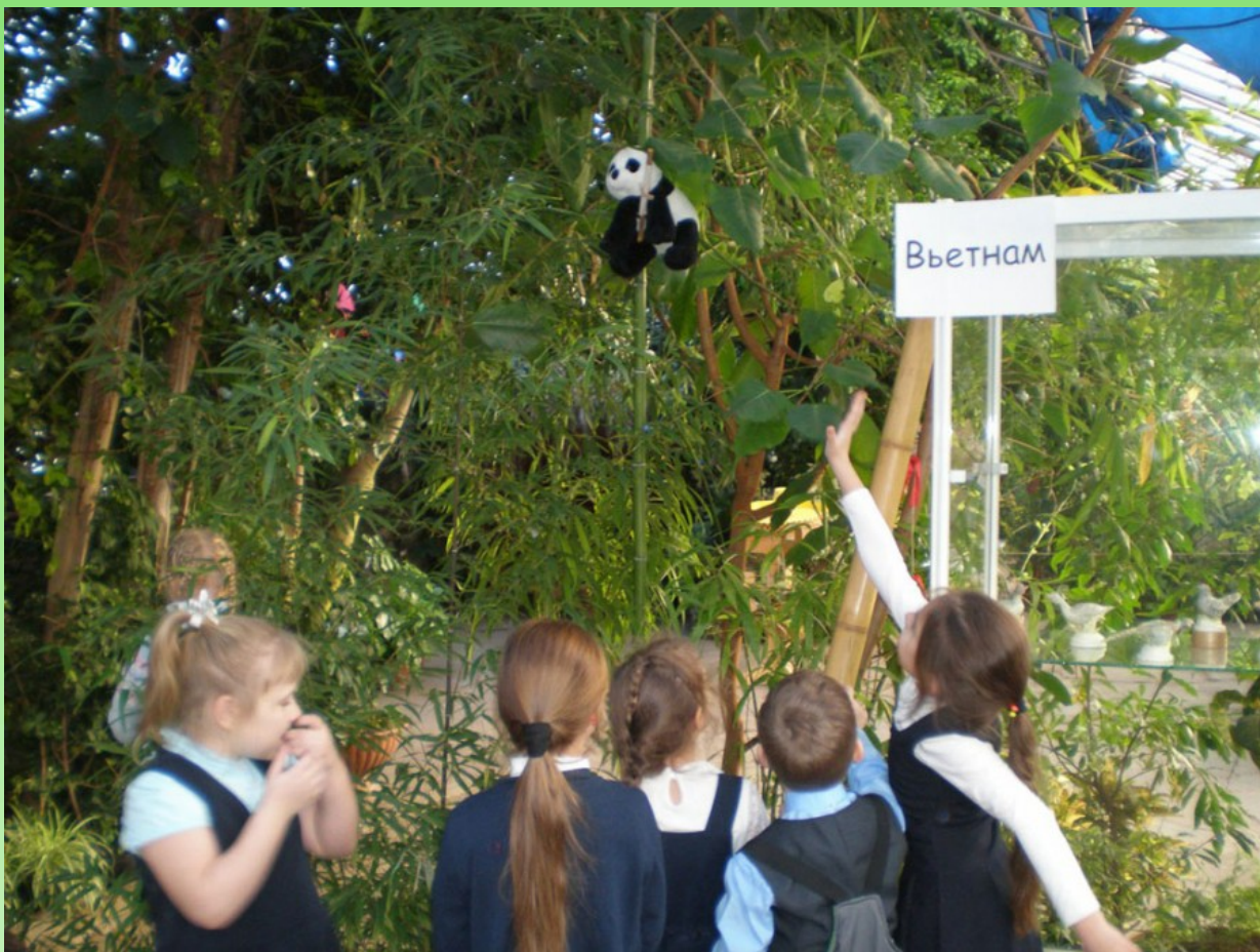
Рис. 5. Игра-квест «Новогоднее расследование с Варварой Колючкиной». 2017 г.