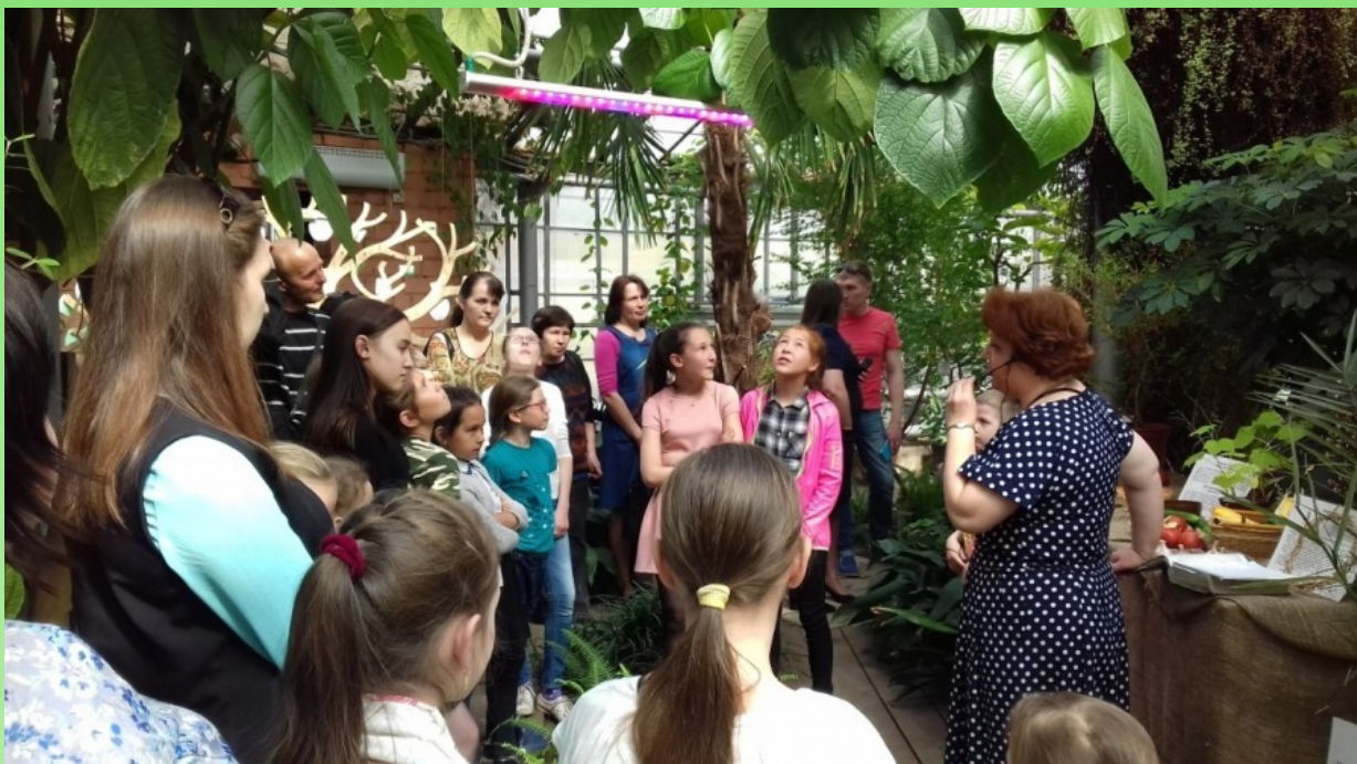
Рис. 8. Выставочно-просветительский проект «Библейский сад». 2018 г.