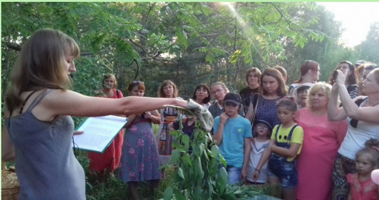
Рис. 3. Экскурсия «Дом, рубашка и не только». 2017 г.

Интерактивность – антоним пассивного восприятия информации. Интерактивность предполагает внимание к мотивации посетителя, его личностным потребностям, его познавательным стратегиям. Существует достаточно большое количество методов интерактивности, давно и успешно применяемых в образовательной деятельности – так называемые действия с «включенными» руками (hands-on activities), игровое взаимодействие посетителей друг с другом и с экскурсоводом, ролевые игры, поддержка самостоятельной поисковой активности посетителей (например, с помощью путеводителей с заданиями).