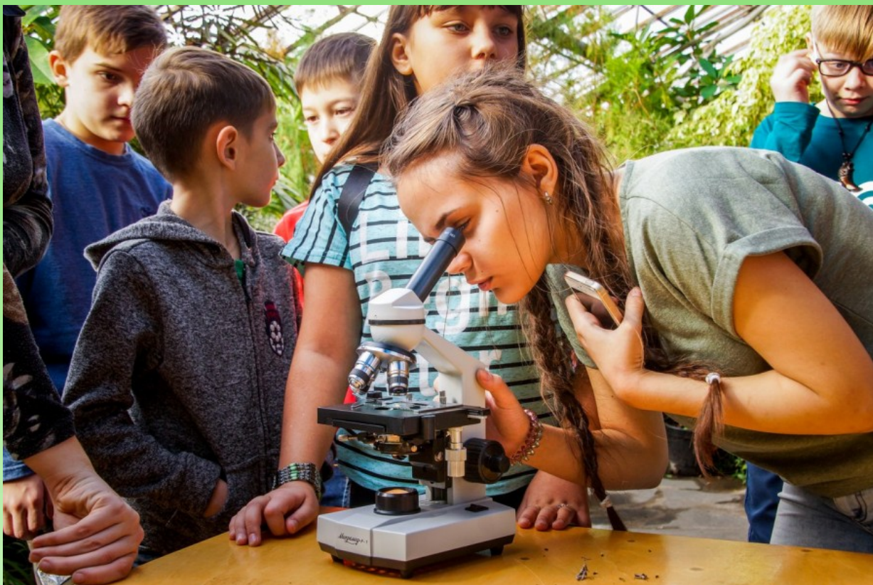
Рис. 4. Интерактивное занятие для школьников «Растения-инженеры». 2017 г.

приборами и другими предметами, используемыми в научной деятельности – лупой, микроскопом, баночками для сбора образцов, энтомологическим сачком и т.д.