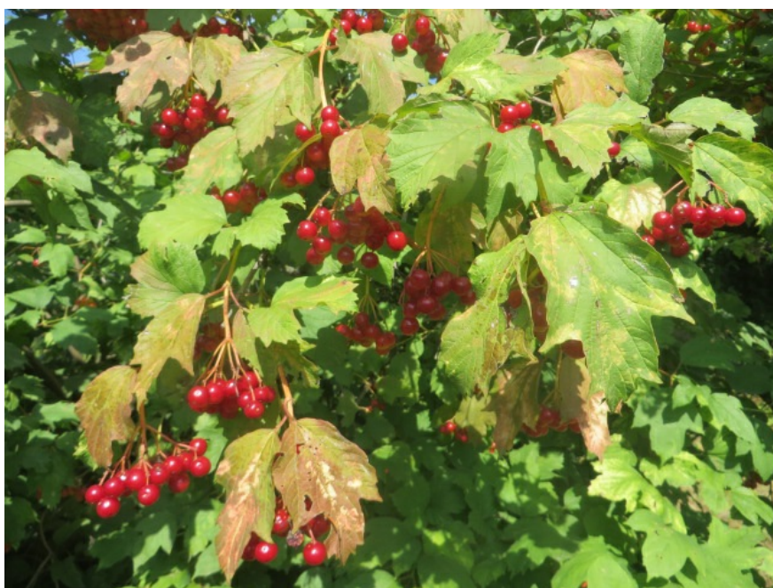
Рис. 7. Калина Пестролистная, территория Главного ботанического сада имени Н. В. Цицина РАН.

Fig. 6. Viburnum opulus L. form № 5, the territory of the Main Botanical Garden n. a. N. V. Tsitsin RAS.