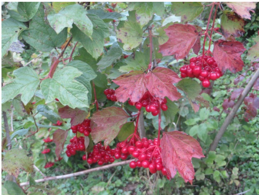
Рис. 5. Калина обыкновенная форма № 33, территория Главного ботанического сада имени Н. В. Цицина РАН.