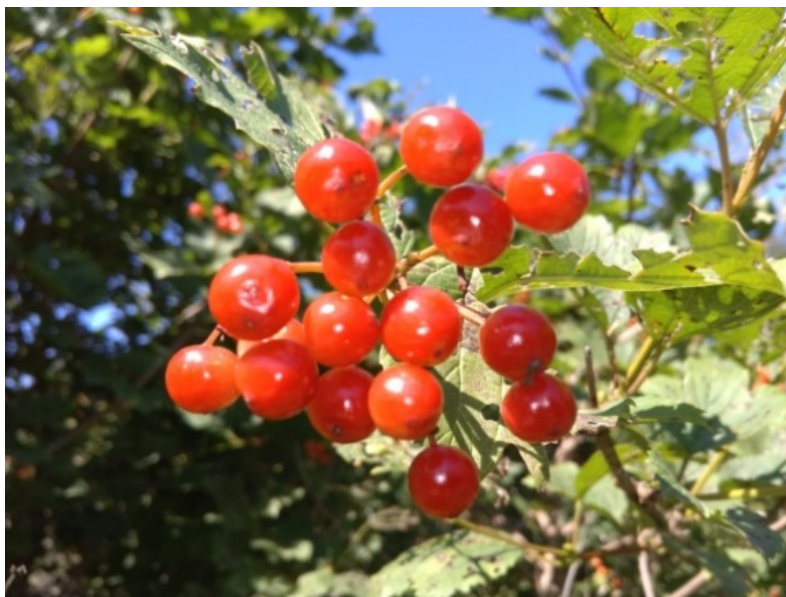
Рис. 6. Калина обыкновенная форма № 5, территория Главного ботанического сада имени Н. В. Цицина РАН.

Fig. 6. Viburnum opulus L. form № 5, the territory of the Main Botanical Garden n. a. N. V. Tsitsin RAS.