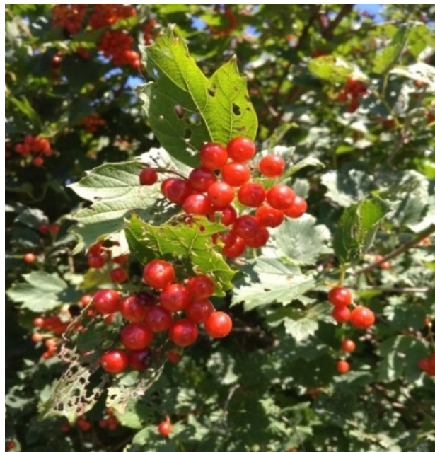
Рис. 3. Калина обыкновенная форма № 26-1, территория Главного ботанического сада имени Н. В. Цицина РАН.

Fig. 2. Viburnum opulus L. 'Krasnaya grozd', the territory of the Main Botanical Garden n. a. N. V. Tsitsin RAS.