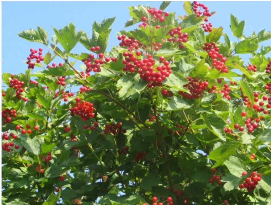
Рис. 4. Калина обыкновенная, форма № 31, территория Главного ботанического сада имени Н. В. Цицина РАН.