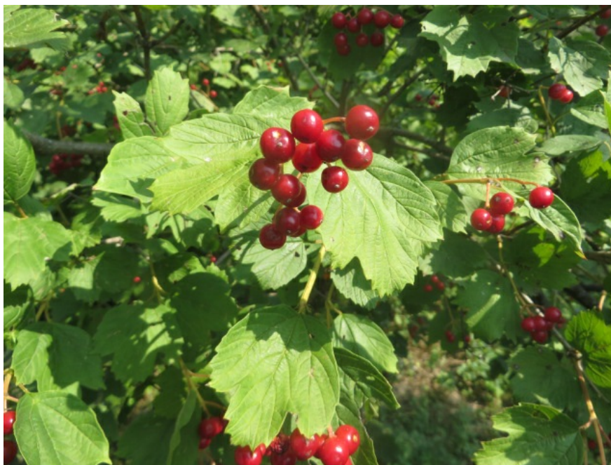
Рис. 1. Калина обыкновенная сорт 'Таёжные рубины', территория Главного ботанического сада имени Н. В. Цицина РАН.

Первые три формы были получены в 1984 году из НИИ садоводства Сибири имени М. А. Лисавенко; отборная форма № 5 из США; сорт 'Красная гроздь' в 1991 году из Мичуринска.