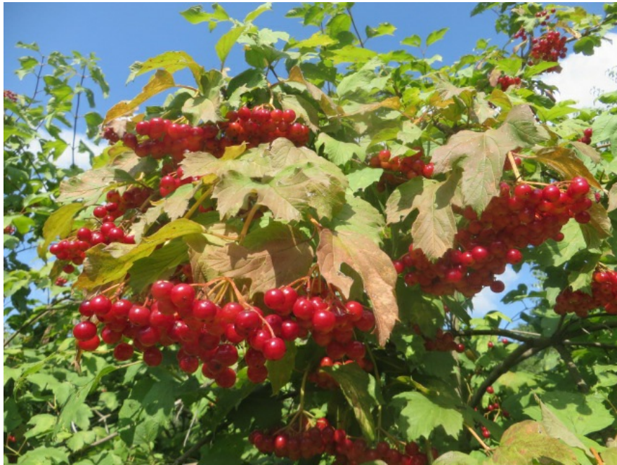
Рис. 2. Калина обыкновенная сорт 'Красная гроздь', территория Главного ботанического сада имени Н. В. Цицина РАН.

Fig. 2. Viburnum opulus L. 'Krasnaya grozd', the territory of the Main Botanical Garden n. a. N. V. Tsitsin RAS.