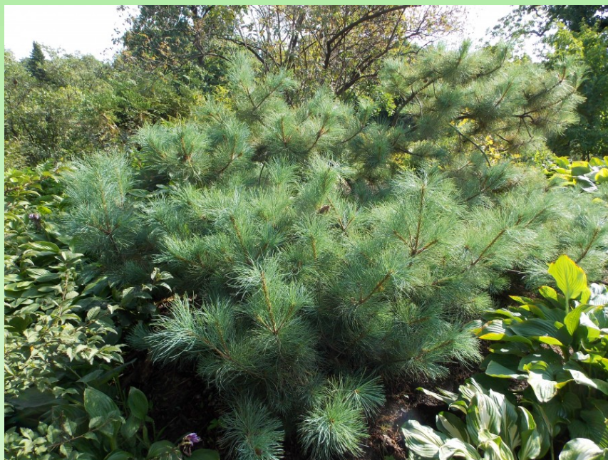
Рис. 2. Pinus pumila в Ботаническом саду Петра Великого (уч. 71).