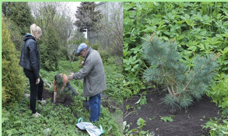
Рис. 5. Посадка Pinus pumila (Pall.) Regel в Ботаническом саду Санкт-Петербургского государственного университета.

В Ботаническом саду Санкт-Петербургского государственного университета до весны 2019 г. не было ни одного экземпляра этого вида. Авторами данной статьи в мае 2019 г. на альпийских горках Ботанического сада (59°56'29.9"N, 30°17'46.7"E) были посажены 2 экземпляра кедрового стланика. Эти растения выращены на Карельском перешейке, в пос. Мельниково (60°54'33.5"N, 29°48'00.9"E) из семян, собранных на восточном склоне горы Глиняной на высоте около 800 м н.у.м. ( 53°13'15.0"N, 158°08'16.5"E), п-ов Камчатка в 2008 г. На момент посадки растения в возрасте 10 лет, высотой 50–60 см., с голубоватой хвоей, жизненное состояние по В. А. Алексееву (1989) – 1, растения находятся в вегетативном состоянии.