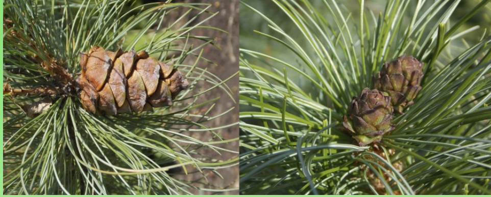
Рис 3. Семеношение Pinus pumila в Ботаническом саду Петра Великого (уч. 71 и 98), шишки перед созреванием.

Fig 3. Harvesting Pinus pumila in the Peter the Great Botanical Garden (section 71 and 98), cones before maturation.