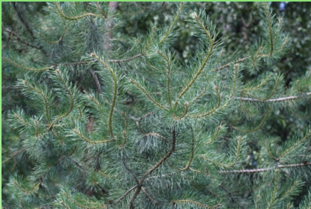
Рис. 3. Характерные змеевидные побеги Pinus sylvestris L. f. serpentina L. V. Orlova & V. V. Byalt f. nova.