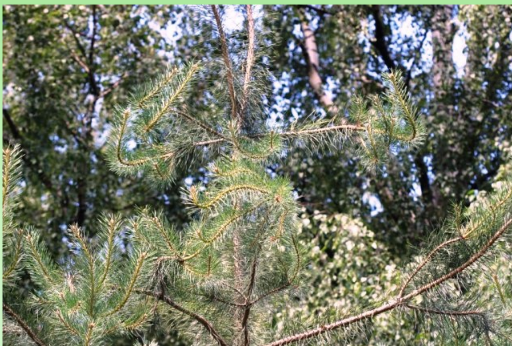
Рис. 2. Молодые посадки Pinus sylvestris L. f. serpentina L. V. Orlova & V. V. Byalt f. nova в Удельном парке в июне 2019 г. (рис. 2-4, фото В. В. Бялта).

Паратип: там же. VI 2019, veg., В. В. Бялт (LE).