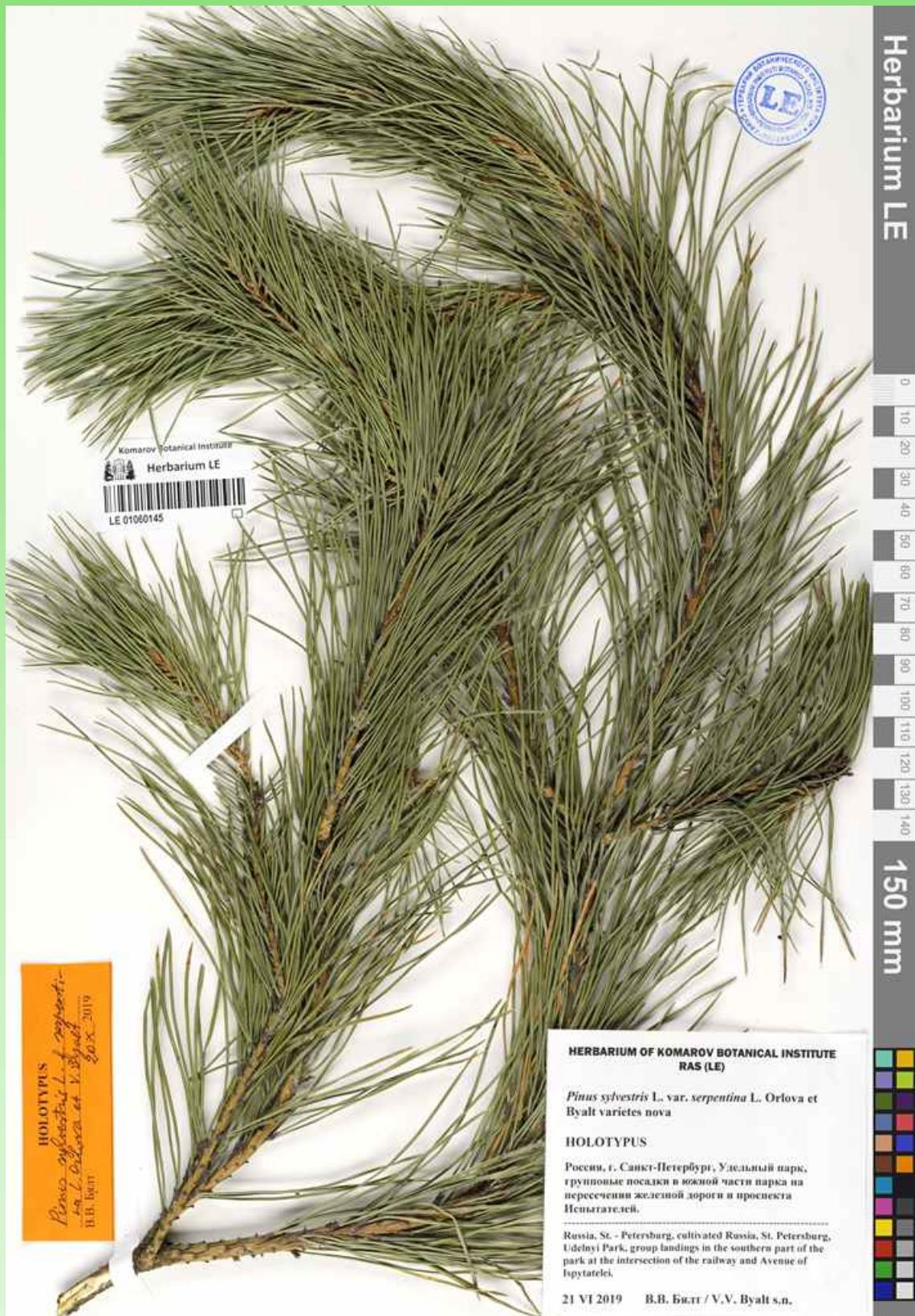
Рис. 5. Голотип Pinus sylvestris L. f. serpentina L. V. Orlova & V. V. Byalt f. nova в Гербарии высших растений БИН РАН (LE).