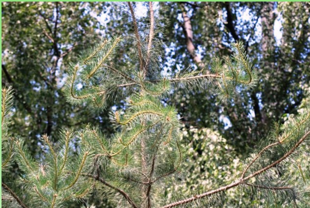
Рис. 2. Молодые посадки Pinus sylvestris L. f. serpentina L. V. Orlova & V. V. Byalt f. nova в Удельном парке в июне 2019 г. (рис. 2-4, фото В. В. Бялта).

Паратип: там же. VI 2019, veg., В. В. Бялт (LE).