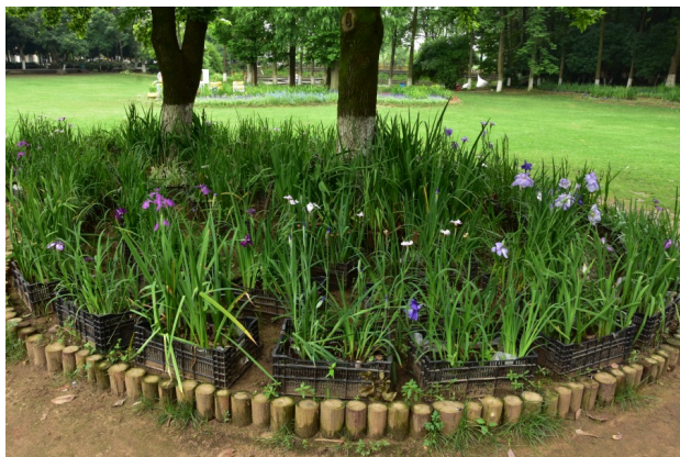
Рис. 25-26. Ирисы представлены в необычном антураже.