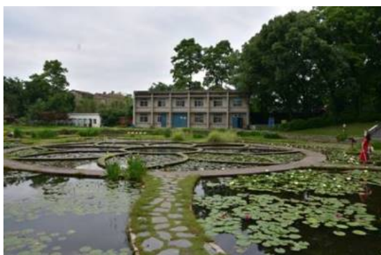
Рис. 7, 8. Часть коллекции нимфей.