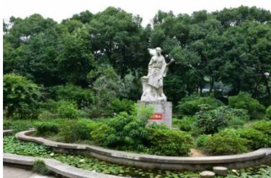
Рис. 16. Памятник Ли Шичжэню.

Fig. 16. Metasequoia glyptostroboides in Gardens exposition.