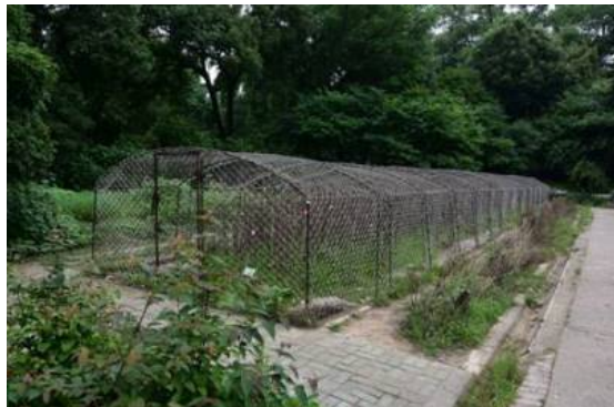
Рис. 17. Закрытая коллекция Papaver somniferum .