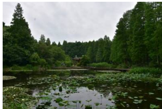
Рис. 16. Metasequoia glyptostroboides в экспозициях Ботанического сада.

Fig. 15. Part of Rhododendron collection.