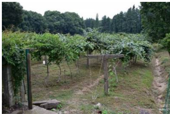
Fig. 3, 4. Living collection of kiwi species and varieties.