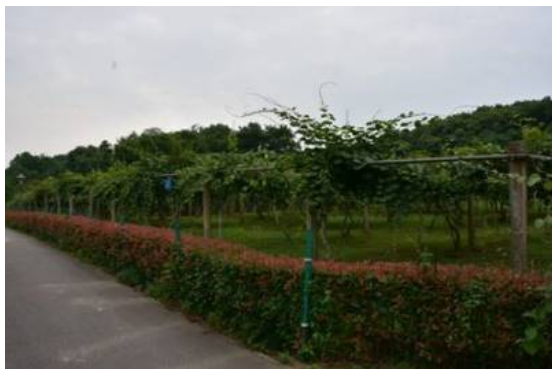
Рис. 3, 4. Живая коллекция видов и сортов киви.