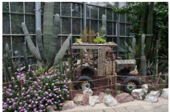
Рис. 19-24. Оранжерейный комплекс Ботанического сада.