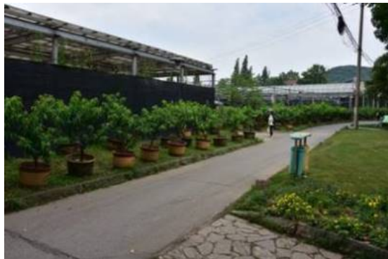
Рис. 13. Часть коллекции Prunus .

Такими же уникальным и неповторимым является и Сад диких плодовых (рис. 13). Прежде всего это «сливы» – виды родов Prunus , Cerasus , Amygdalus , которые часто в англоязычной литературе числятся под названием Prunus . На площади полтора гектара размещены эти коллекции. К слову сказать, образцов видов, форм и сортов рода Amygdalus насчитывается чуть более 100. Самым «ценным» среди них является сорт Amygdalus persica L. cv. Juhuatao (настоящее название вида Prunus persica (L.) Batsch), цветки которого напоминают хризантему (рис. 14). А так же представлены A. davidiana Nash и A. mira (Koehne) T. T. & L. T. Lu (синоним Prunus mira Koehne).