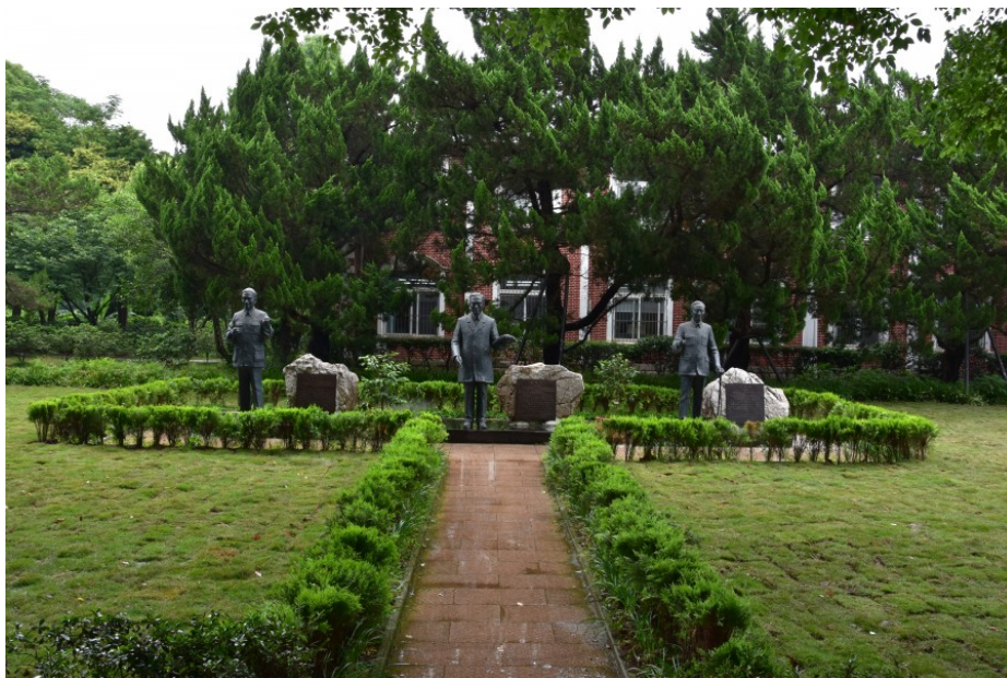
Рис. 27. Скульптурная группа основателей и создателей Ботанического сада.

В саду есть удивительная скульптурная группа "отцов-основателей" сада (рис. 27). Как это важно для памяти и образовательных программ.