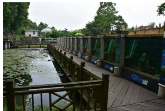
Рис. 9-12. Экспозиция коллекции высших водных растений.