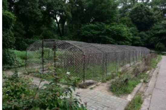
Рис. 17. Закрытая коллекция Papaver somniferum .

Fig. 17. Closed collection of Papaver somniferum .