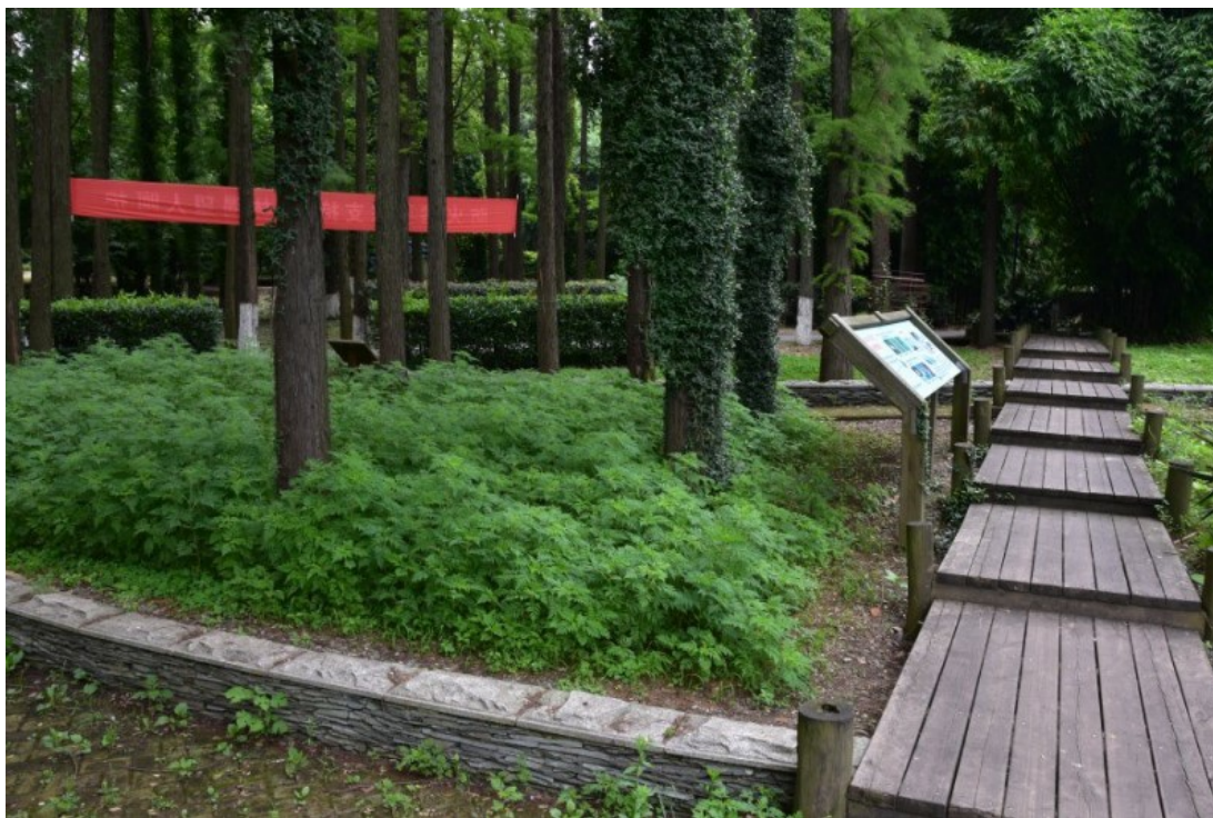
Рис. 18. Фрагмент коллекции-экспозиции сорных и инвазивных видов растений.

Новой коллекцией–экспозицией является сад инвазивных видов растений (рис. 18). Проходя по ней, вдоль дорожек установлено много информационных табличек, почему и где эти растения стали либо сорными, либо перешли в разряд инвазионных.