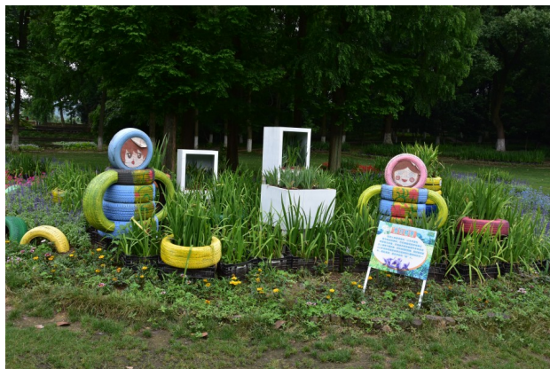
Fig. 25-26. Irises are presented in an unusual setting.

В саду есть удивительная скульптурная группа "отцов-основателей" сада (рис. 27). Как это важно для памяти и образовательных программ.