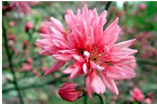
Рис. 14. Amygdalus persica L. cv. Juhuatao .

Fig. 13. Exposition of the Prunus sp. collection.