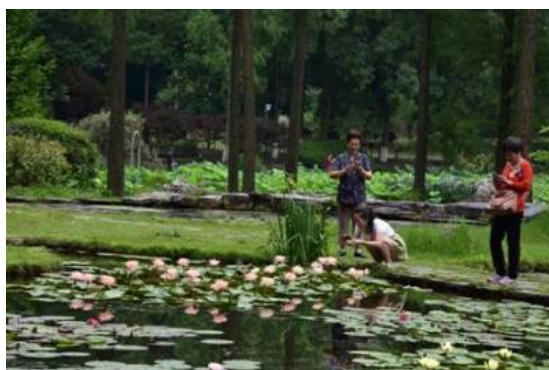
Fig. 7, 8. Part of the collection of Nymphaea sp.

В саду представлено 16 специализированных садов. Гордость составляют коллекции актинидий или киви ( Actinidia ), пионов ( Paeonia ), азалий ( Rhododendron ), слив (виды родов Prunus , Cerasus , Amygdalus , etc.), хризантем ( Chrysanthemum ), лотосов ( Nelumbo ), нимфей ( Nymphaea ), лекарственных растений и растений высокогорий Центрального Китая. Некоторые из коллекций – это национальное достояние Китая (National Germplasm Repository conserve). Что является гордостью не только города, провинции, но страны в целом. Эти коллекции подлежат хорошему финансированию, на их поддержание, формирование и развитие.