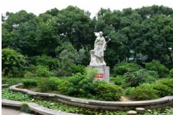
Рис. 16. Памятник Ли Шичжэню.