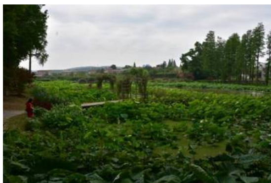
Fig. 5, 6. Part of the collection and exhibition of Nuphar sp.