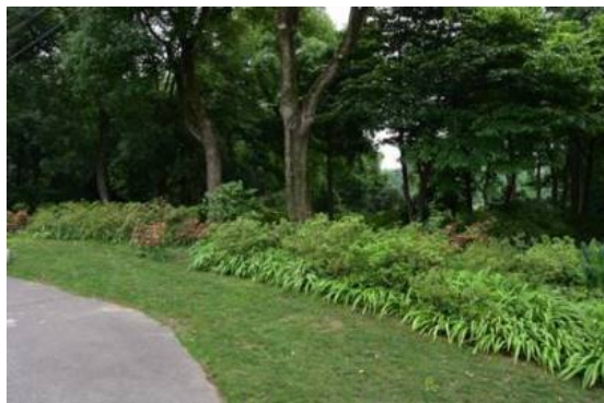
Рис. 15. Фрагмент коллекции азалий.

Fig. 14. Amygdalus persica L. cv. Juhuatao .