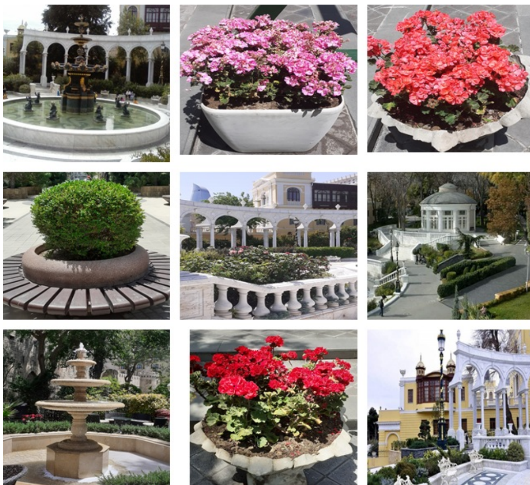
Рис. 6. Малые архитектурные формы.