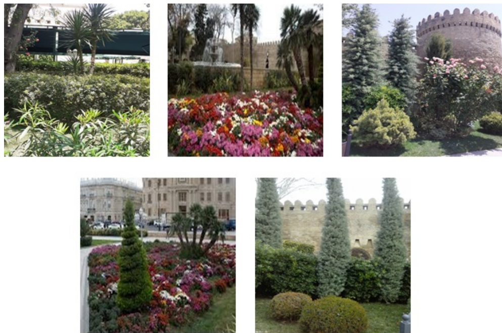
Рис. 5. Оригинальные формы экспозиций в свободном стиле.