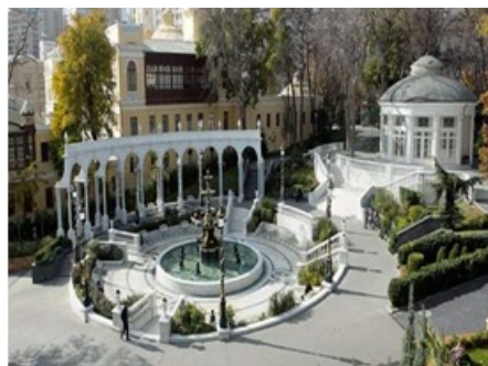
Рис. 1. Общий вид сада Филармонии.