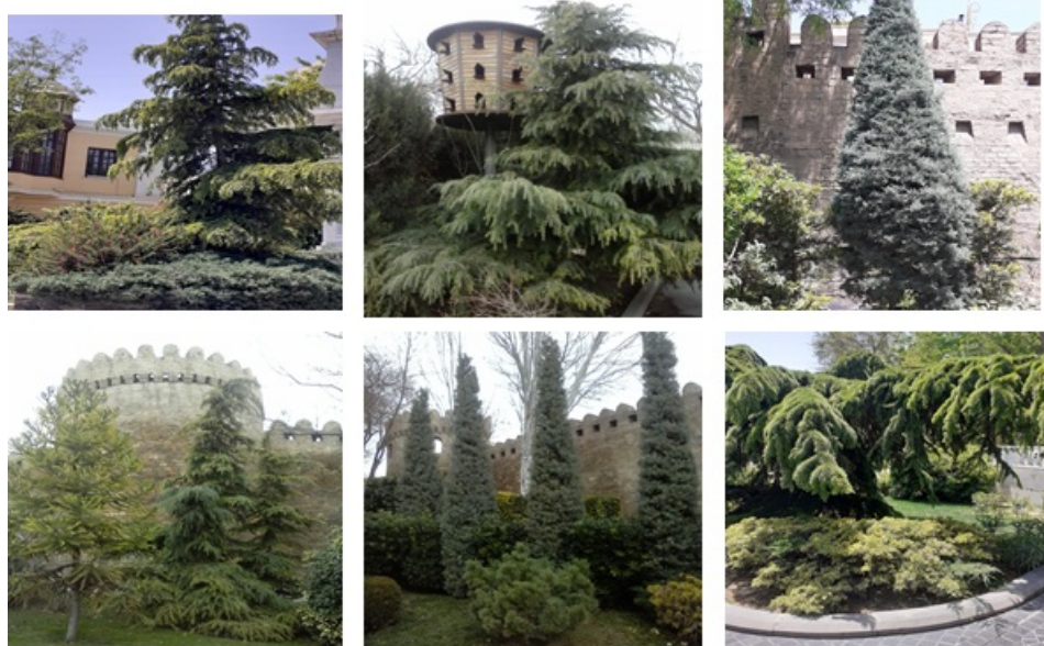
Рис. 2. Хвойные деревья и кустарники.

При проведении научно-исследовательской работы во II декаде мая 2020 г. на территории сада Филармонии проведены наблюдения, собран гербарий и определен таксономический состав декоративных деревьев, кустарников и травянистых растений из 34 семейств, 45 родов и 55 видов, изучены формы создания экспозиций, правила группировки растений в экспозициях, использования малых архитектурных форм. Экспозиции созданы в регулярном и в ландшафтном или пейзажном стиле. Малые архитектурные формы усиливают художественно-архитектурный образ паркового ансамбля. В центре экспозиции в основном высаживаются вечнозелёные деревья и кустарники, а по краям цветущие травянистые растения. Вокруг площадок отдыха расположены цветники и пальмы, каменные террасы сада покрыты вьющимися растениями. Декоративный фонтан в центре большого бассейна с красивыми скульптурами улучшает микроклимат территории сада. Спереди крепостных стен расположены в основном хвойные деревья и кустарники.