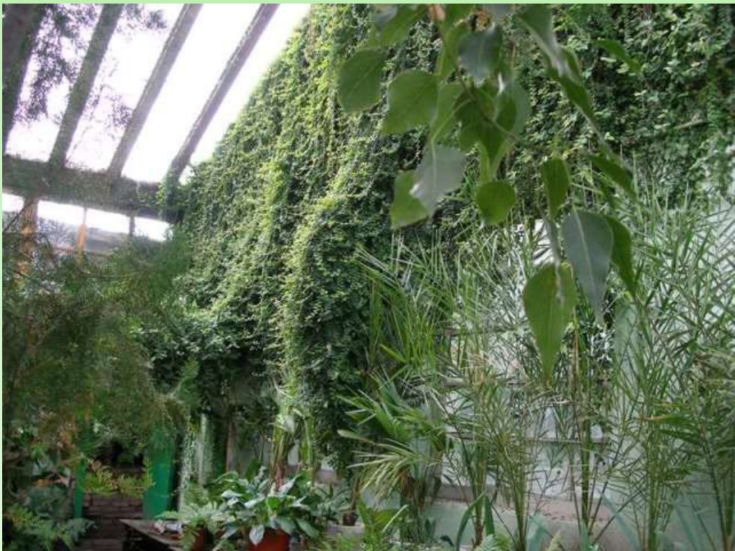
Рис. 9. Субтропический зал, 2007 г.