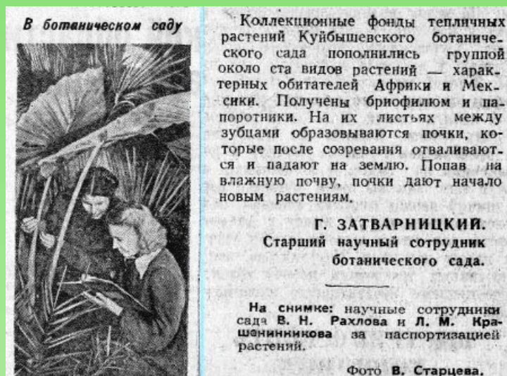
Рис. 2. Заметка в газете "Волжская коммуна" от 12.02.1950 г.