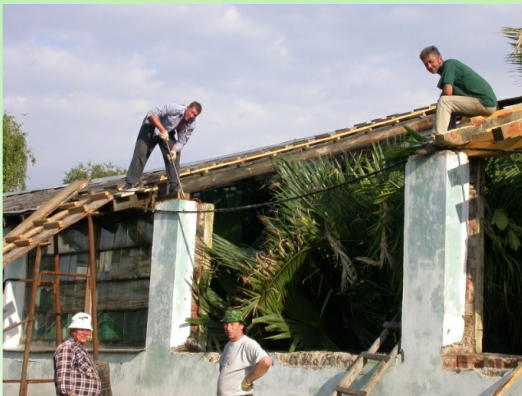
Рис. 7. Ремонт крыши, 2004 г.

В 2015 году, после слияния Самарского государственного университета и Аэрокосмического университета, Сад был включен в состав Самарского национального исследовательского университета имени академика С. П. Королёва. В 2016-2017 годах провели очередную реконструкцию оранжереи: полностью переделали крышу, подняв её на 70 см (теперь максимальная высота крыши в тропическом зале составила 8,5 м), и заменили деревянную конструкцию на металлическую, поменяли системы отопления и освещения, обновили дорожки в больших залах, сделали вентиляцию (рис. 11).