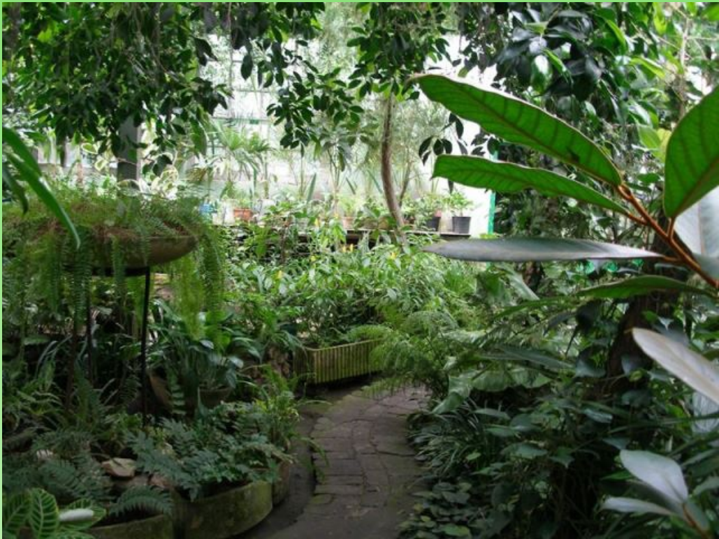
Рис. 8. Субтропический зал, 2007 г.