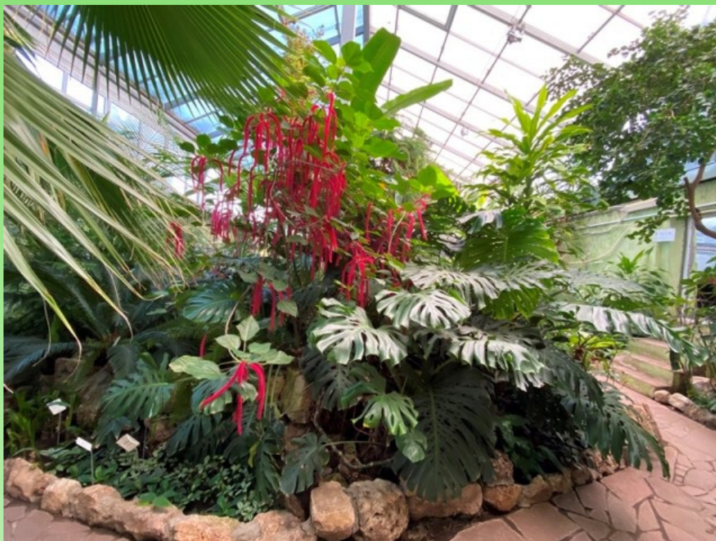
Рис. 14. Тропический зал, 2020г.