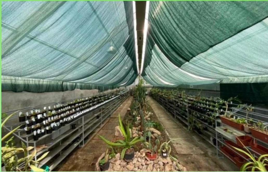
Рис. 12. Четвёртая разводочная теплица - экспозиция суккулентов, 2020 г.

Pic. 12. The fourth distribution greenhouse - exposition of succulents, 2020.