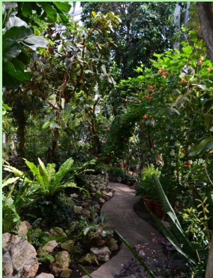
Рис. 13. Субтропический зал, 2019 г.

Pic. 12. The fourth distribution greenhouse - exposition of succulents, 2020.