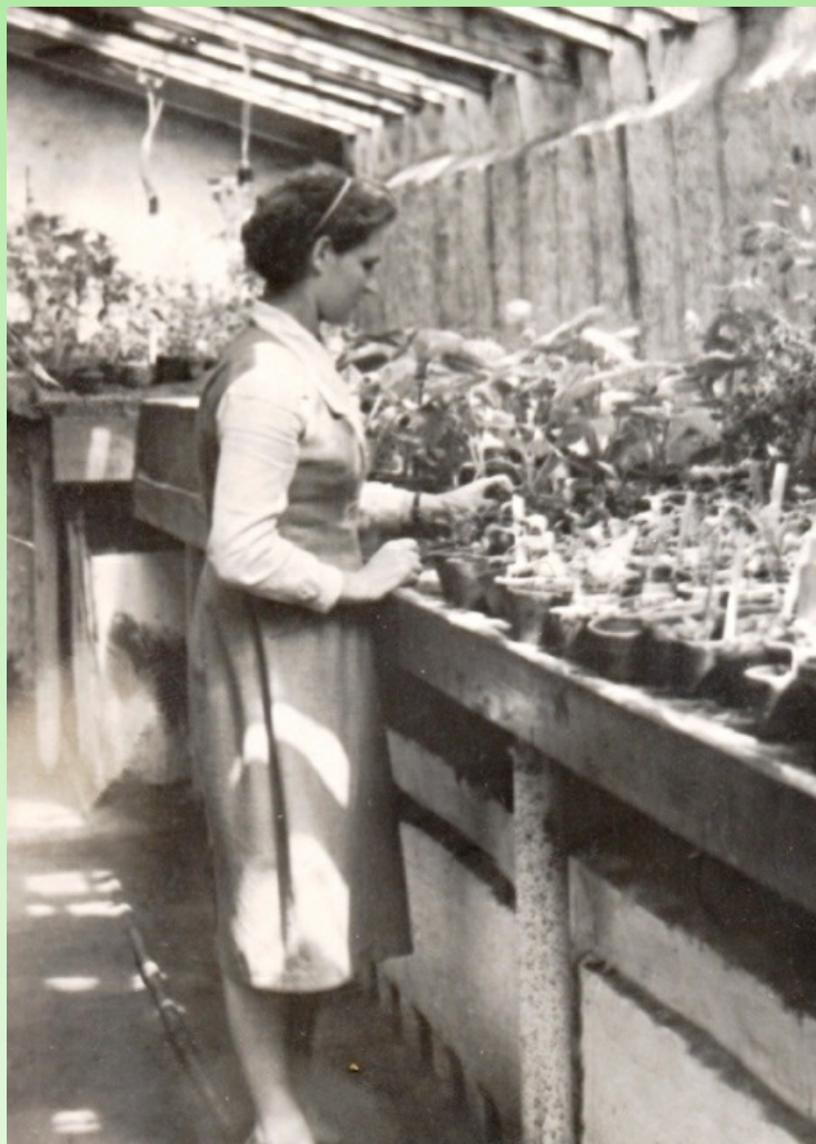
Рис. 3. Сотрудница оранжереи за осмотром сеянцев, 1961 г.