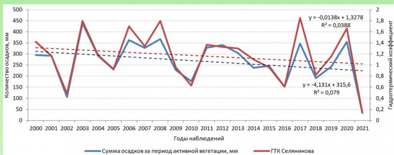
Рисунок 2. Динамика суммы осадков и ГТК увлажнения за период активной вегетации.

Регрессионный анализ показал, что динамика суммы осадков и ГТК имеет нисходящий тренд, то есть существует тенденция изменения метеоусловий на более засушливые (рисунок 2). Построенные регрессионные модели статистически значимы (для суммы осадков F_{\text{факт.}}=1,71 > F_{\text{крит.}}=0,21 , для ГТК F_{\text{факт.}}=0,81 > F_{\text{крит.}}=0,38 ). Достоверного изменения сумм эффективных и активных температур не выявлено ( F_{\text{факт.}} < F_{\text{крит.}} ).