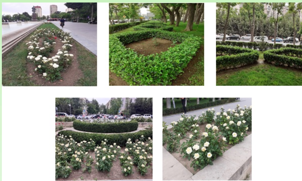
Рис. 2. Геометрические формы экспозиций в регулярном стиле.

В парке вокруг памятника Самеда Вургуня создана красивая, круглая форма из цветущих красных и белых роз. В центральной части парка имеются фонтаны прямоугольной и круглой формы. Фонтаны красиво смотрятся и в жаркие летние дни создают прохладу в парке. Вокруг фонтанов цветут травянистые растения – ирисы, маргаритки, примулы. Розовые, белые, красные розы цветут в различных формах композиций и придают парку ещё большую красоту. Малые архитектурные формы – фонтаны, фонари, скамьи создают удобные условия для отдыхающих здесь людей.