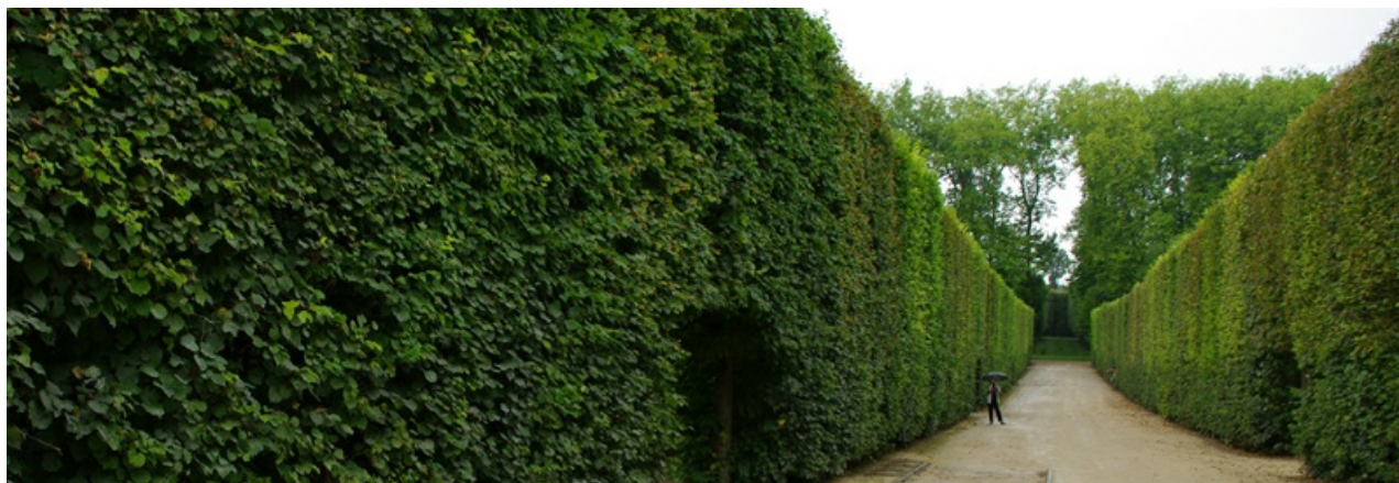
Рис.2. Тихие аллеи Версаля.