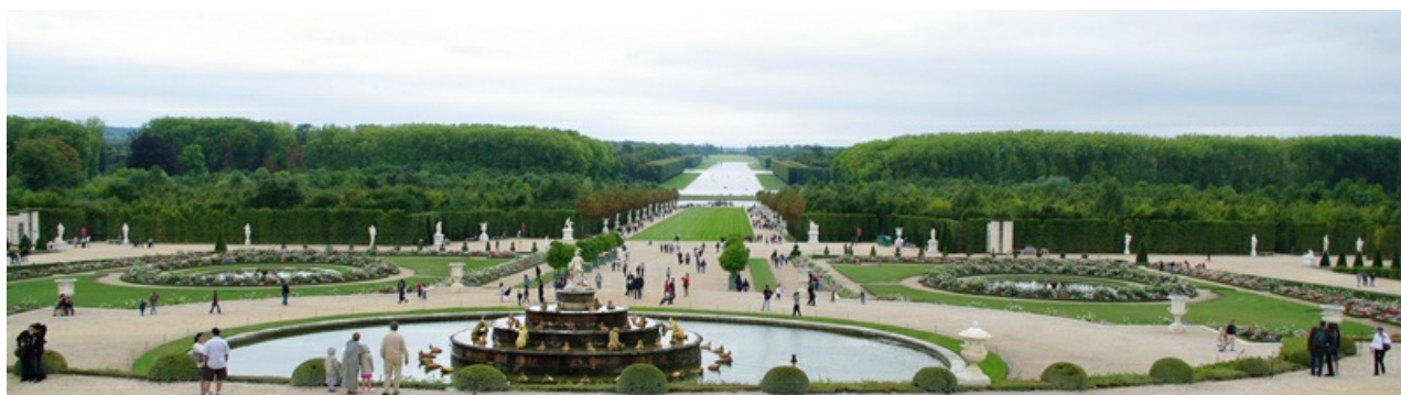
Рис.3. Вид со стороны Короля.

Сир, Вы могли бы увидеть картину этой битвы, находясь на безопасном расстоянии, с верхней террасы перед дворцом. По окончании битвы можно включить фонтаны для того, чтобы смыть кровь с травы и дорожек Версаля.