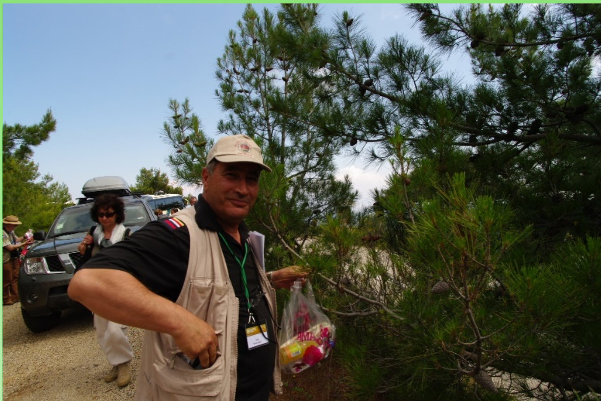
Тофик добывает генетические ресурсы. Экспедиция однако...