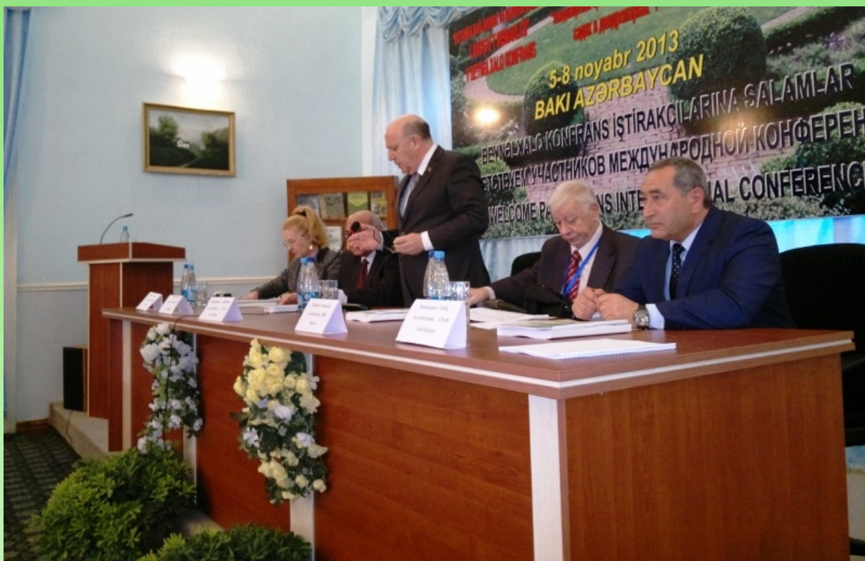
Открытие конференции в классическом стиле