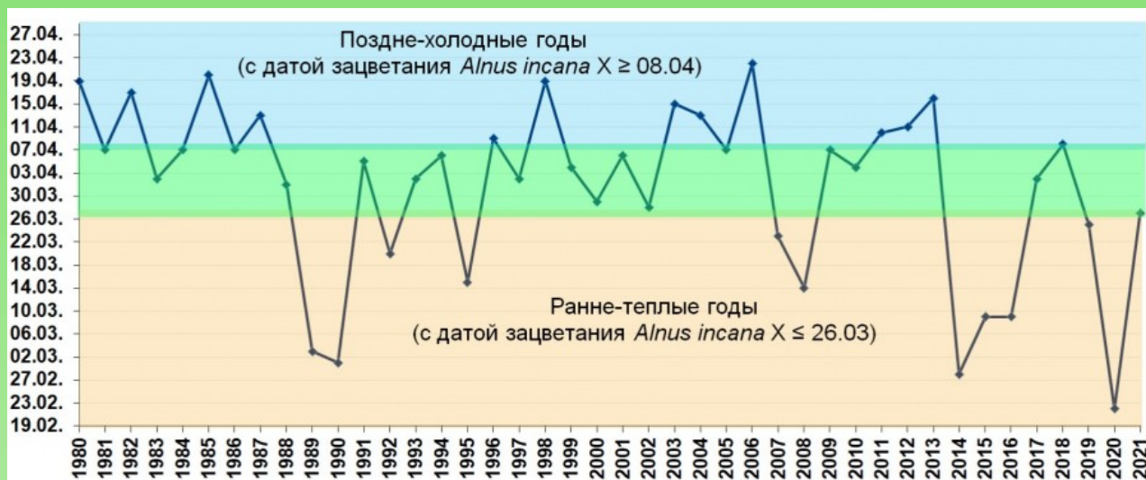
Рис. 1. Даты зацветания Alnus incana (1830-2021 гг.) – индикатор короткопериодных колебаний климата.