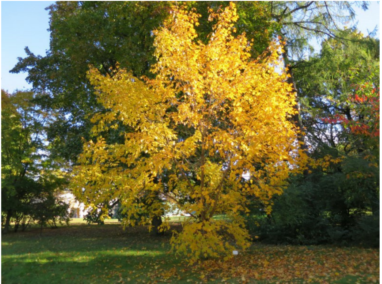
Рис. 2. Acer mono Maxim. f. mono в парке БИН РАН на уч. 145 осенью.