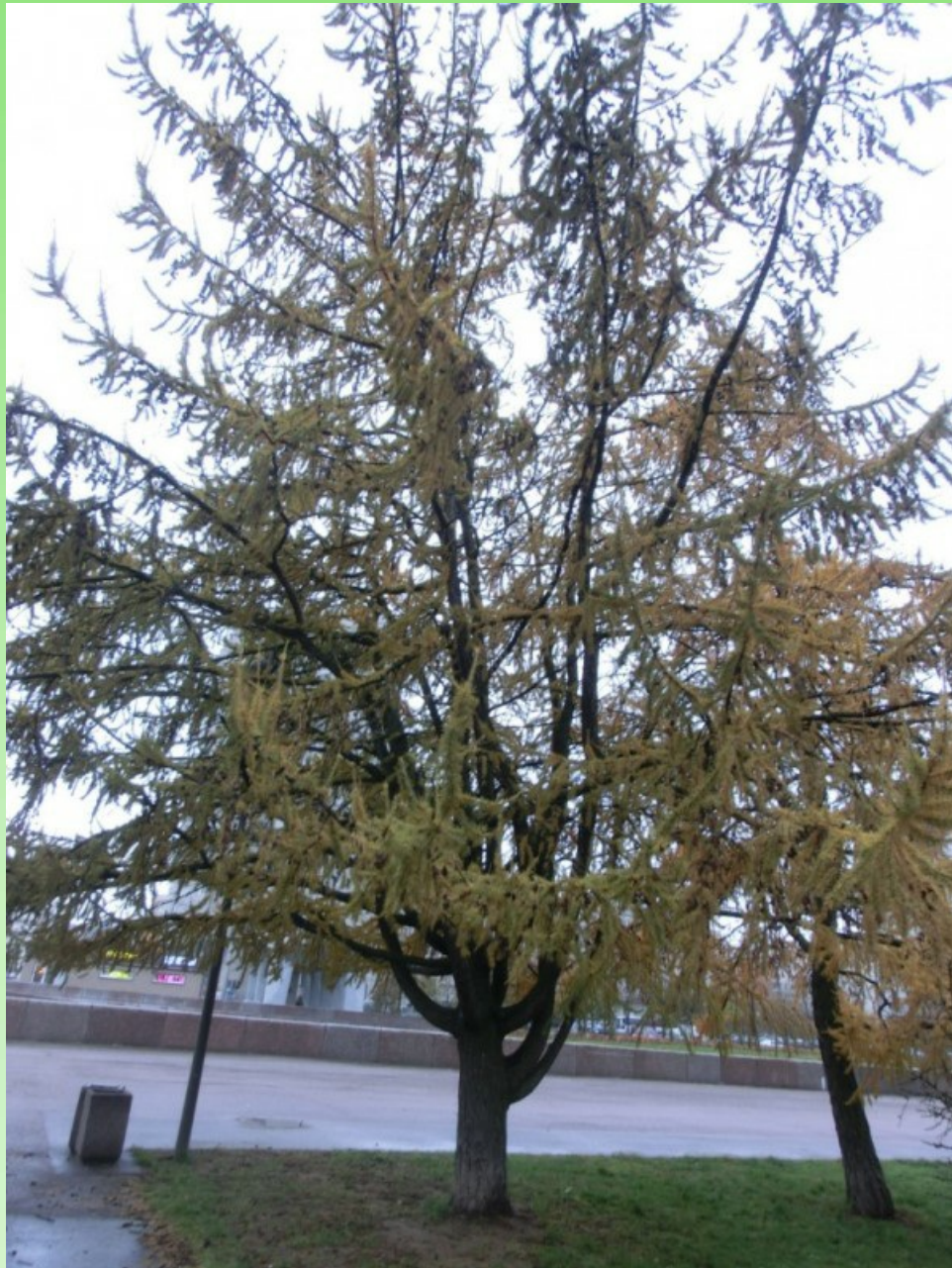
Рис. 1. Larix sibirica Ledeb. f. candelabriformis L. V. Orlova, V. V. Byalt et G. A. Firsov – культивируется недалеко от станции метро Приморская в посадках лиственницы вдоль набережной реки Смоленки.

Fig. 1. Larix sibirica Ledeb. f. candelabriformis L. V. Orlova, V. V. Byalt et G. A. Firsov – cultivated near the Primorskaya metro station in larch plantings along the river embankment of Rv. Smolenka.