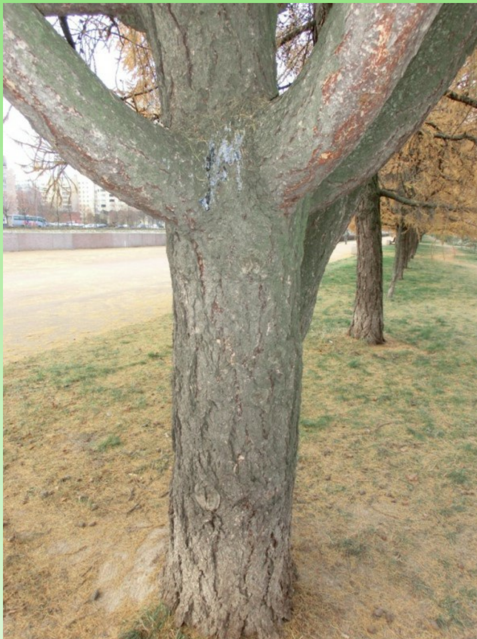
Рис. 4. Нижняя часть ствола Larix sibirica Ledeb. f. candelabriformis L. V. Orlova, V. V. Byalt et G. A. Firsov до первых скелетных ветвей.

Дерево осмотрено нами на феноэтапе окончания подсезона «Глубокой осени» и наступления подсезона «Предзимье», что в этом году совпало с началом фенологической зимы, 16 ноября 2023 г. Оно успело закончить вегетацию, хвоя полностью пожелтела и находилась на начальной фазе опадения. На дереве представлены зрелые шишки текущего года и старые, сохранившиеся с предыдущих лет. Они не отличаются по форме и размерам от шишек соседних лиственниц, относящихся к типовой форме.