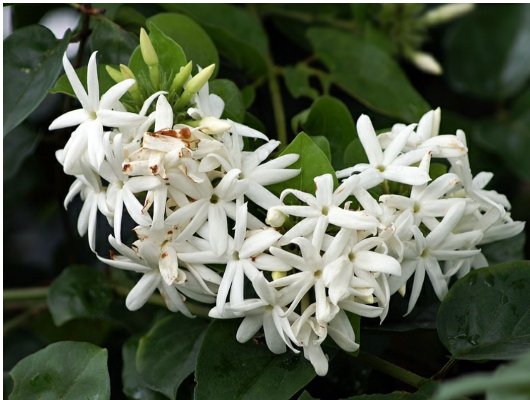
Рис. 6. Jasminum multiflorum (Burm. f.) Andrews в частном саду.