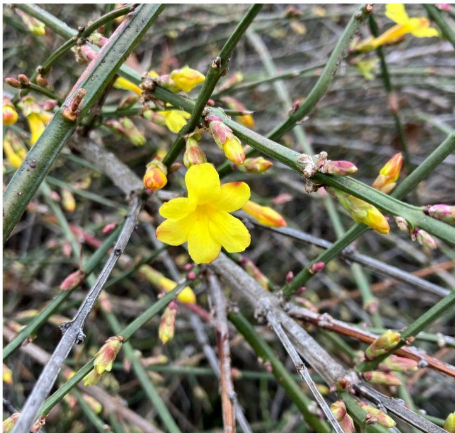
Рис. 7. Цветущий Jasminum nudiflorum Lindl. в посадках.