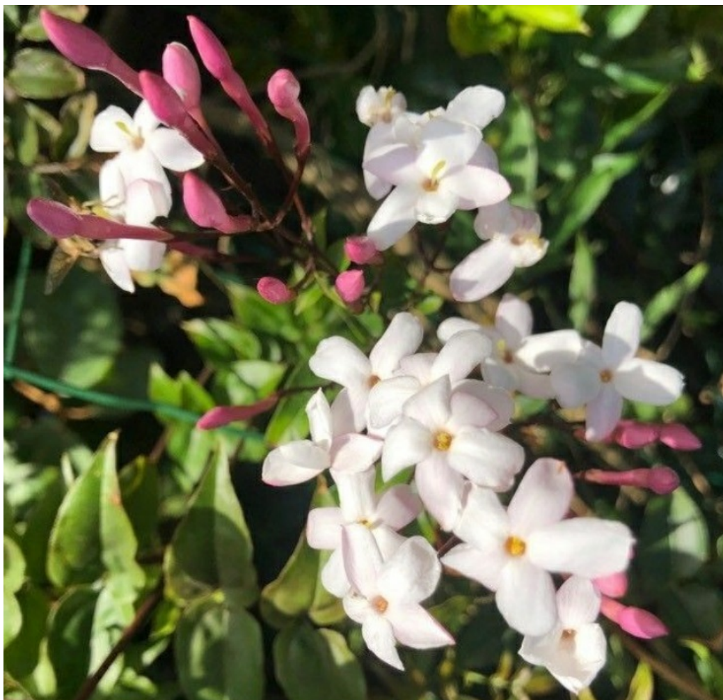
Рис. 8. Jasminum officinale L. в полном цвету в саду.