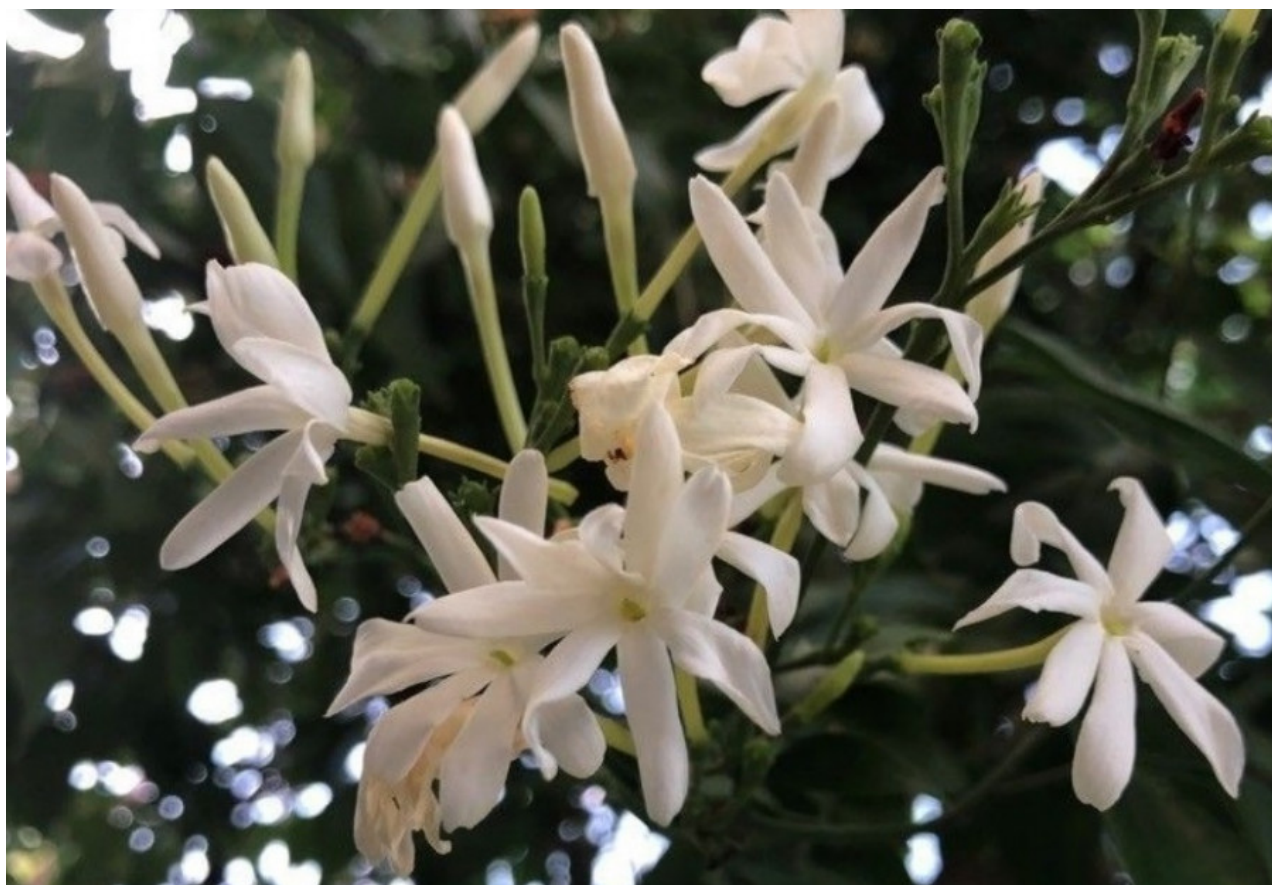
Рис. 3. Цветки и бутоны Jasminum grandiflorum L.

Чужеродный культивируемый вид (эргазиофит). Вьющийся кустарник, растущий в основном в субтропических биомах (POWO, 2024). В природе встречается главным образом в горных и речных долинах, в лесах на горных склонах, среди скал и в рощах. Он используется в качестве лекарства, имеет экологическое применение и употребляется в пищу (POWO, 2024). Листья и цветы издавна известны в народной медицине, листья обладают вяжущим действием. Все растение считается противогельминтным и мочегонным средством. Этот вид выращивают как декоративное растение из-за его ароматных цветов. Из этого жасмина производят цветочные духи, которые стоят очень дорого. Кроме того, он является национальным цветком Пакистана (Nasyr, 1979). Дикорастущий подвид этого жасмина (subsp. floribundum ) также используют в Аравии как лекарственное растение. Сушеные листья кипятят в воде и принимают теплыми как чай, чтобы облегчить проблемы с пищеварением, такие как неясные боли в животе, колики и дизентерия. Листья растирают в пасту и прикладывают к ожогам кожи. Активными соединениями являются жасмон, кверцетин, изокверцетин и рутин (Schopen, 1983; Miller, Morris, 1988; Ghazanfar, 1994). Jasminum grandiflorum – наиболее широко используемый жасмин в парфюмерии. Его аромат богатый и насыщенный, со сладкими фруктовыми нотками, напоминающими запах абрикосов и бананов (Ghazanfar, 2015).