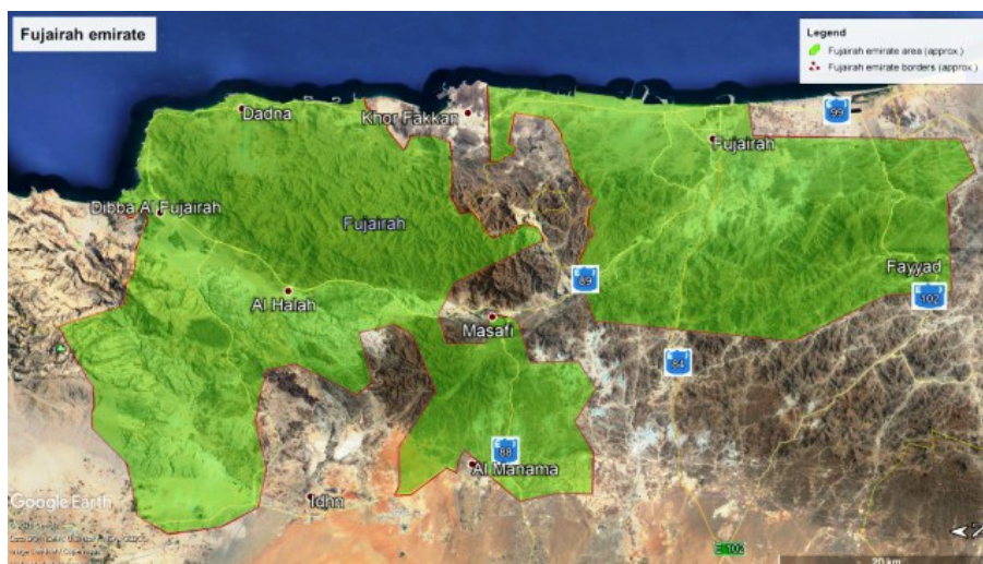
Рис. 1. Карта эмирата Фуджейра

При изучении в Фуджейре видового состава Оливковых, дикорастущих и интродуцентов открытого грунта, были обследованы места культивирования растений в различных районах эмирата Фуджейры и самого города Фуджейра (рис. 1). Известное место произрастания дикой оливы на «Оливковом плато» в окр. Хатты (Feulner, 2014) нам посетить не удалось и мы приводим её по литературным данным. Инвентаризация проводилась с использованием маршрутного метода. Маршруты охватывали различные участки в горах, на побережье, а также парки, скверы, бульвары и набережные, уличные посадки и придомовые территории, некоторые частные сады и питомники растений. В той или иной мере были обследованы следующие населённые пункты эмирата Фуджейра: Бидия (Bidiyah), Аль Кидфа (Al Qidfa), Аль Гурфа (Al Gurfa), Мазафи (Masafi), Аль Куррая (Al Qurraya), Аль Сиджи (Al Siji), Аль Фуджейра (Al Fujairah), Аль Таваин (Al Tawyeen), Аль Хала (Al Halah), Аль Битна (Al Bathnah), Шарм (Sharm), Дибба (Dibba Fujairah), Аль Фарфар (Al Ferfar), Аль Ака (Al Aqah), Аль Хейл (Al Hail), Рул Дадна (Rul Dadnah), Мерба (Mirbah), Аль Тайба (Al Taiba) и Альвала (Awhala).