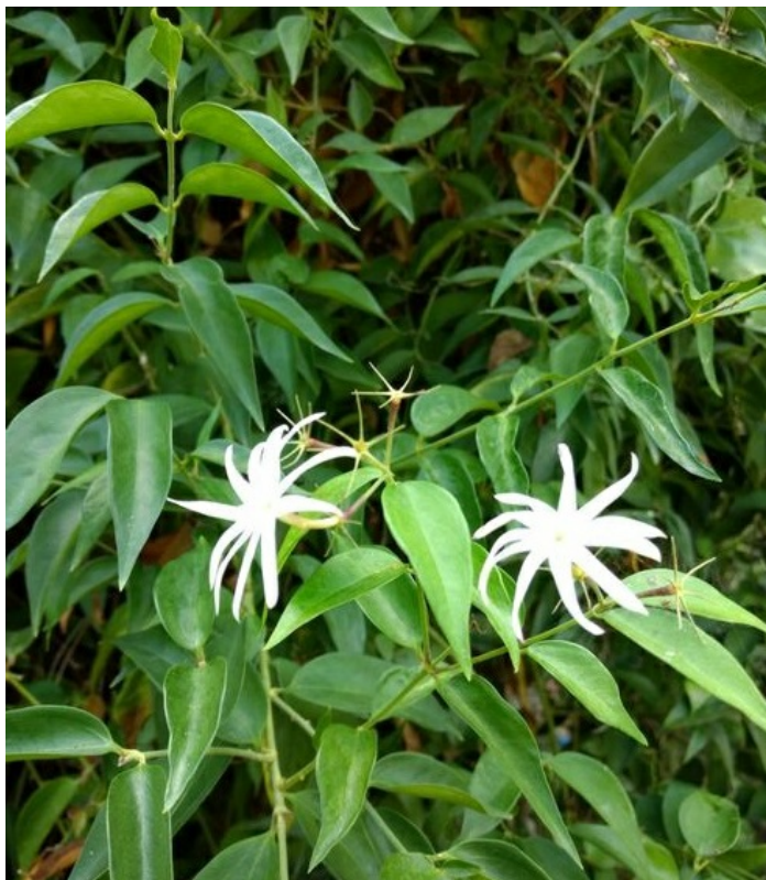
Рис. 4. Культивируемый Jasminum laurifolium Roxb. ex Hornem.