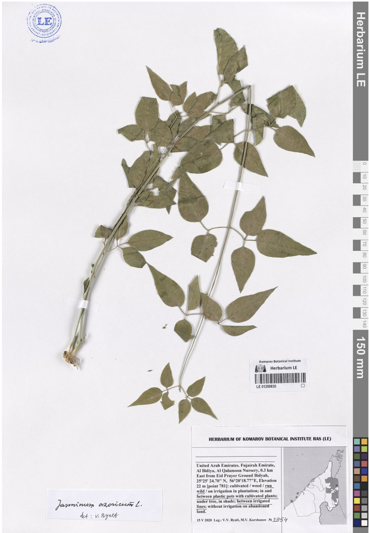
Рис. 2. Гербарный образец Jasminum azoricum L. в Гербарии БИН РАН (LE: 01259830).