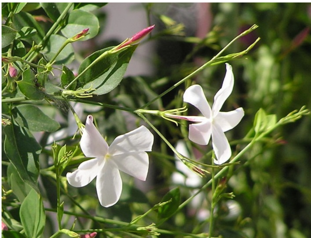
Рис. 9. Jasminum polyanthum Franch. в частном саду в Фуджейре.

В лечебных целях используют все части растения. Листья применяют, как средство снижающее лактацию. Как заживляющее средство в виде горячих компрессов накладывают на кожные язвы. Корни в сыром виде используются при головной боли, бессоннице. В традиционной восточной медицине рекомендуется для приёма перед операциями. Считается, что экстракт на вине кусочка корня 2—3 см, вызывает снижение болевых ощущений на 1 день, длиной 5 см — 2 дня. Эфирное масло применяют в качестве антидепрессанта. Масло используют для лечебных ванн и добавляют в масло для массажа при мышечных болях. Цветки добавляют в чай для аромата (Князева, Князева, 2008).