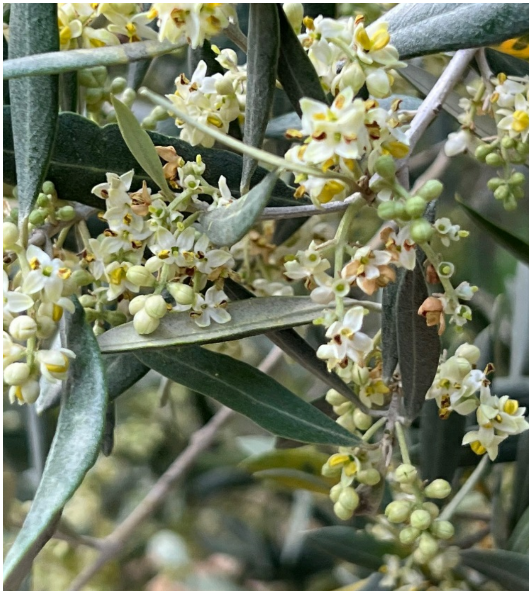
Рис. 12. Цветущая Olea europaea L. в саду в горах в окр. пос. Тавайян.

Lectotype (Green & Wickens, 1989: 294): Herb. Clifford: 4, Olea 1 α (BM-000557513). On protologue: «Habitat in Europa australi».