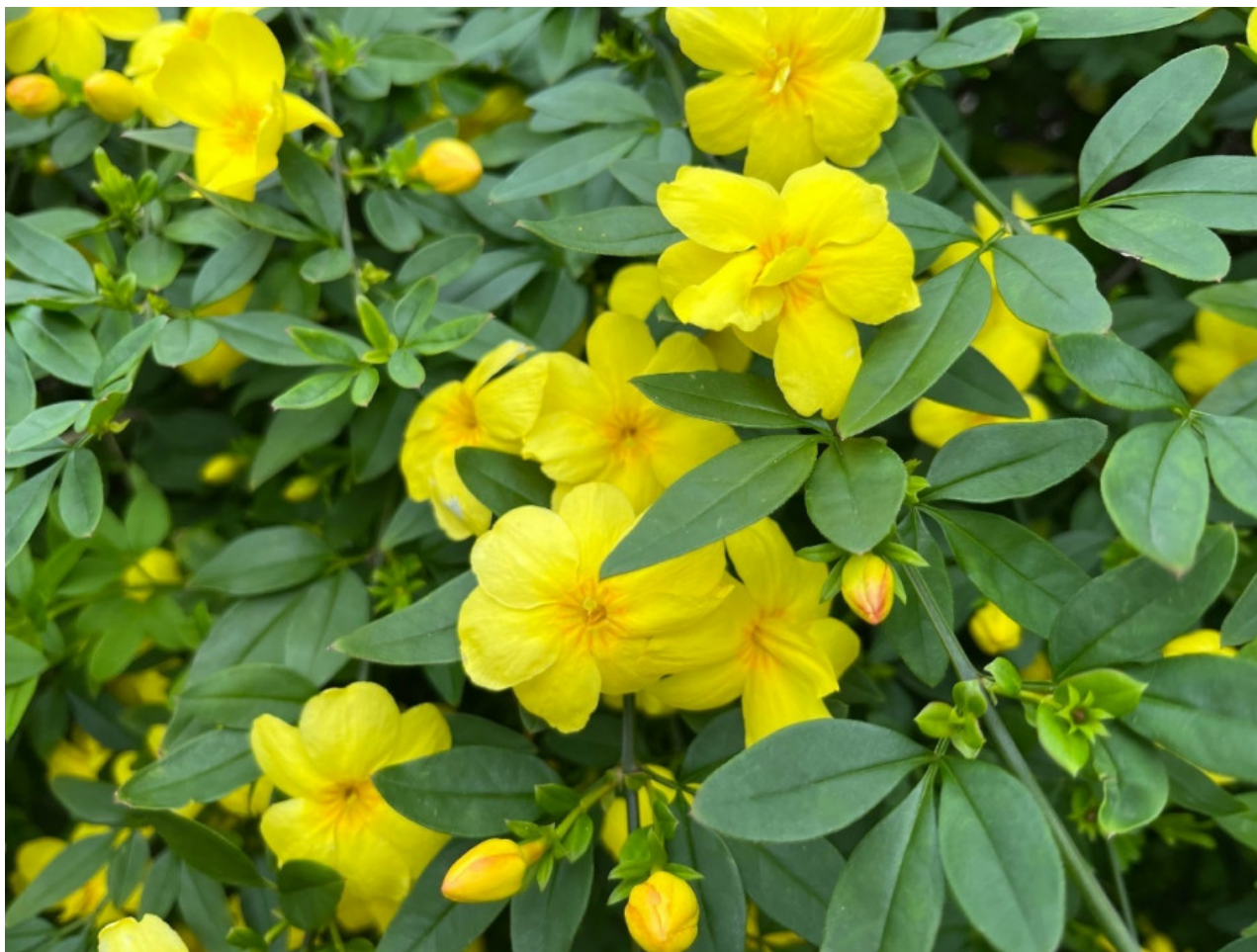
Рис. 5. Jasminum mesnyi Hance в полном цвету.