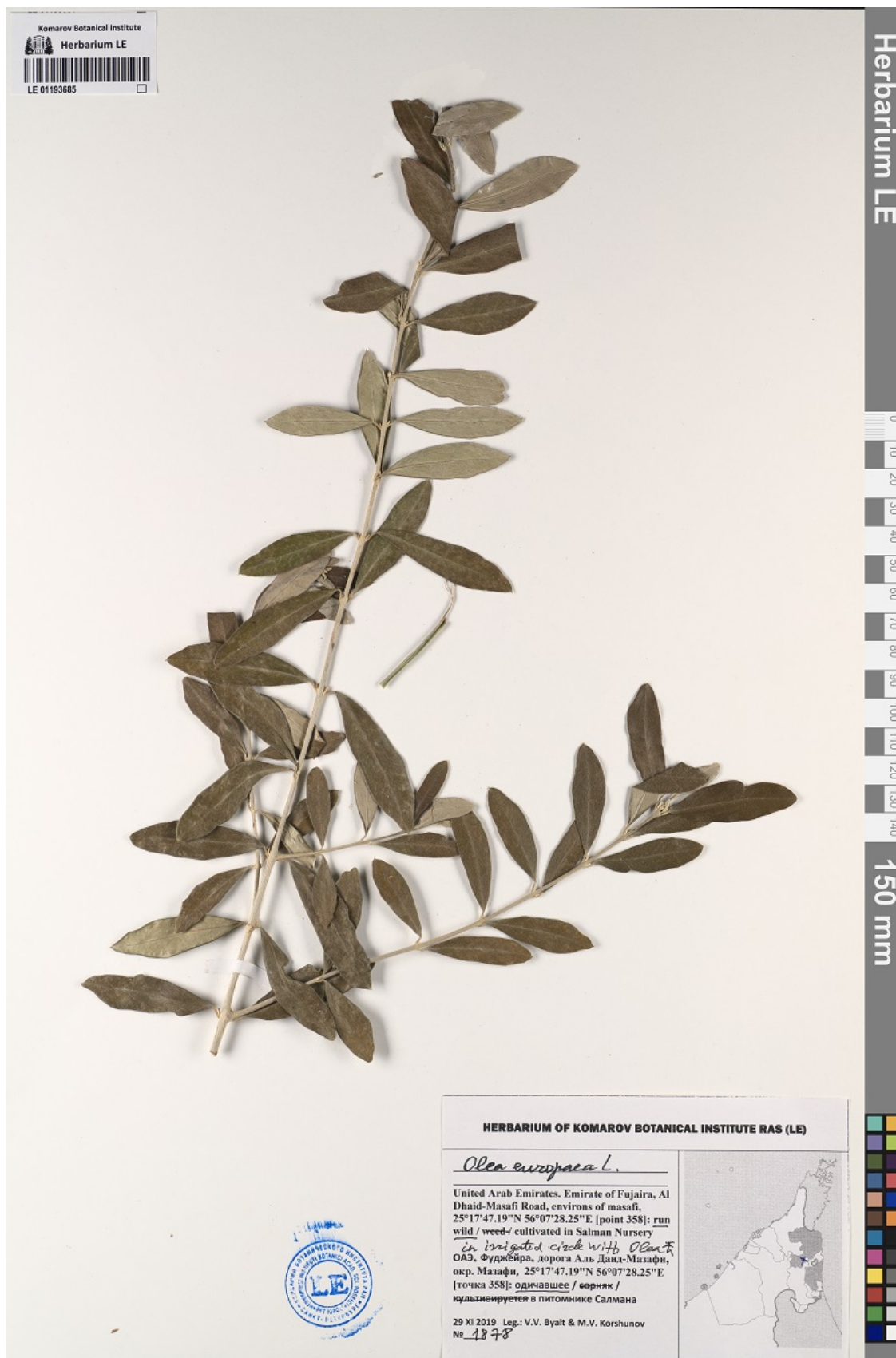
Рис. 13. Гербарный образец Olea europaea L. из окр. г. Мазафи (LE 01193685).