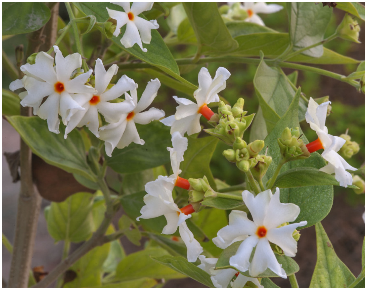
Рис. 11. Цветки Nyctanthes arbor-tristis L. с характерной оранжевой трубкой венчика.

Исследованные образцы: образцы не были собраны.