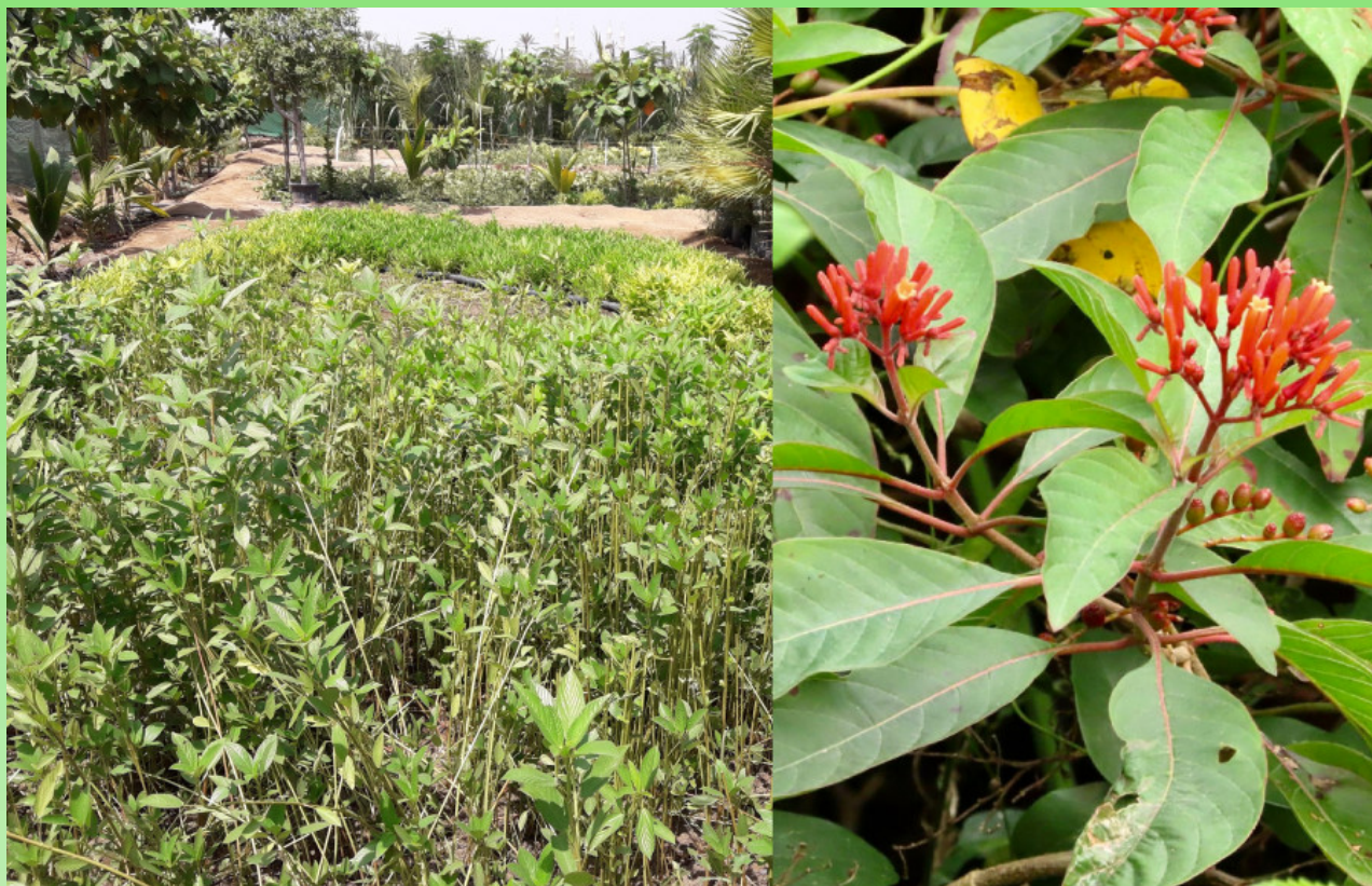
Рис. 7. Укоренённые черенки в питомнике растений и цветущая Hamelia patens .