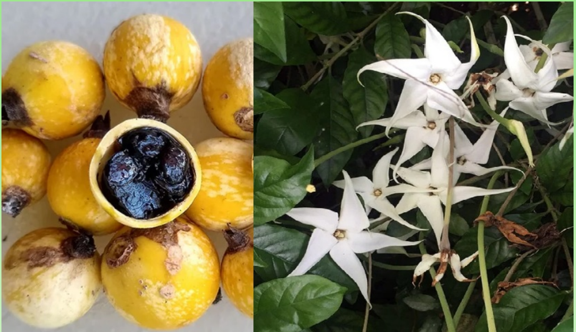
Рис. 13. Плоды и цветки Rosenbergiodendron formosum .

Rosenbergiodendron formosum довольно широко распространённый, но местами имеется угроза его существованию, в связи с чем он был включен в Красный список МСОП как вид, находящийся под угрозой исчезновения в 2018 году. При этом он отнесен к категории – LC «вызывающий наименьшие опасения» (Condit, 2019).