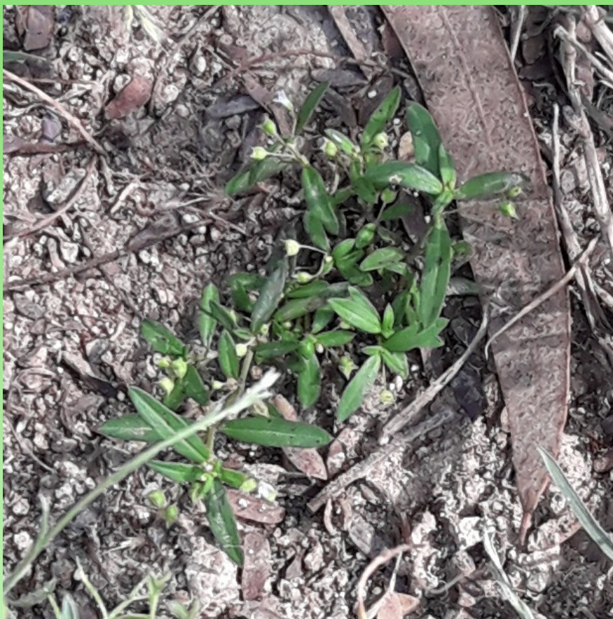
Рис. 15. Oldenlandia corymbosa на пустыре около стены сада в пос. Луаллайя (окр. г. Хор-Факкан, Шаржа) под эвкалиптами.

Fig. 15. Oldenlandia corymbosa in a vacant lot near the garden wall in the village of Luallaya (near Khor-Fakkan, Sharjah) under Eucalyptus trees.