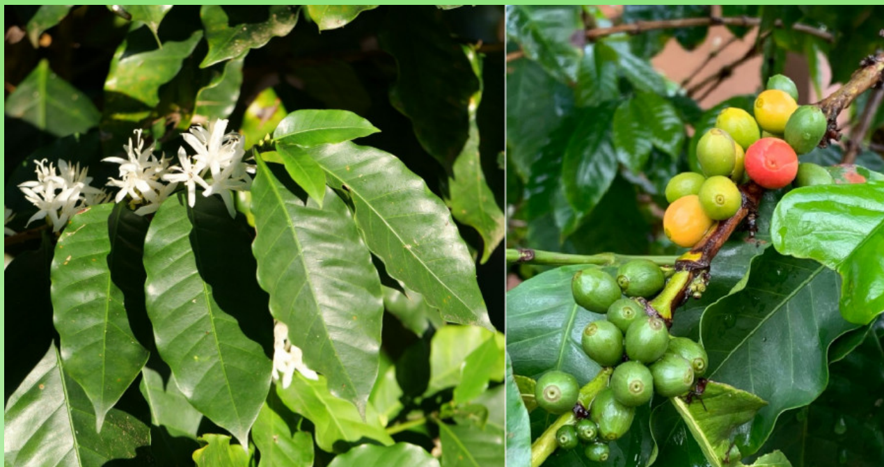
Рис. 3. Цветущая и плодоносящая ветви Coffea arabica L.