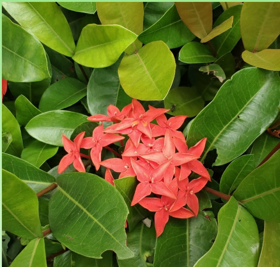
Рис. 9. Цветущая Ixora coccinea на набережной Фуджейра-Сити.

употребляется в пищу (FPI, 2021; MPNS, 2021; POWO, 2025). Очень декоративный кустарник, обычно с красными цветами, но известно много разновидностей и сортов с желтыми, оранжевыми или розовыми цветами, за что и ценится (Corner, 1988; Sastri, 1959; Wong, 1989), тогда как дикорастущая форма обычно не выращивается. Он широко культивируется, при этом в теплом климате используется для живых изгородей и экранов, посадок у фундамента, группами в цветущих клумбах, или выращивается как солитерный кустарник или небольшое дерево. В более прохладном климате его выращивают в оранжереях или как горшечное комнатное растение, требующее яркого света. I. coccinea также выращивают в контейнерах и вазонах, и она очень эффектно смотрится в посадках во внутреннем дворике или у бассейна. Этот плотный, компактный кустарник сильно ветвится и хорошо переносит обрезку, что делает его идеальным для формирования живых изгородей (Walker & Sillans, 1961), хотя лучше всего он проявляет себя, когда его не стригут ( https://floridata.com/plant/1031 ).