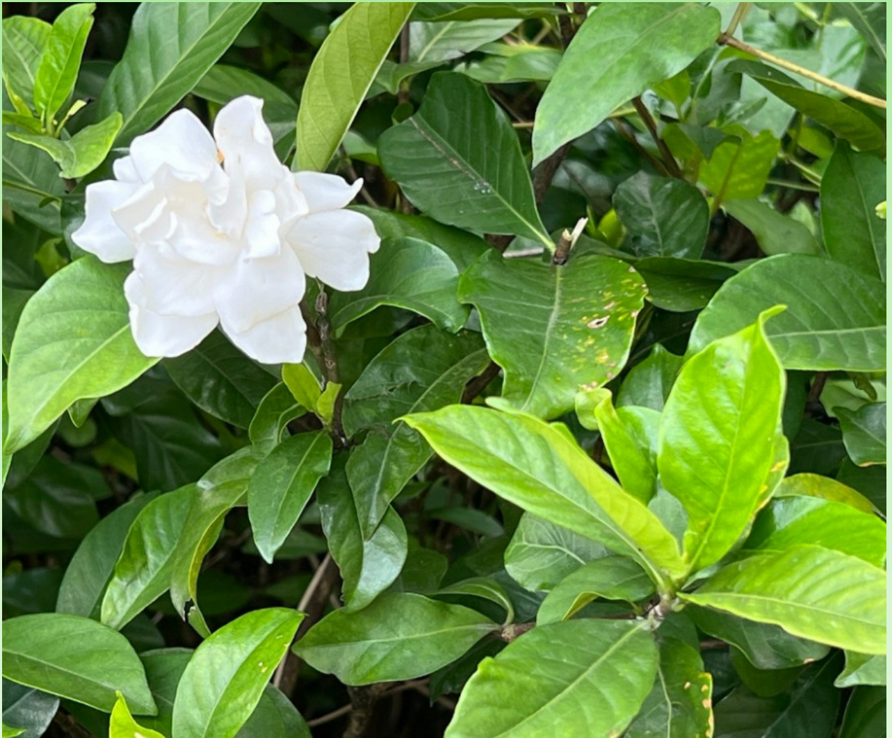
Рис. 6. Цветущая Gardenia jasminoides var. fortuneana в частном саду.

Культивируется в Саудовской Аравии (Manual, 2014) и ОАЭ (Бялт, Коршунов, 2020) и, возможно, в других странах Аравии.