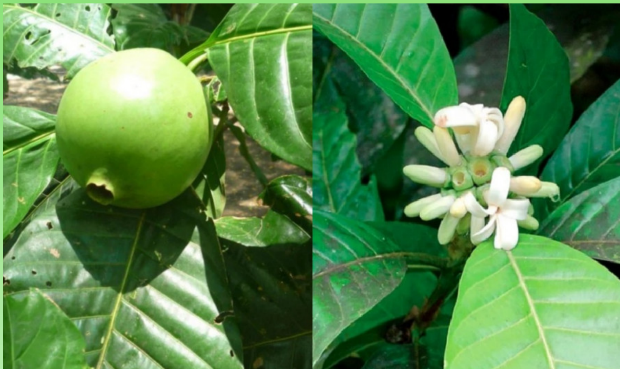
Рис. 2. Плод и цветки Alibertia patinoi .