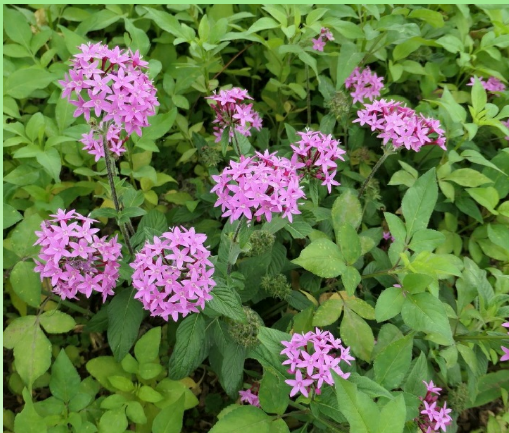
Рис. 12. Цветущий Pentas lanceolata на цветнике в частном саду.

Использование. В основном выращивают как красивое декоративное растение. Они различаются по окраске цветков, и постоянно продолжают выводиться новые сорта с яркой окраской цветов. Пентасы очень популярны на клумбах, в составных цветниках и смешанных бордюрах в садах на юге США, особенно в Луизиане, Айове, Флориде и Техасе, идеально подходят для выращивания в качестве одно- или двухлетников в горшках и вазонах на балконах и террасах ( https://floridata.com./plant/79 ; Jardin! L'Encyclopedie, 2000–2025). Великолепно смотрится в клумбах с буддлеями, иксорами и лантанами. Также это прекрасный однолетник, если его посадить в клумбы однородного цвета. Пентас хорошо смотрится в ландшафтных цветниках и идеально подходит для выращивания в контейнерах в течение всего лета и хорошо сочетается с любым количеством теплолюбивых однолетников ( https://floridata.com./plant/79 ).