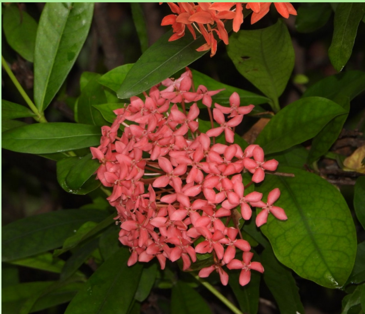
Рис. 8. Цветущая Ixora chinensis около отеля.

Общее распространение: Родной ареал этого вида простирается от Юго-Восточного Китая (пров. Фуцзянь, Гуандун, Гуанси) до Индокитая и Филиппин – в Индонезии, Малайзии, на Филиппинах, во Вьетнаме (Govaerts, 2003; Pasha, Uddin, 2013; Reynolds, Forster, 2006); широко культивируется в тропических регионах по всему миру, иногда дичает (Govaerts, 2003; Mendoza et al., 2004; Delprete et al., 2005; Delprete, Cortés-B., 2006 (publ. 2007); Ixora chinensis , 2023; POWO, 2025). Широко культивируется в Индии в штате Уттар Прадеш (Husain, Paul, 1989; Gopalakrishna Bhat, 2014; Sankara Rao, Deepak Kumar, 2024c), Пакистане и Австралии (Reynolds, Forster, 2006; Randall, 2007).