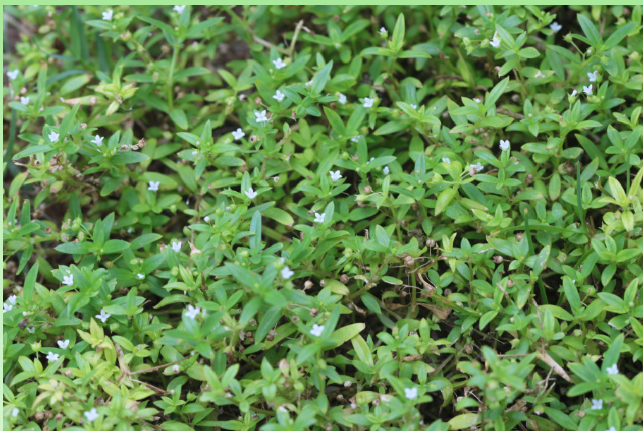
Рис. 10. Oldenlandia corymbosa на газоне около гостиницы.

Слабые однолетние травы до 30 см выс.; побеги ди- и трихотомически ветвистые, голые. Листья 7–30 мм дл., 0,5–7 мм шир., узкоэллиптические, зелёные, при высыхании бумажистые, голые с обеих сторон, при основании клиновидные и почти сидячие, на верхушке острые; вторичные жилки незаметные; прилистники 0,5–3 мм дл., широкотреугольные, от тупых до округлых, сохраняющиеся, эрозивные или щетинистые, с несколькими щетинками до 2 мм дл. Соцветия пазушные, в завитках с 2–4 цветками, иногда с одиночными цветками; цветоносы почти сидячие или 2–8 мм дл. Цветки на цветоножках 2–8 мм дл.; гипантии около 0,5 мм дл., от шаровидных до носовидных, голые; доли чашечки глубоко лопастные, голые, лопасти 4, 0,5–1,5 мм, часто почти все неодинаковые в одном цветке, узкотреугольные до узко ракурсчатых, острые. Венчик 1–2 мм дл., колёсовидный, от белого до сиреневого цвета, голый на обеих поверхностях, лопасти 4, треугольные. Плоды – коробочки 1,5–2 мм дл., от эллипсовидных до почти шаровидных, иногда слегка двойчатые, голые, бумажистые. Семена около 0,2 мм дл., продолговатые до угловатых, мелкосетчатые. Цветение и плодоношение: с апреля по сентябрь. Размножение семенами, ауто- и антропохор. Рис. 10, 15.