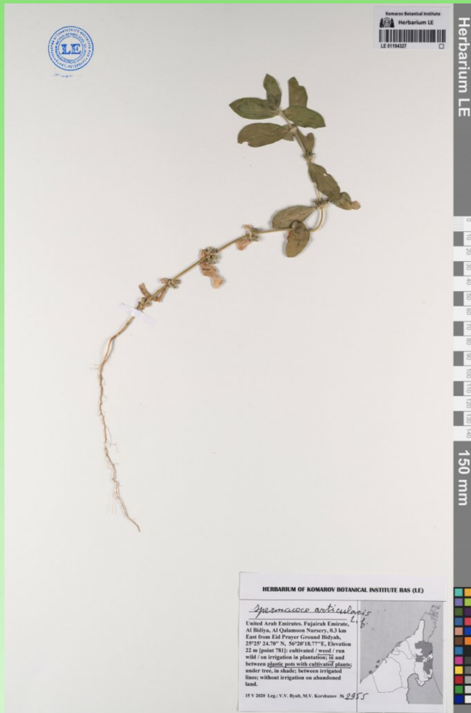
Рис. 14. Гербарный образец Spermacoce articularis , хранящийся в Гербарии LE.