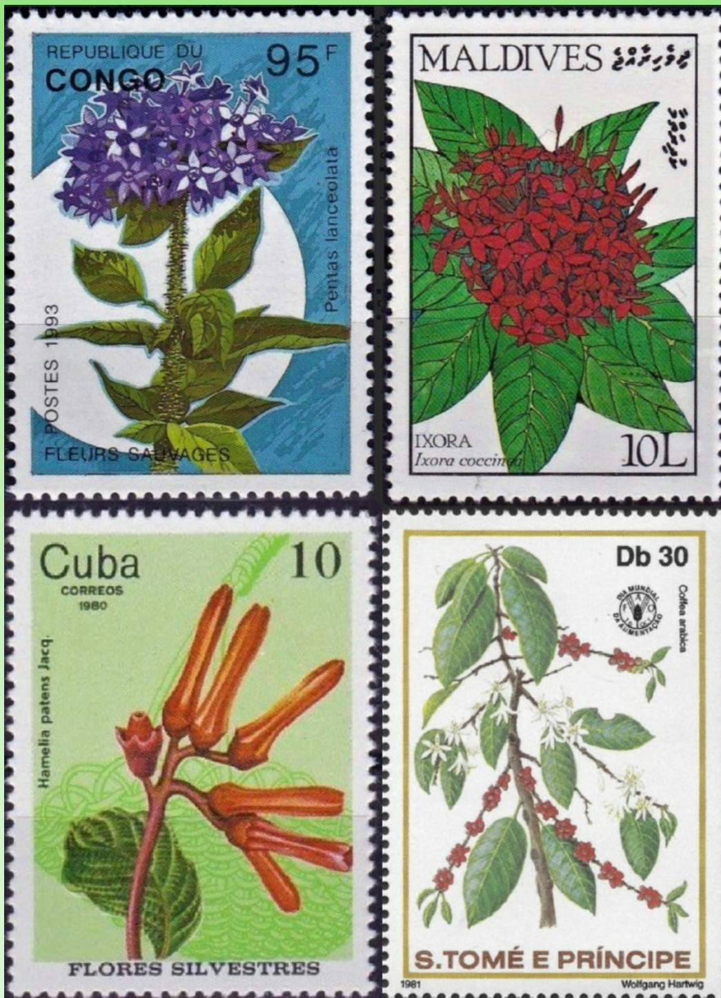
Рис. 4. Виды семейства Rubiaceae на почтовых марках – Pentas lanceolata , Ixora coccinea , Hamelia patens и Coffea arabica (изображения марок взяты с сайта https://colnect.com/en/search/list/collectibles/stamps/q/ ).

Изображение Coffea arabica иногда помещают на почтовых марках (рис. 4).