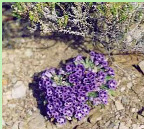
Фиалка Карру - Aptosimum procumbens

Слова «Кейптаун», «Мыс Доброй Надежды» и «Южная Африка» достаточно романтичны, а для ботаников они ассоциируются с понятием «Капское флористическое царство», что многократно увеличивает притягательность этого крошечного уголка Земли.