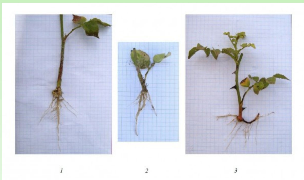
Рис. 2. Корнеобразование у черенков роз группы патио разных сортов (посадка — 01.06.2009 г.,