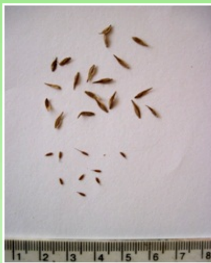
Рис. 1. Мешочки (вверху) и плоды (внизу) Carex muskingumensis Schwein.

Примечание: M±m – среднее значение показателя плюс ошибка среднего, CV% – коэффициент вариации