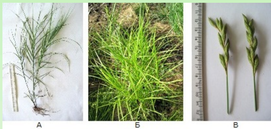
Рис. 3. Молодая (А) и зрелая (Б) генеративные особи Carex muskingumensis Schwein. во второй год развития; В – соцветия.