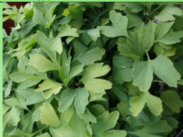
Рис. 3. Ginkgo biloba L. в посевном отделении питомника. Фото Е. Платоновой, 2009

Fig. 2. Weigela florida (Bunge) A. DC. Photo by E. Platonova, 2012