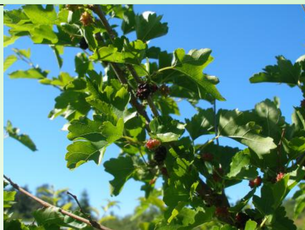
Рис. 6. Morus nigra L. Плодоношение.