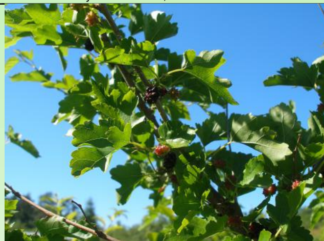
Рис. 6. Morus nigra L. Плодоношение.