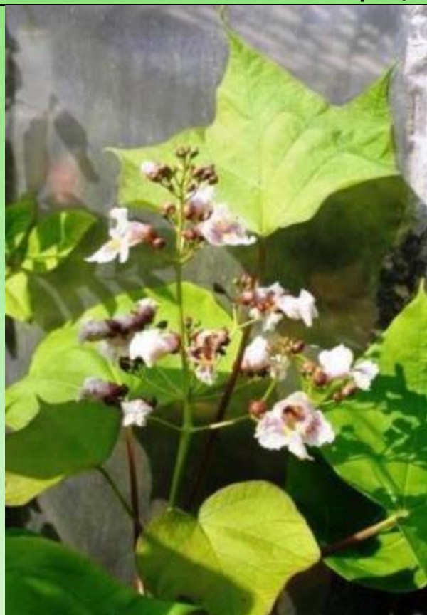
Рис. 4. Catalpa bignonioides Walter.