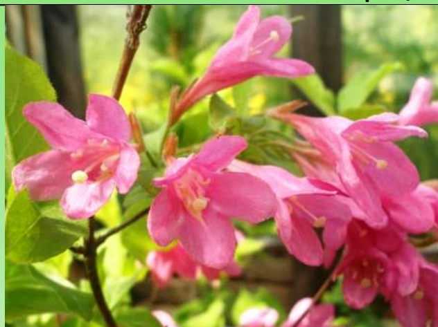
Рис. 2. Weigela florida (Bunge) A. DC. Фото Е. Платоновой, 2012

Fig. 2. Weigela florida (Bunge) A. DC. Photo by E. Platonova, 2012