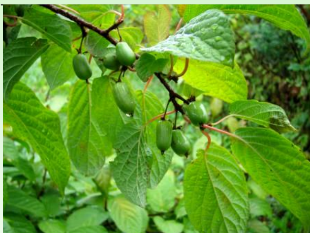
Рис. 5. Actinidia kolomikta (Rupr. & Maxim.) Maxim. Фото А. Фалина, 2006