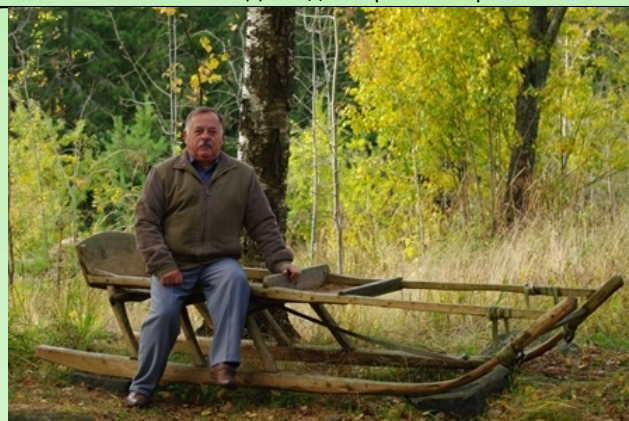
И.о. деда Мороза в летний период