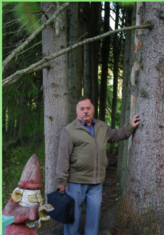
На "Даче доктора Винтера"