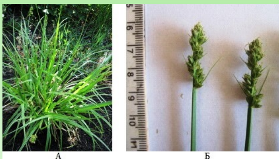
Рис. 3 – Carex vulpina L. во второй год развития: А – молодая генеративная особь, Б – соцветия

Весной следующего года в молодое генеративное возрастное состояние переходят все растения, зацветая в третьей декаде мая. К этому времени кроме 8–12 вегетативных побегов развиваются 4–9 генеративных высотой 11–15 см (рис. 3). Высота надземной части растений в это время 20–25 см, диаметр 30–35 см, придаточные корни проникают на глубину до 13 см, диаметр корневой системы 13–14 см. Длина листьев 18–27 см, ширина 0.70–0.75 см. В период цветения цветоносы удлиняются до 26–36 см, количество вегетативных и генеративных побегов возрастает, и к началу августа габитус растений увеличивается до 40 см высоты и 50 см в диаметре (надземная часть) и 13 см глубины, 19 см в диаметре (подземная часть). Семенная продуктивность генеративного побега составила 141.67 \pm 32.53 , семенная продуктивность всей особи определяется количеством цветоносов и потому сильно варьирует. Полевая всхожесть вызревших семян 78%, что в сочетании с высокой семенной продуктивностью вполне достаточно для успешного массового размножения интродуцентов семенным путем.