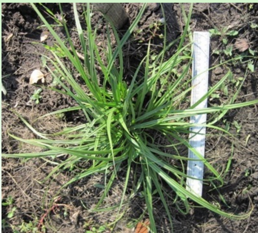
Рис. 2 – Виргинильная особь Carex vulpina L.

Через 25–28 дней в базальной части стебля закладываются почки возобновления и начинается интенсивный процесс кущения – растения переходят в виргинильное возрастное состояние (рис. 2). В конце августа надземная часть виргинильной особи представлена 4–6 розеточными побегами из 5–11 листьев длиной 20–25 см, шириной 0.6–0.7 см, подземная – множеством придаточных корней длиной до 8–9 см, густо ветвящихся до 2-го и 3-го порядков, и 2–4 молодых апогеотропных побегов с еще не развитыми листьями.