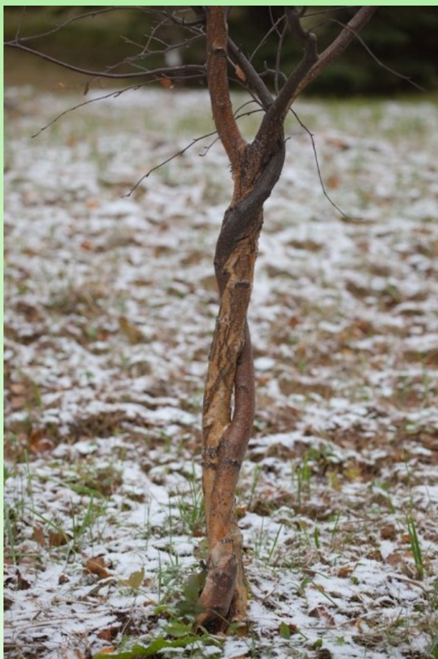
Рис. 4. Прививка сближения на свадебном дереве. Береза повислая.

Дуб всегда почитался на Руси, и в народной медицине к нему прибегали при зубной боли, грыже, грудной жабе и других заболеваниях. В конце XVIII в. в Пронском уезде Рязанской губернии пользовался большим уважением толстый старый дуб со сквозным отверстием, через которое протаскивали по три раза детей, больных грыжей, после чего дерево перевязывали поясом или кушаком (Энергетика дуба...). Уж таким это дерево было или нет, остается загадкой, но дуб до сих пор изображается на гербе Пронского района. Приглядываясь к остальным деревьям арборетума, оказалось, что это не единственный пример, в азиатском секторе среди дальневосточных берез тоже есть дерево с самопрививкой. Здесь ветвь с одного ствола вросла в растущий рядом в виде буквы "Н", практически у самого комля (рис. 5).