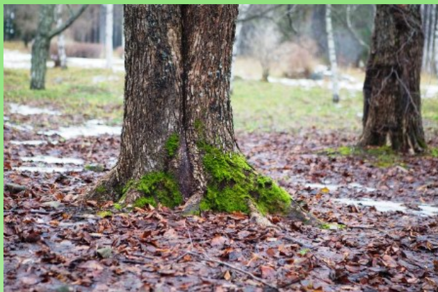
Рис. 16. Досковидные корни вяза гладкого.

деревья укрывают других в тени, а сами остаются на солнце". Удивительна растительность под пологом крон деревьев, так под пихтой бальзамической она отсутствует практически полностью, а в иных группах полна разнообразия.