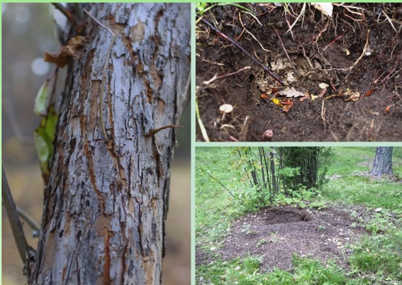
Рис. 6. Следы от когтей медведя на яблоне, разрушенное осинное гнездо и муравейник.

При высокой технике прививки с годами граница между подвоем и привоем стирается. Яблоня культивируется в Карелии со времен появления первых монастырей (Садоводство и огородничество..., 1870; Железнов, 1873) и к началу XXI века стала одной из популярных садовых культур. На территории Ботанического сада они посажены в разных отделах арборетума. К сожалению, информация о многих из них отсутствует, ежегодно сокращается количество экземпляров, что связано, в первую очередь, с осенними приходами в сад медведей, которые питаются яблоками и заламывают стволы. На стволах можно увидеть следы от медвежьих когтей (рис. 6).