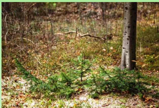
Рис. 13. Укоренение нижних ветвей пихты.