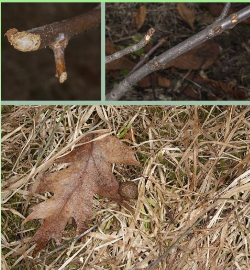
Рис. 19. Заячьи погрызы на дубе красном и конском каштане обыкновенном.

Медведей на территорию арборетума привлекают не только растительные ресурсы, но и муравейники, и подземные осиные гнезда (рис. 6), так в 2013 году было отмечено 13 разрушенных осиных гнезд. Говорят: "если осы в земле гнезда строят, то будет теплое лето". Лето действительно было теплым, а в следующем году был отмечен максимум по урожайности семян видов древесных растений и их внутривидового разнообразия, что является следствием благоприятного роста и развития растений в предыдущем году. Помимо медведей на территории Сада обитают и другие животные, следы жизнедеятельности которых можно повстречать. Зайцы, например, предпочитают аборигенным видам растений экзотические, такие как конский каштан обыкновенный, дуб красный и др. (рис. 19).