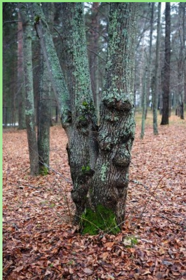
Рис. 15. Капы на липе мелколистной .

Pic. 14. Scots pine infected by lumpy cancer.