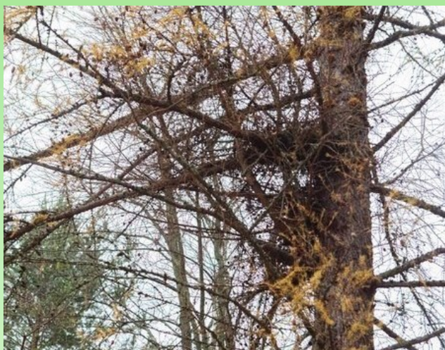
Рис. 12. Вихоревое гнездо на лиственнице.