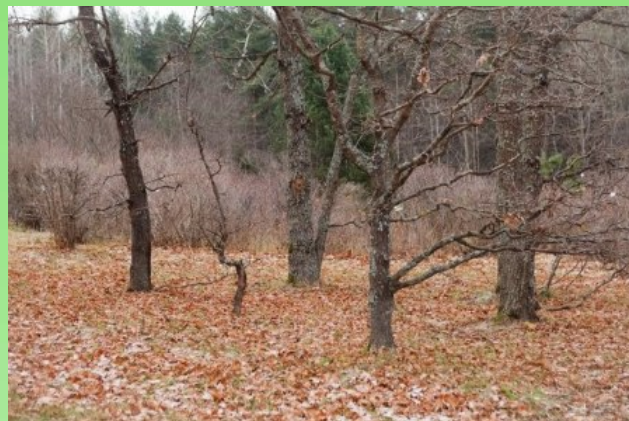
Рис. 17. Групповой метод посадки.