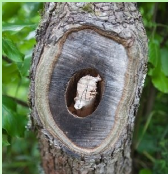
Рис. 18. Спил на груше.