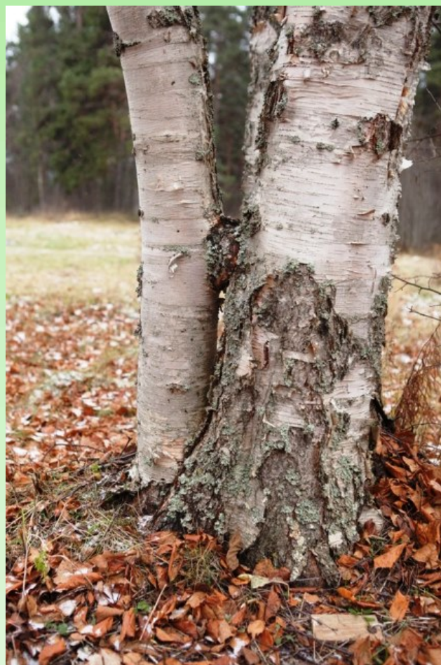
Рис. 5. Самопрививка на дальневосточной березе.

Pic. 4. Self-grafting on the wedding trees. Silver birch.