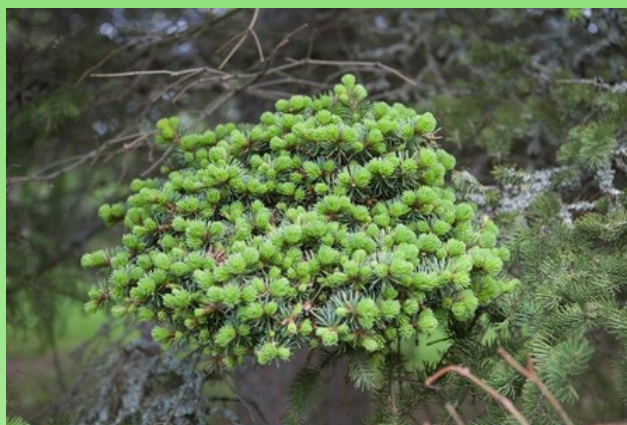
Рис. 9. Ведьмина метла на ели Энгельмана.