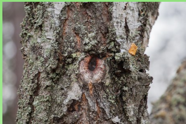
Рис. 2. Карельская береза - "золушка карельского леса".