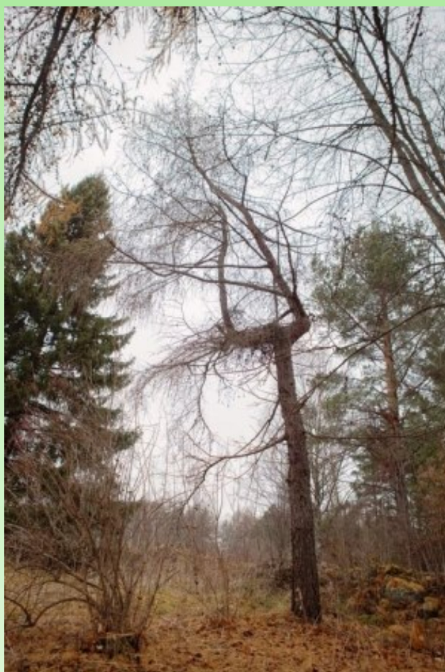
Рис. 11. Перевершинивание на лиственнице.