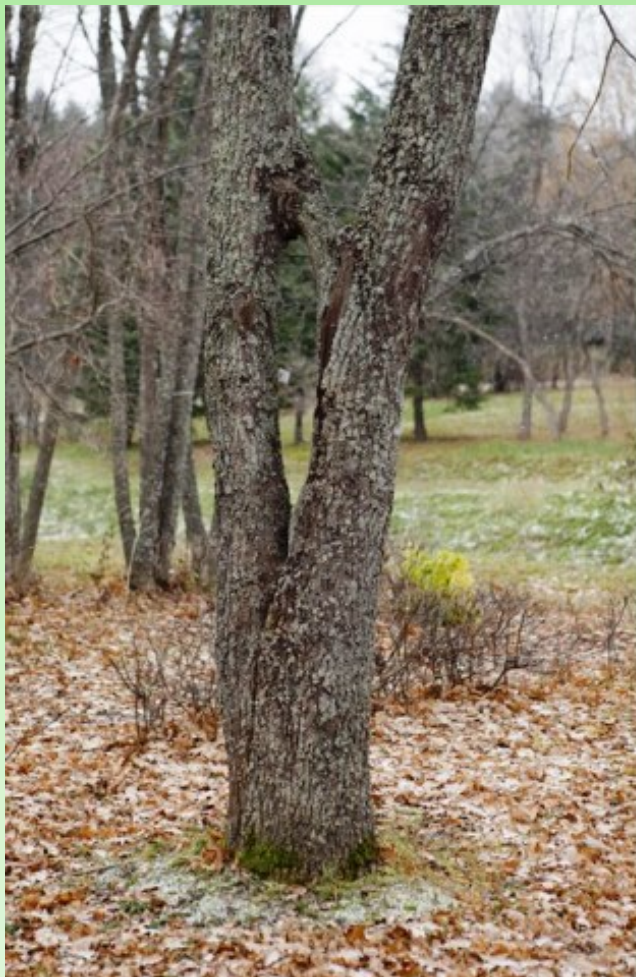
Pic. 2. Karelian birch - "Cinderella of the Karelian forest".