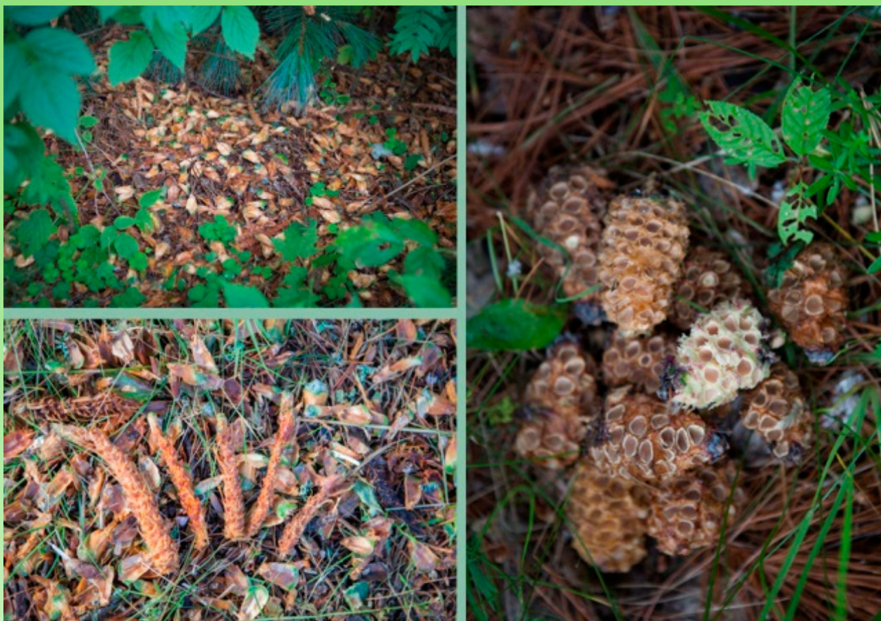
Рис. 20. Шишки сосен, погрызенные обыкновенной белкой.