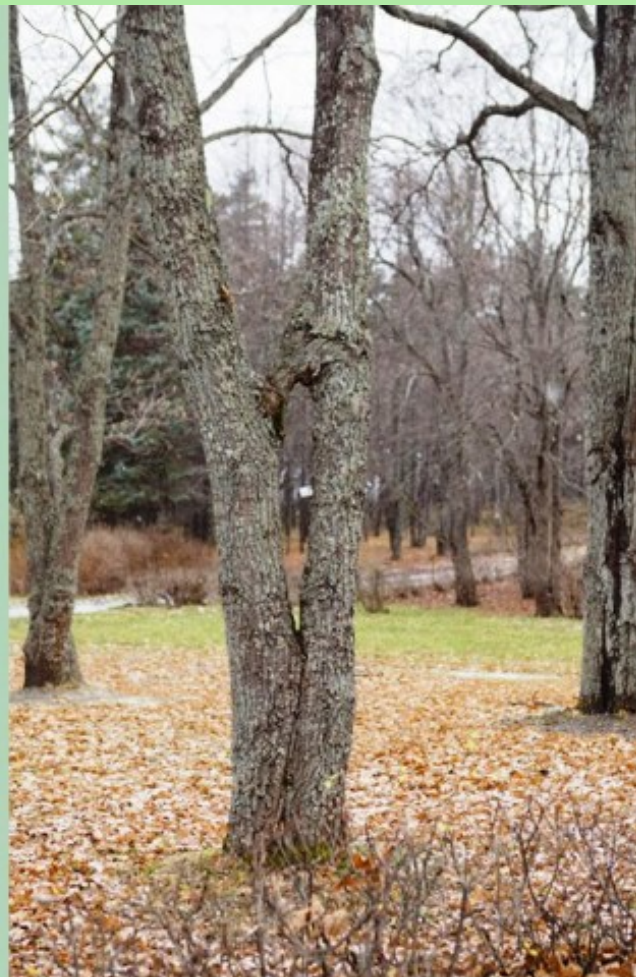
Рис. 3. Самопрививка на дубе черешчатом.