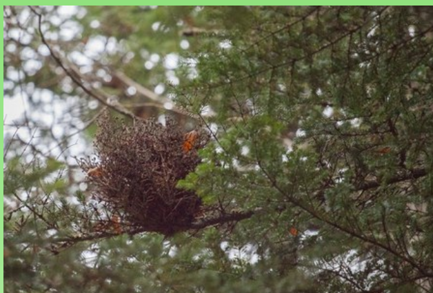
Рис. 8. Высохшая ведьмина метла на пихте бальзамической.