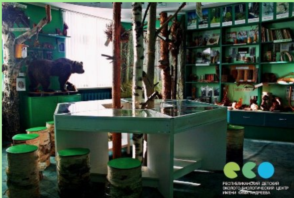
Рис. 1. Музей природы "Берендеево царство" в РДЭБЦ им. Кима Андреева.

"Войди! И встретишься – со сказкой, Узнаешь целый мир чудес. Их шлет тебе с веселой лаской Зеленый друг – КАРЕЛЬСКИЙ ЛЕС!"