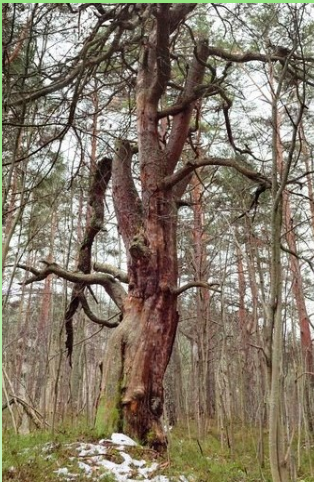
Рис. 14. Сосна обыкновенная, пораженная бугорчатым раком сосны.

возникающие в местах разрастания побегов из спящих почек - капы. В саду множественные капы отмечаются на липе мелколистной (рис. 15). Капы бывают стволовыми и корневыми и тогда называются капо-корни. Капы и сувели ценятся в изготовлении художественных и декоративных изделий. Значение их в жизни дерева спорно и причины их формирования могут быть различными.