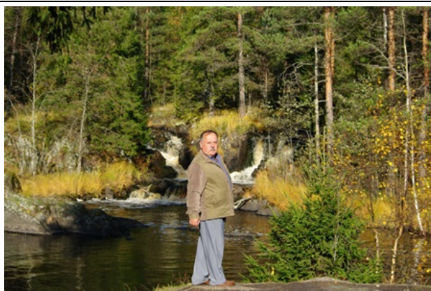
Там, где зори тихие