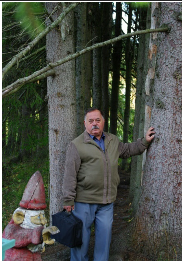
На "Даче доктора Винтера"