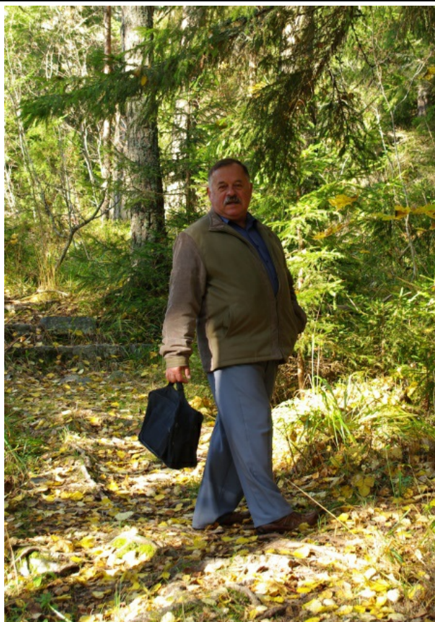
Хозяин карельской тайги