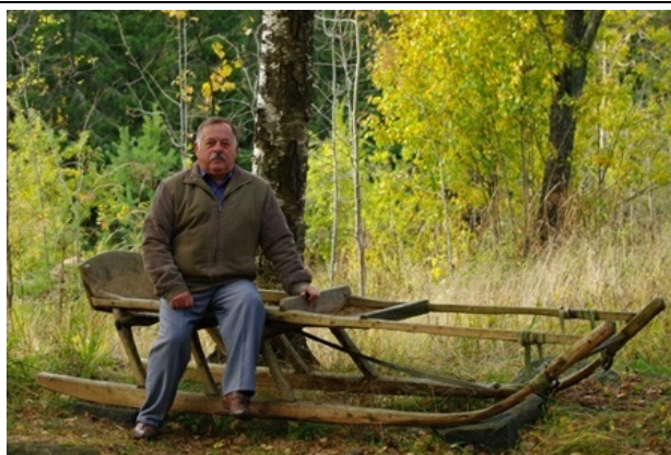
И.о. деда Мороза в летний период