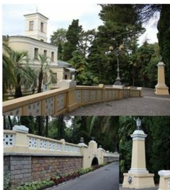
Рис. 9. Архитектурный ансамбль "Севастополь". Сверху – общий вид, внизу – "Крепостная стена" (слева) и фонарь в виде маяка (справа) (фото Г. А. Солтани).

Fig. 9. The architectural ensemble of the "Sevastopol"(photo G. A. Soltani). Above – General view, the bottom - "The fortress wall" (left) and the lantern in the lighthouse (right).