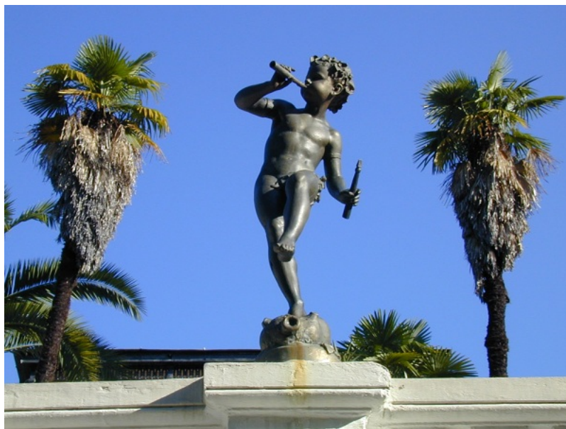
Рис.15. Скульптура Диониса