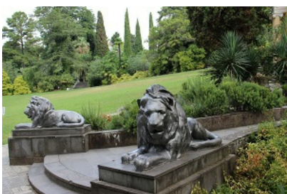
Рис. 3. Львы у подножия беседки в сочинском "Дендрарии".