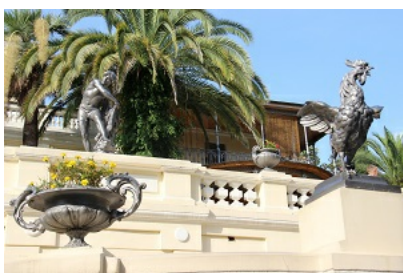
Рис. 5. Архитектурный ансамбль "Утро".

Следующей связующей нитью архитектуры парка является тема Утра. Видимо, это было любимое время суток Сергея Николаевича Худекова. Переход от тьмы к свету, предвкушение нового дня и связанные с этим чувства и эмоции создавали определённое настроение. На террасах перед дачей расположен архитектурный ансамбль Утро (рис. 5). Сейчас его составляют три скульптуры: возвещающий о наступлении нового дня Петух, играющий на дудочке Пастушок (он же "Мальчик со свирелью") и "Рыбак с сетью" (Михалёва, 1971). Легенды парка гласят, что большая фигура Рыбака и маленькая Пастушка напоминают нам о соразмерности труда и праздности в нашей жизни.