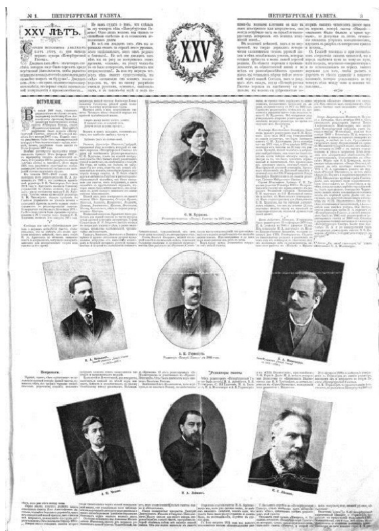
Рис.14. Юбилейный выпуск «Петербургской газеты» 1 января 1892 года с тиражом 24 тыс. экземпляров (фото с сайта http://www.history-ryazan.ru/gallery2/v/genealogy_doc/peterburgskaya_gazeta/Peterburgskaya_Gazeta_1892_01_01_N001_s03.jpg.html ).

В 1887 открылась собственная типография. Это позволяло печатать не только большие тиражи газеты, но и отдельные книги. С 1891 по 1904 год из типографии Худекова вышли издания 195 наименований по медицине (в основном по акушерству и гинекологии), материалы по военному делу, этнографии и филологии. Безусловным лидером среди авторов, чьи произведения печатались в типографии Худекова, был Н.А. Лейкин. Его книги выходили до 1898 года 36 раз (Красногорская, 2015). Успешную издательскую и редакционную деятельность Худеков совмещал с активной работой в области литературы и искусства. Он автор романов "Балетный мирок", и "На скамье подсудимых", создатель и соавтор 150 пьес. Самые известные из них - "Петербургские когти" (водевиль в 4-х действиях, совместно с Г.Н. Жулёвым), "Герои темного мира" (пьеса в 4-х действиях с куплетами, совместно с Г.Н. Жулёвым), "Передовые деятели" (пьеса в 5-ти действиях), "Житейские предрассудки" (комедия в 4-х действиях, совместно с А.Н. Похвисневым), "В чем сила?", "Кассир" ("Сын века"), "От безделья" - ставится в Императорских театрах Петербурга, Москвы, в провинциальных городах России. Главным печатным трудом Сергея Николаевича Худекова было и остаётся 4-томное издание «История танцев». Книга иллюстрирована большим количеством фотографий и рисунков из знаменитой балетной коллекции автора.