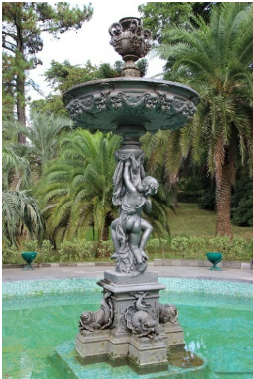
Рис. 12. Фонтан "Амуры".

Сергей Николаевич считал, что главное в жизни человека - семья. Семье посвящён главный фонтан парка – "Амуры" (рис. 12). Он расположен на центральной лестнице, ведущей к даче. Его строение - формула счастливой семьи, так гласят легенды парка. В основах семьи лежит мудрость, которую символизируют дельфины. Над ними стоят два ангела – Терпение и Любовь, поддерживающие полную чашу – символ благополучия и достатка. Венчают фонтан Сатиры – символ плодородия и радости.