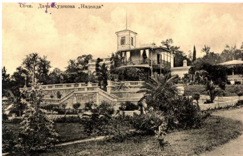
Рис. 10. Дача "Надежда".