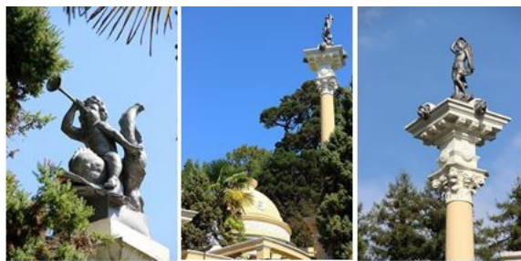
Рис. 2. Скульптуры Эроса на дельфине (слева) и Афродиты (справа). По центру – скульптурная группа Греческой беседки в сочинском "Дендрарии".