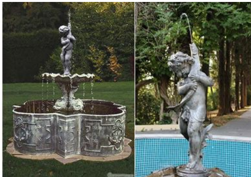
Рис. 7. Скульптуры Мальчик с щукой (слева) и Мальчик с рыбкой (справа).

Сергей Николаевич Худеков выбрал из каталога фигуры, которые подходили для выражения его замысла. Так как скульптуры в парке неоднократно переставлялись, то, возможно, скульптуры Ныряльщица и Мальчик с рыбкой входили в этот ансамбль. Скульптура Мальчик с рыбкой фирмы А. Дюрэна является замечательным подобием работы Мальчик с щукой известного итальянского скульптора XV века Андреа Вероккьо (A. Verrochio) (рис. 7).