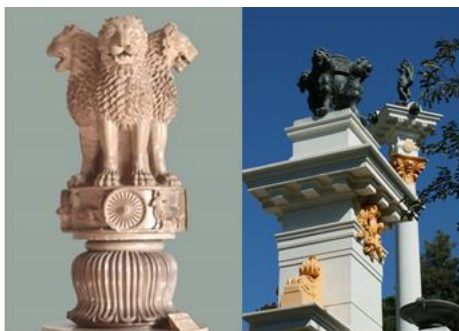
Рис. 19. Львиная капитель индийской колонны Ашоки в Сарнатхе (слева) и на Греческой беседке в «Дендрарии» (справа).