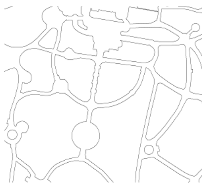
Рис. 16. Планировка верхней части Худековского парка.