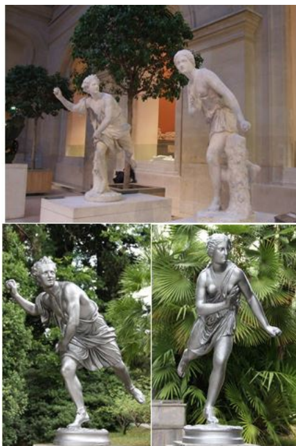
Рис. 4. Гиппомен и Аталанта. Сверху - Лувр, снизу слева Гиппомен, снизу справа Аталанта в "Дендрарии".