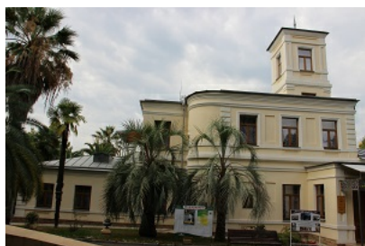
Рис. 8. Северный фасад дачи в форме корабля.

Fig. 7. Sculpture Boy with a pike (left) and Boy with fish (right).