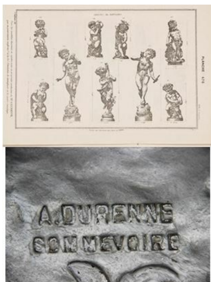
Рис. 6. Лист из каталога фирмы А. Дюрэна - сверху. Фирменный знак на парковой скульптуре - внизу.