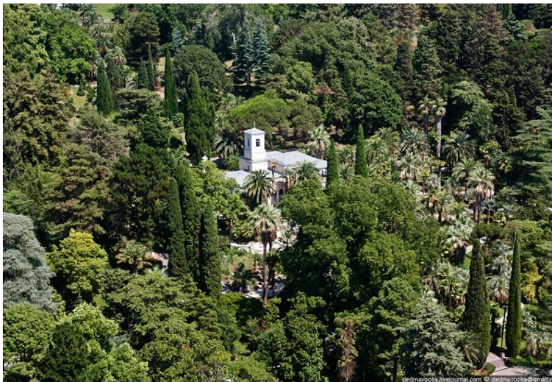
Рис. 20. Сочинский «Дендрарий» в XXI веке