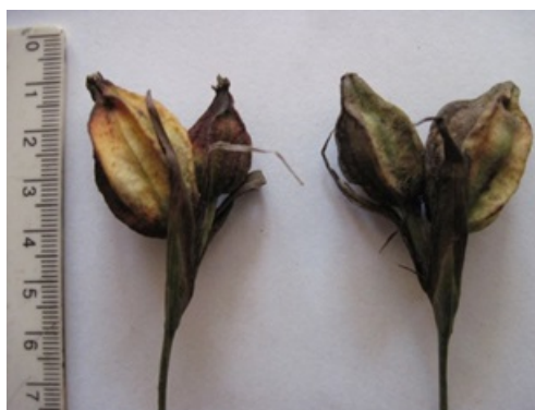
Рис. 2. Плоды Iris graminea L.

Окончание активного роста вегетативных побегов у I. graminea совпадает с окончанием фенофазы цветения. Последующее постепенное прекращение нарастания, по-видимому, связано с процессом созревания семян и не зависит от степени увлажнения, как можно было бы предположить (рост побегов ежегодно прекращается после 4 июля, независимо от наличия или отсутствия в этот период дождливых дней). Период роста вегетативных побегов I. graminea составляет 31,4-47,1 % от продолжительности всего вегетационного периода, период активного роста (в течение которого средняя скорость нарастания побегов увеличивается в 1,3-1,9 раз) – 11,7-15,4 %. Прекращение вегетации, так же как и ее начало, определяется термическим фактором, в данном случае наступлением осенних заморозков с последующим длительным понижением минимальной температуры воздуха до +(1-3)^{\circ}\text{C} . Поскольку эта дата также сильно варьирует по годам, амплитуда данной фенофазы по сравнению с фенофазами бутонизации и цветения значительно возрастает. В целом период вегетации в разные годы длится от 197 до 223 дней.