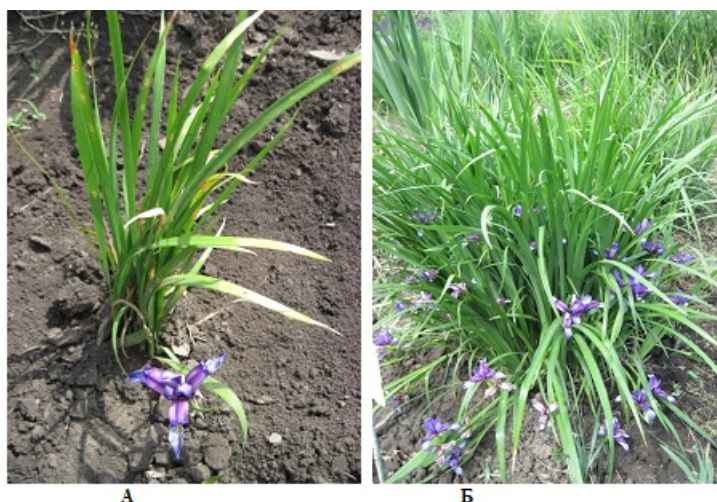
Рис. 6. Ранняя (А) и зрелая (Б) генеративные особи Iris graminea L.