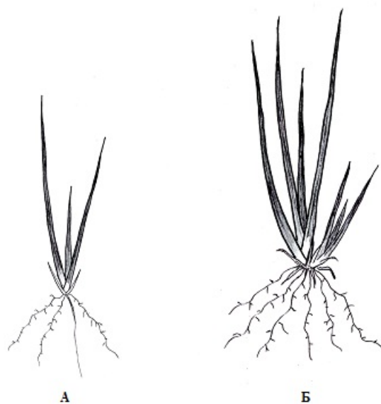
Рис. 5. Имматурная (А) и виргинильная (Б) особи Iris graminea L.