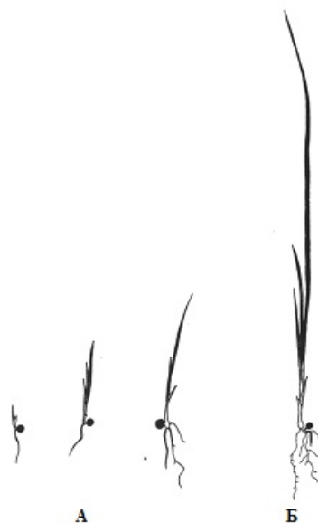
Рис. 4. Проростки (А) и ювенильная особь (Б) Iris graminea L.