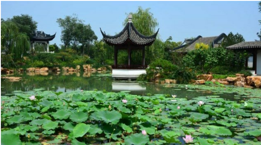
Рис. 17. «Беседка на лодке» на берегу пруда с лотосами. Урез воды закрыт камнем. Слева - беседка на возвышенности - для обозрения площади парка и пруда. Справа - крытые галереи.