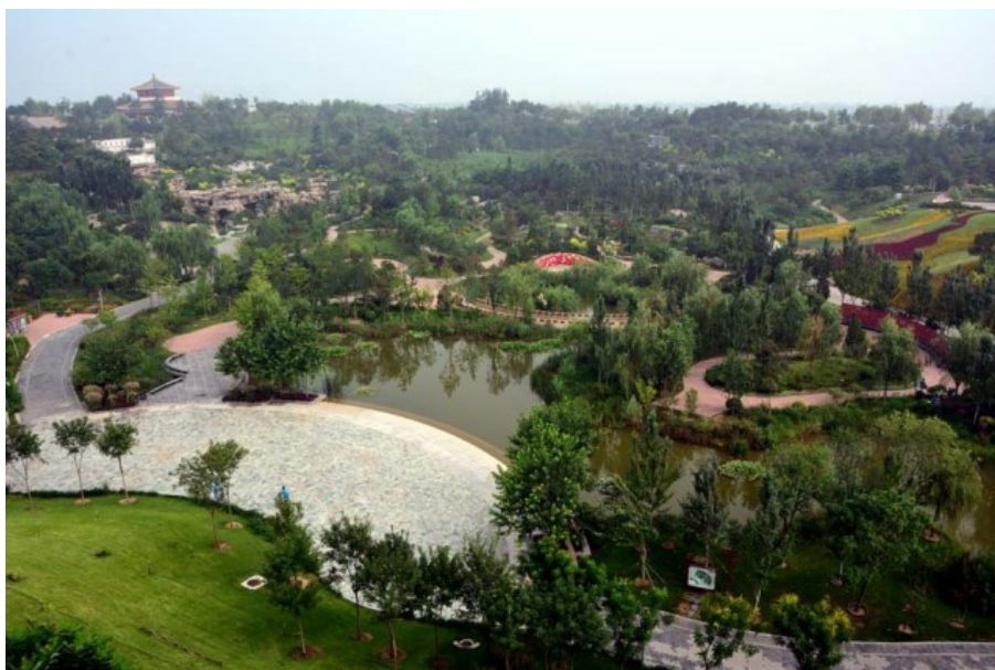
Рис. 3. «Парчовая долина».