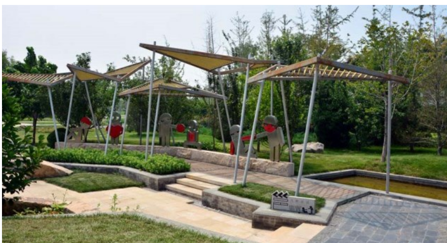
Рис. 24. Сад города Наньнин, провинция Гуйчжоу. Дизайнерские находки.

Fig. 23. Garden of Nanning City, Guizhou Province. Water (including - "incident" waters), broken lines, walls with shaped windows.