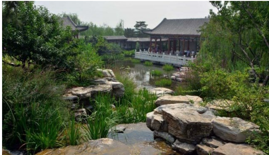
Рис. 7. Классические элементы китайского сада: камень, вода, мостики, крыши, растения.