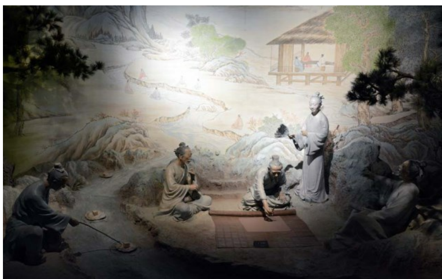
Рис. 27. Сценки из жизни и работы садовников, занятых разработкой проекта нового сада.