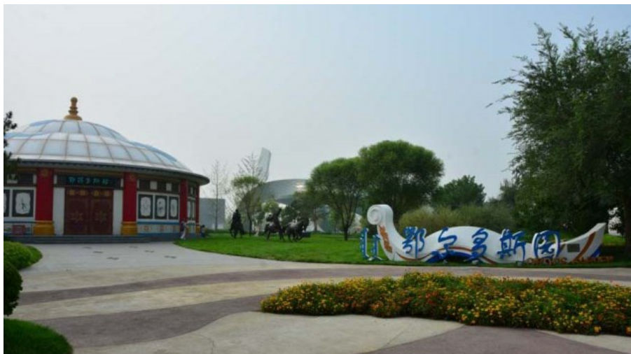
Рис. 4. Начало территории парка от города Эрдос, Внутренняя Монголия.

Beijing Garden Expo Park – это «коллекция» из уже реализованных 69 садов. Это яркая демонстрация опыта и умения дизайнеров, работающих в разных провинциях и в крупных городах страны. Разнообразие стилей, современно представленных классических и традиционных мотивов, которые можно видеть в саду, поражает. Многие из созданных садов решены в классическом стиле (рис. 4 – 18), но представлены и современные стили (рис. 19 - 24, 31), например сад в стиле Hi Tech в китайском прочтении от провинции Гуйчжоу.