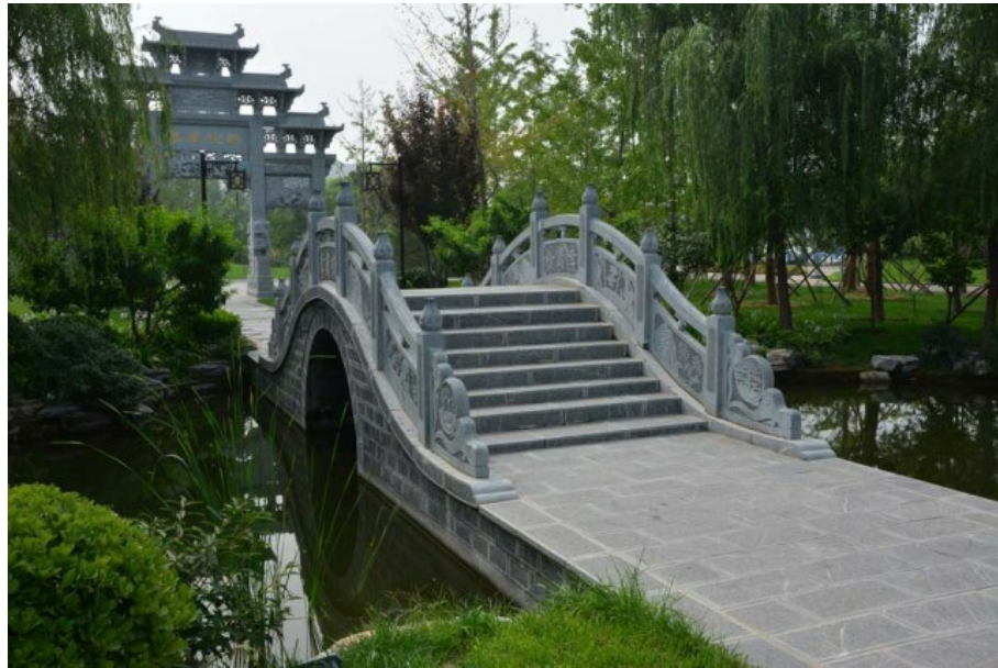
Рис. 5. Сады, сделанные в классическом стиле. Типичный верблюжий мостик.