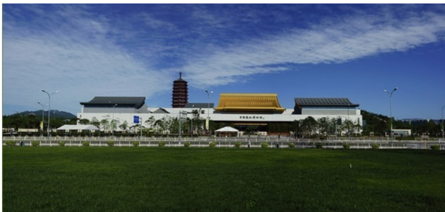
Рис. 25. Музей истории и развития ландшафтной архитектуры и садового дизайна Китая.