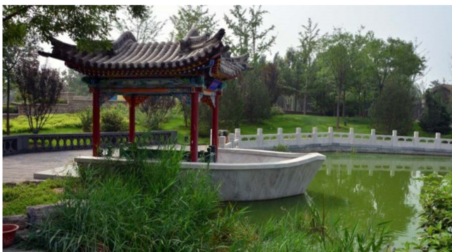
Рис. 13. «Плывущая беседка». Тростники, на заднем плане - Ginkgo boliba , Prunus purpureus .