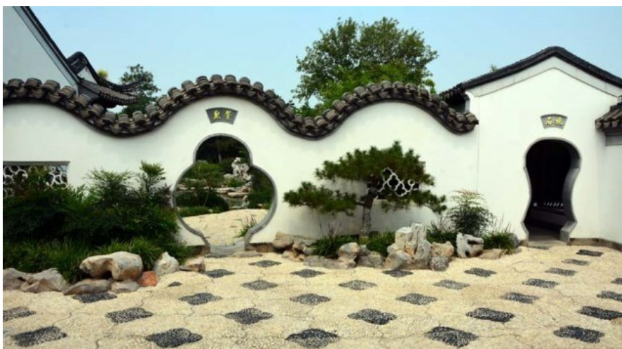
Рис. 9. Плитка уложена как "цветок сливы, разрушающий лёд". Фигурные (или лунные) проходы.