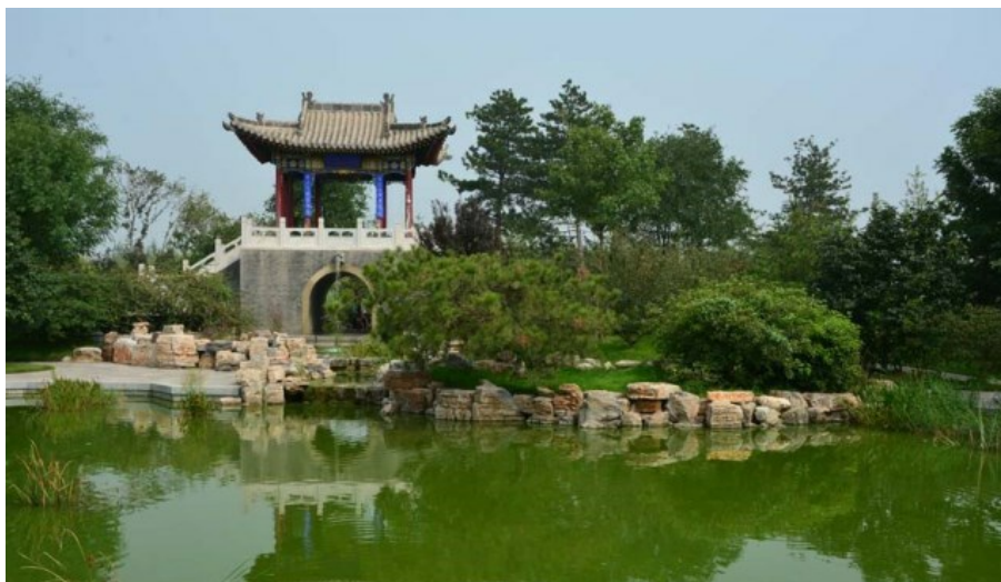
Рис. 12. Верблюжий мостик с беседкой. Каменное обрамление уреза воды, ступеньки и беседка, фигурный проход под беседкой (отражение в виде круга), разные виды растений.