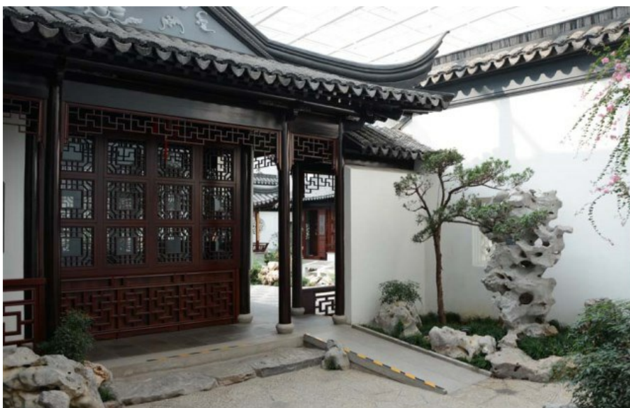
Рис. 29. В следующем дворике представлены: фигурное окно, фигурный природный камень, разные виды растений, ступеньки, крыши, стена.