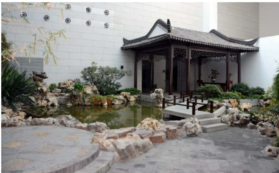
Рис. 28. Внутри здания сделано несколько типичных внутренних двориков. Присутствуют все главные элементы сада: природный камень, ломаный мостик, пруд, беседка (крытая галерея), бамбук, закрытые растениями углы, крытые плиткой дорожки.