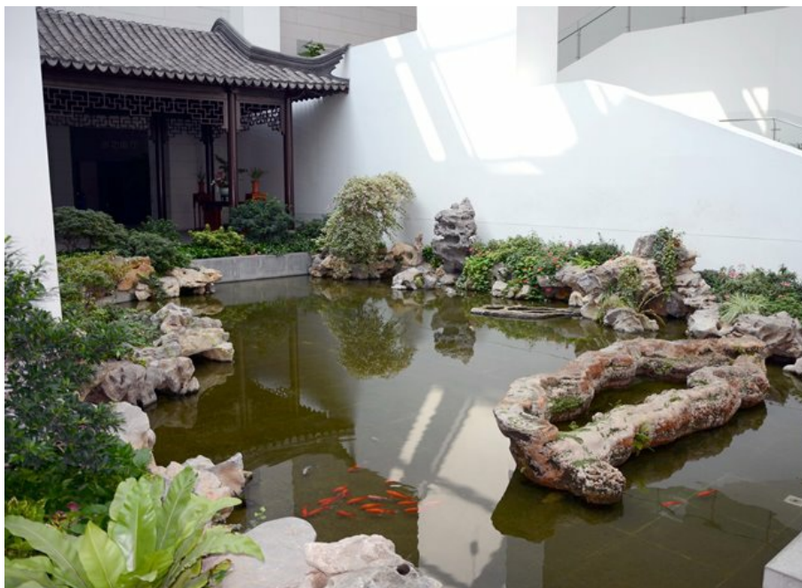
Рис. 30. Внутри здания представлены разные варианты классических "внутренних" садиков. И здесь так же есть все главные атрибуты китайского сада - камень, вода, растения, рыбы.

Fig. 30. Different options for classic "internal" little gardens are represented inside the building. They have all key elements of a Chinese garden as well - stone, water, plants, fishes.