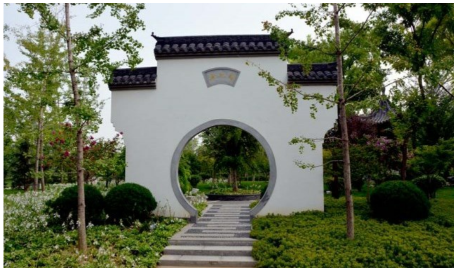
Рис. 8. Один из обязательных элементов китайского сада - лунные ворота.