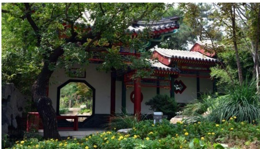
Рис. 16. Классический дворик китайской знати XVII-XIX веков. Фигурные окна в стене. Стена из разновеликих блоков. Крытая галерея. Видимый проём в стене – вставленное большое зеркало, значительно расширяющее пространства сада. Экспозиция молодых пекинских дизайнеров.