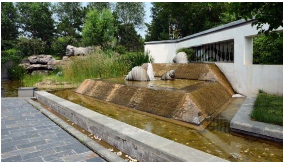
Рис. 23. Сад города Наньнин, провинция Гуйчжоу. Вода (в том числе - "падающая"), ломаные линии, стены с фигурными окнами.

Fig. 23. Garden of Nanning City, Guizhou Province. Water (including - "incident" waters), broken lines, walls with shaped windows.