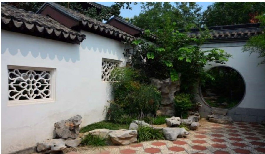
Рис. 10. Переход между внутренними двориками. Фигурные окна. Крыша разного уровня, плитка с камешками в виде рисунка, "лунный" проход. Обязательно - природный камень (как бордюры и как ступеньки). Закрытый растениями угол стен.

Fig. 9. Tile is laid as a "plum blossom, breaking the ice". Shaped (or moon) passages. Shaped windows. The roof of the wall is done in form of a writhing dragon.