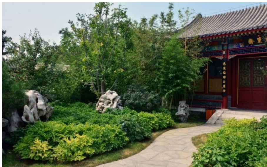
Рис. 6. Традиционный сад, включающий обязательные элементы - яблони, сливы, древовидные пионы, бамбук; кривые дорожки, беседку или какое-то строение.