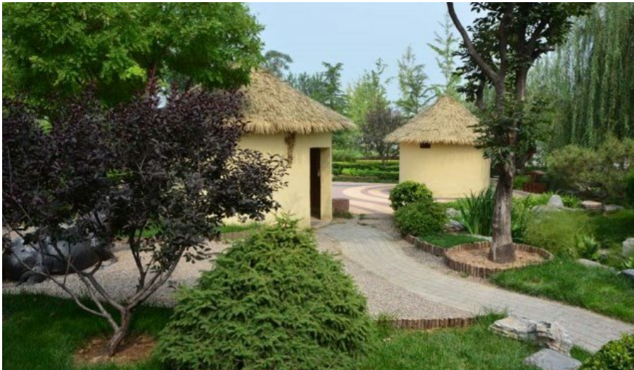
Рис. 19. Современная дизайнерская реконструкция южно-китайской деревни с элементами современного паркового дизайна. Слева видна фигура быка, на переднем плане слева - слива краснолистная, извилистые дорожки, выложенные разными плитками и камешками. Присутствует "дикий" (не обработанный) камень.

Fig. 19. Modern-day reconstruction of a South Chinese village with elements of modern parks' design. A bull figure can be seen on the left. Red-leaved prune, - drain krasnolistnyh, trimmed conifers, roads made of different tiles and stones. Crude (unprocessed) stone is used as well.