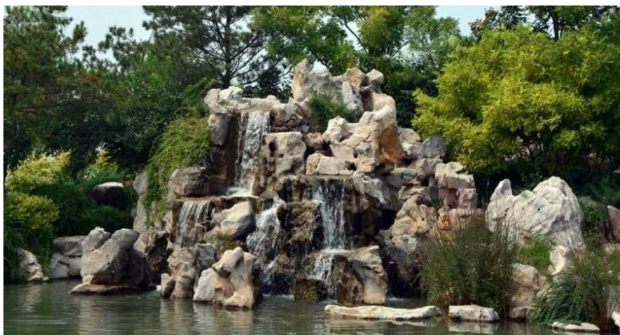
Рис. 14. Камень (сложенный вручную) и водопад так же ручной работы.