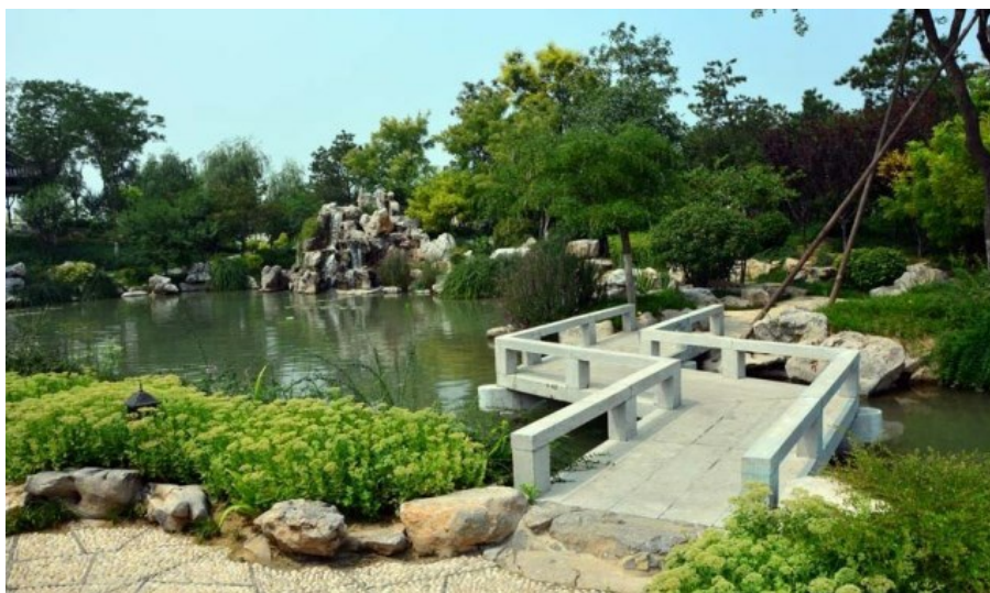
Рис. 11. Через мостик с прямыми углами за вами не может пройти нечистая сила, и, переходя на другую сторону, в саду или в парке вы уже свободны от преследования "нечистых сил".

Fig. 10. A Moon passage between the yards. Shaped windows. Levelled roof, tiles with stone patterns, a moon passage. Use of natural stone (for stairs and border" is obligatory. Plants covers the angle between the walls.