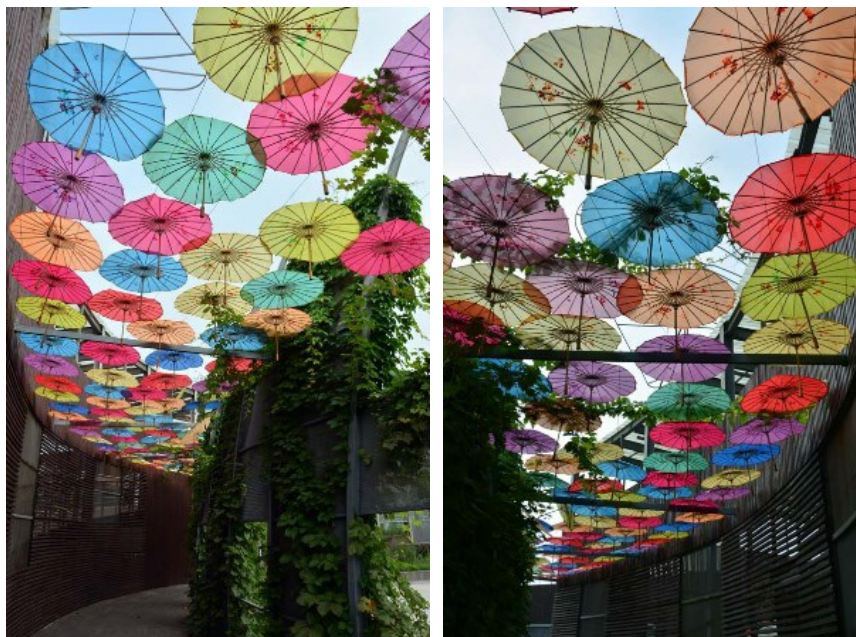
Рис. 31. Галерея зонтиков - элемент сада, который создали дизайнеры провинции Гуандун.

Fig. 31. Gallery of umbrellas - an element of the garden created by designers of the Guangdong Province.