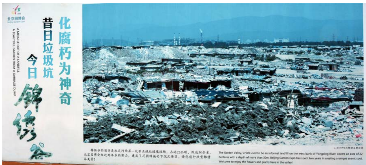
Рис. 1. Фотография на аншлаге в парке исходной территория мусорной свалки, существовавшей до 2010 года, на которой теперь создан пекинский Экспо парк - Beijing Garden Expo Park.

Настоящее сообщение посвящено новому, открытому в 2013 году, уникальному ландшафтному парку Пекина. Это повествование о том, как на месте бывшей городской свалки, загрязняющей водозабор, за несколько лет был создан новый оригинальный парк. В нём представлено традиционное и современное парковое искусство Китая. Это настоящий public botanical garden, имя которому – Beijing Garden Expo Park (рис. 1), который расположился вдоль западного берега реки Юндин (Yongding River), городского района Пекина – Fengtai. Здесь и далее привожу написание китайских названий на английском, как они даны в путеводителях и справочниках, чтобы не допускать разночтения и разнонаписания.