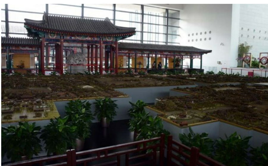
Рис. 26. Макет-панорама исторических садов вокруг Пекина.