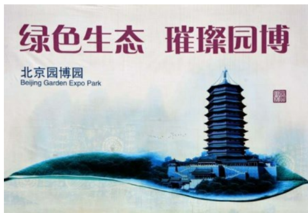
Рис. 2. Символ пекинского выставочного Сада–Парка – Башня Юндин.