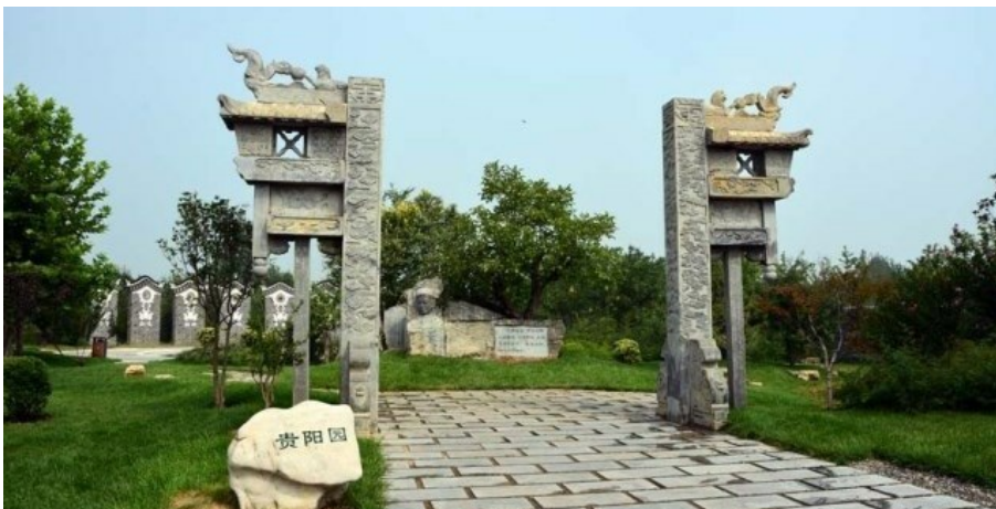
Рис. 20. Сады в стиле Hi Tech.

Fig. 19. Modern-day reconstruction of a South Chinese village with elements of modern parks' design. A bull figure can be seen on the left. Red-leaved prune, - drain krasnolistnyh, trimmed conifers, roads made of different tiles and stones. Crude (unprocessed) stone is used as well.