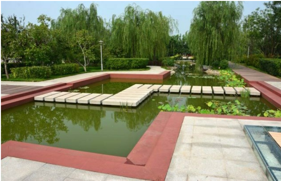
Рис. 21. Сад в стиле Hi Tech. Основные элементы сохранены: пруд (вода), камень (дорожка), "сломанный" мостик, растения.