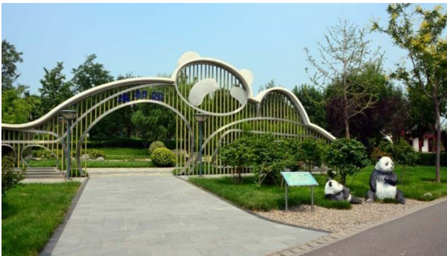
Рис. 22. Сад в стиле Hi Tech. Парк, посвящённый пандам.