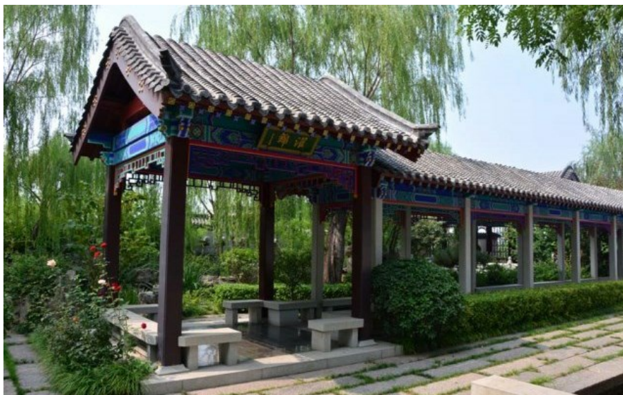
Рис. 15. Традиционная крытая прогулочная галерея. Стриженный кустарник. Плитка (каменная), деревья, дающие нежную ажурную тень. Перед галереей и за ней - пруды-каналы с рыбами.