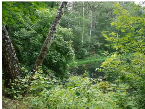
Рис. 7. Пруд в исторической части Сада.

Fig. 6. Ancient marble steps in historical part of the BG.