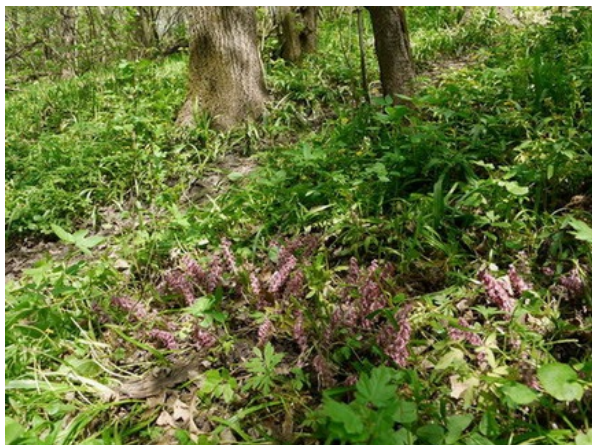
Рис. 18. Lathraea squamaria L., in situ , в БС ВГУ.

Fig. 18. Lathraea squamaria L., in situ , in the BG of the VSU.