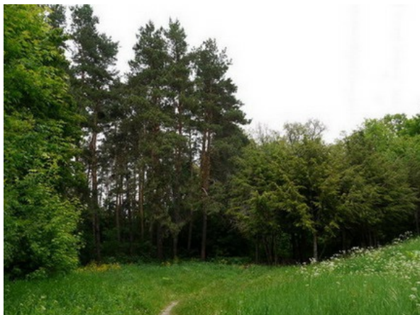
Рис. 10. Экспозиция «Сухой бор».

Fig. 10. The exposition of the "Dry pine forest".