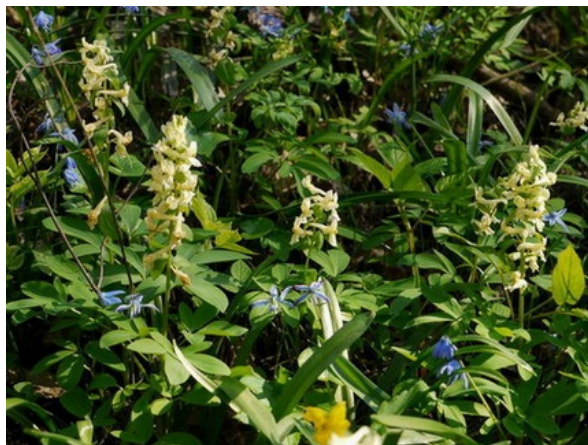
Рис. 17. Corydalis marschalliana (Pall. ex Willd.) Pers., in situ , в БС.

Fig. 16. Grassy slopes in the BG of the VSU.