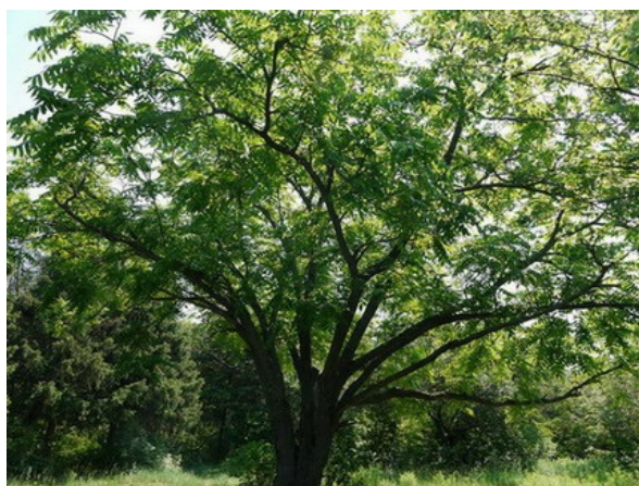
Рис. 13. Juglans mandshurica Maxim. в арборетуме.

Fig. 12. Phellodendron amurense Rupr. in Arboretum