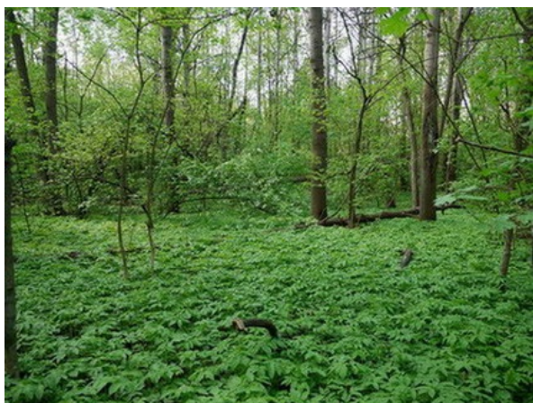
Рис. 1. Снытьево-кленовый осинник в БС ВГУ.

В Ботаническом саду Воронежского госуниверситета (БС ВГУ) с начала его организации в 1937 г. приступили к работе по формированию коллекционных фондов научного и экспозиционного назначения. Для этого были созданы коллекции новых экономических культур, дендрологическая, декоративно-травянистых растений, тропических и субтропических культур, природной флоры и растительности Центрального Черноземья, семенная лаборатория, опылительная пасека. Кроме того, очень важно то, что в Ботаническом саду ВГУ около половины всей площади из 72,3 га занято природными экосистемами, уникальными для урбанизированной территории. Они включают участки коренной и порослевой байрачной дубравы с Quercus robur L., осинники с Populus tremula L. (рис. 1), терновники с Prunus spinosa L. (рис. 2), вишарники с Cerasus vulgaris Risso и разнотравно-злаковые лугово-степные склоны, характерные для средней лесостепи (Муковнина и др., 2005; Щеглов, Муковнина, 2007). В 1970-1980 гг. в них было выявлено 426 видов растений (Муковнина, 1988). К настоящему времени список их пополнился 237 видами за счет адвентиков. Они получили распространение в результате сокращения сбора семян интродуцентов, отсутствия сенокосения и др. агротехнических мероприятий в годы экономических реформ 1990-х годов (Лепешкина, Воронин, 2014).