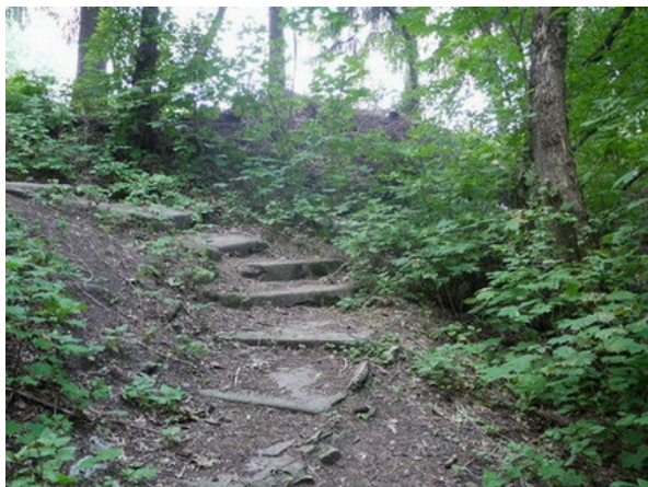
Рис. 6. Старинные мраморные ступени в исторической части БС.

Fig. 6. Ancient marble steps in historical part of the BG.