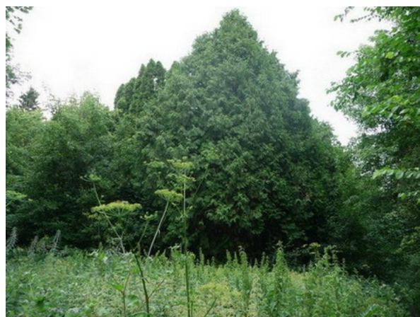
Рис. 9. Туэтум в коллекции хвойных.

Fig. 8. Quercus robur – Acer platanoides – variierbitas in situ, in the BG of the VSU.