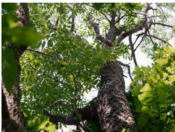
Рис. 12. Phellodendron amurense Rupr. в арборетуме.

В 1948 г., после тяжелой войны и жесточайшей засухи 1946–1947 гг., по всей стране по указанию советского правительства начал осуществляться план преобразования природы, который предполагал закладку лесополос, прудов и иных мелиоративных мероприятий. Учитывая важность проблемы, в Ботаническом саду было создано несколько фруктово-дубовых и кленовых полос, расположенных между коллекционными участками.