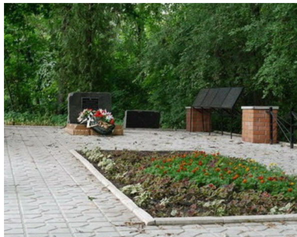
Рис. 5. Памятник воинам и сотрудникам БС ВГУ.

Fig. 4. A place for information session at an Quercus robur L. in the BG of the VSU.