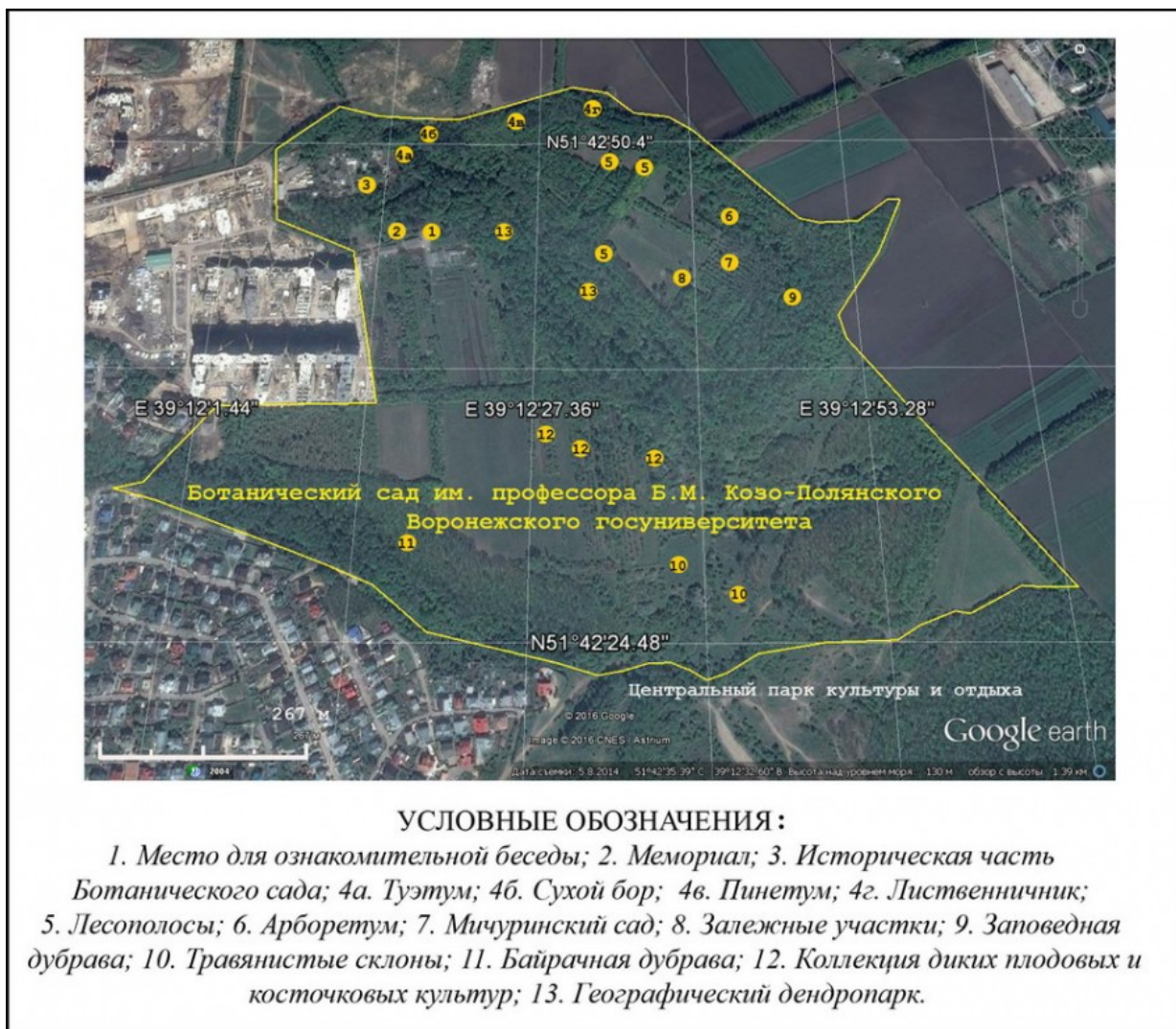
Рис. 3. Пункты маршрута экологической тропы по естественным и антропогенным экосистемам Ботанического сада ВГУ.