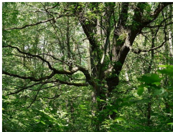
Рис. 15. Quercus robur L. в микрозаповеднике «Заповедная дубрава» БС.

Fig. 14. The plot of fallow land in the BG.