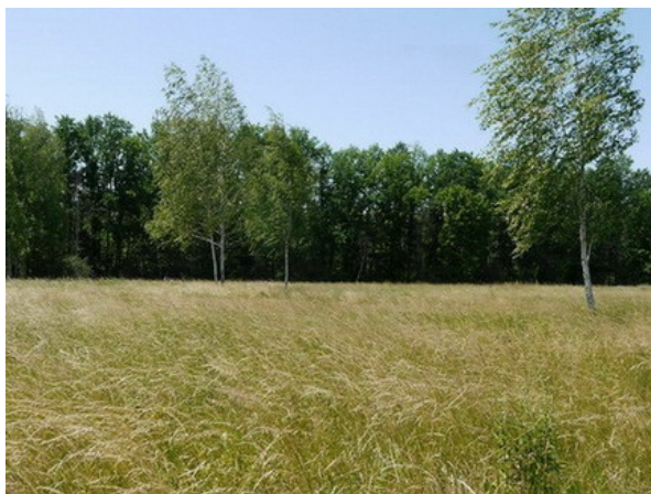
Рис. 14. Участок залежи в БС.

Параллельно сиреневой аллее и мичуринскому саду располагались коллекционные участки растений природной флоры Центрального Черноземья (ЦЧ), в разное время созданные и в разные годы предоставленные естественным процессам (рис. 14). В настоящее время это залежные участки, в формирующихся сообществах которых изучаются фитоценотические возможности сохранившихся видов-интродуцентов, типы их стратегии, констатируется наступление леса на степь.