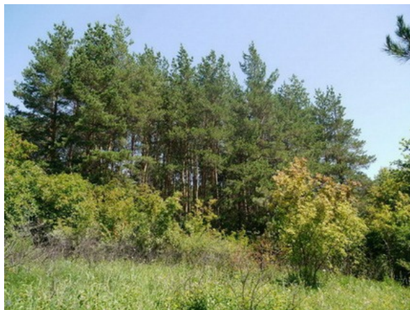
Рис. 11. Пинетум в коллекции хвойных.

Fig. 10. The exposition of the "Dry pine forest".