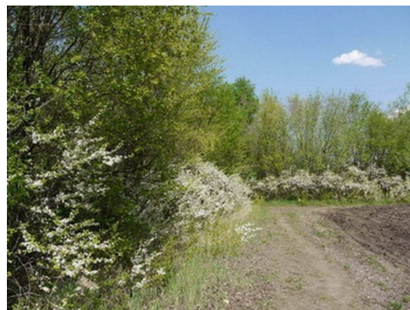
Рис. 2. Терновники в БС ВГУ.

Fig. 1. Populus tremula ± Acer campestre – Aegopodium podagraria , in situ , in the BG of the VSU.