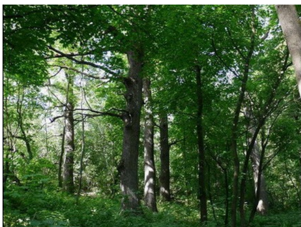
Рис. 8. Quercus robur – Acer platanoides – variierbitas in situ, в БС ВГУ.

Туэтум (рис. 3, п. 4 а; рис. 9) – коллекция различных форм туи западной ( Thuja occidentalis L. ); заложена в 1948–1956 гг.