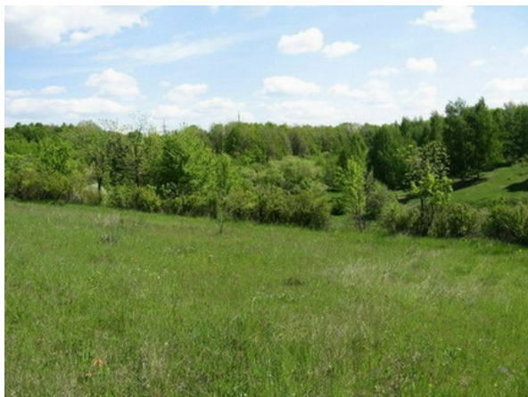
Рис. 16. Травянистые склоны в БС ВГУ.

Fig. 16. Grassy slopes in the BG of the VSU.