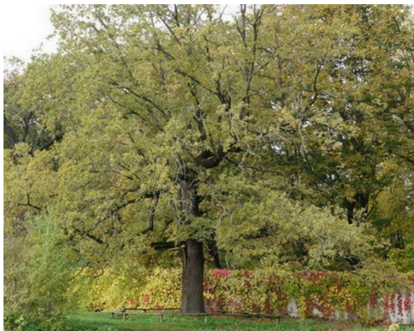
Рис. 4. Место для ознакомительной беседы у дуба черешчатого ( Quercus robur L.) в БС ВГУ.

Fig. 4. A place for information session at an Quercus robur L. in the BG of the VSU.