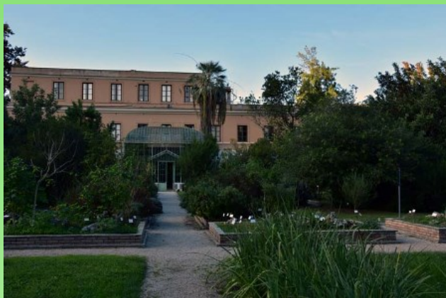
Рис. 2. Первая "монументальная" оранжерея.