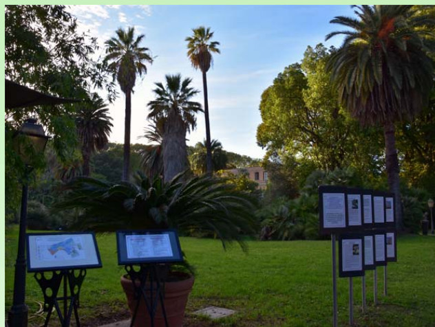
Рис. 16. В Саду много наглядной информации на итальянском и английском языках.

В Саду много наглядной информации (рис. 16) и встречаются малые архитектурные формы (рис. 17).