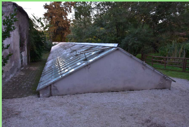
Рис. 12. Задняя сторона теплиц Корсини.

Fig. 12. Entrance to the Corsini greenhouses.