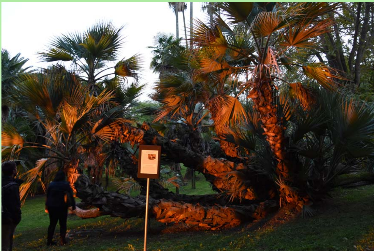
Рис. 4. Уникальный экземпляр пальмы Nannorrhops ritchieana , возраст которого оценивается не менее 200-250 лет.