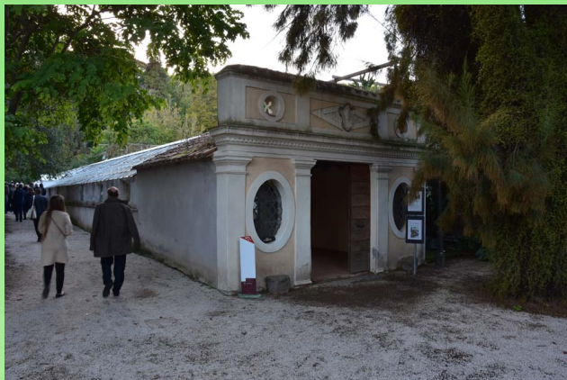
Рис. 11. Вход в теплицы Корсини.

В 1800 году в Саду были построены первые теплицы, которые теперь носят название "теплицы Корсини" (рис. 11-15). Сейчас в них находится коллекция кактусов и суккулентов. Представлены разные виды из семейств Cactaceae , Agavaceae , Euphorbiaceae и Crassulaceae . Ценную часть коллекции представляют «каудексы», которые включают в себя, в частности, виды родов Adenium , Pachypodium и Dioscorea elephantipes (L'Hér.) Engl. (syn. Testudinaria elephantipes (L'Hér.) Burch.).