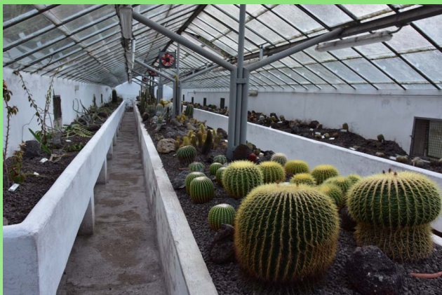
Рис. 14. Экспозиция кактусов.