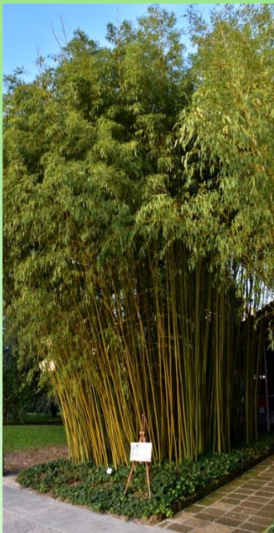
Рис. 7. Один из видов бамбука в коллекции Сада.