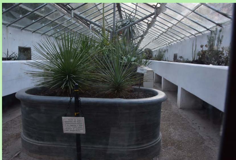
Рис. 13. Исторические вазоны для выращивания кактусов и суккулентов.

Fig. 12. Backside of the Corsini greenhouses.