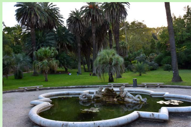
Рис. 17. Фонтан Тритон.

Fig. 16. A lot of information at the Garden is presented in both Italian and English.