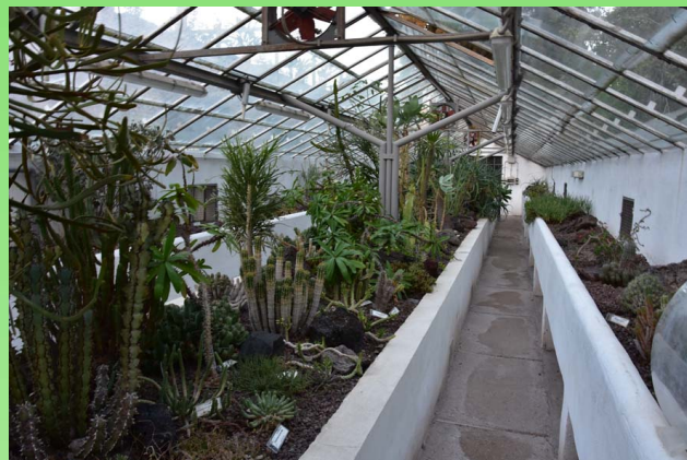
Рис. 15. Экспозиция суккулентов.