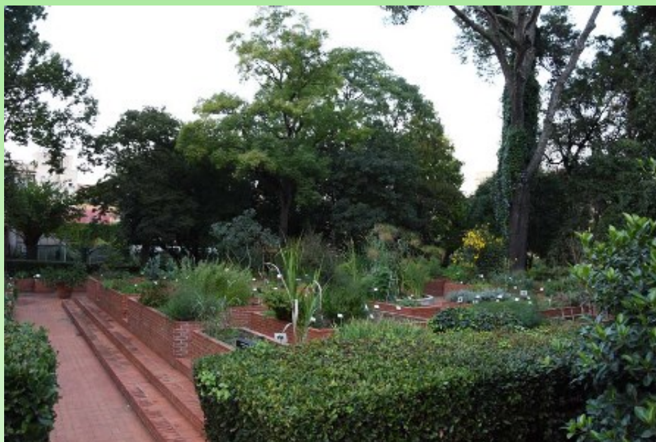
Рис. 8-10. Коллекция лекарственных растений.