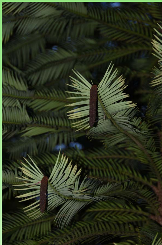
Рис. 18, 19. Wollemia nobilis (Araucariaceae)