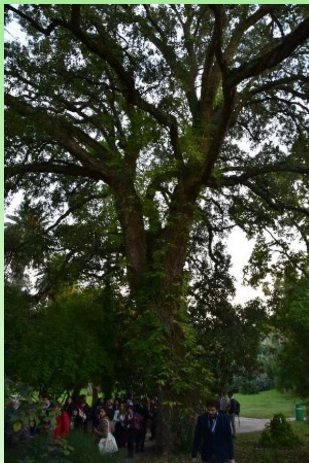
Рис. 6. Уникальный экземпляр Quercus suber , возраст которого примерно тысяча лет.

Fig. 5. A unique sample of Cladrastis kentukea (Dum.Cours.) Rudd ( Sophora kentukea Dum.Cours. = Cladrastis kentukea (Dum.Cours.) Rudd.) estimated age makes at least 700 years