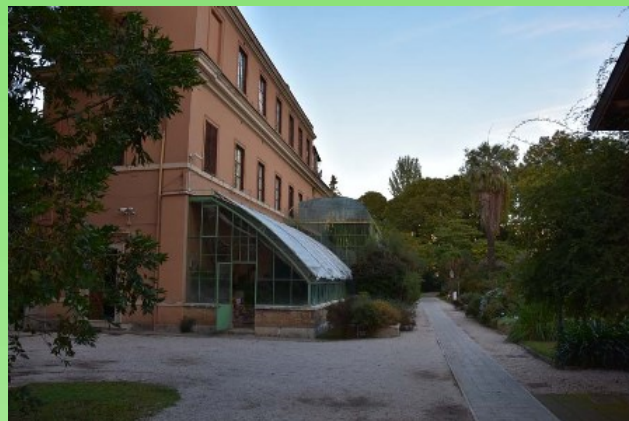
Рис. 3. Первая "монументальная" оранжерея. Вид сбоку.