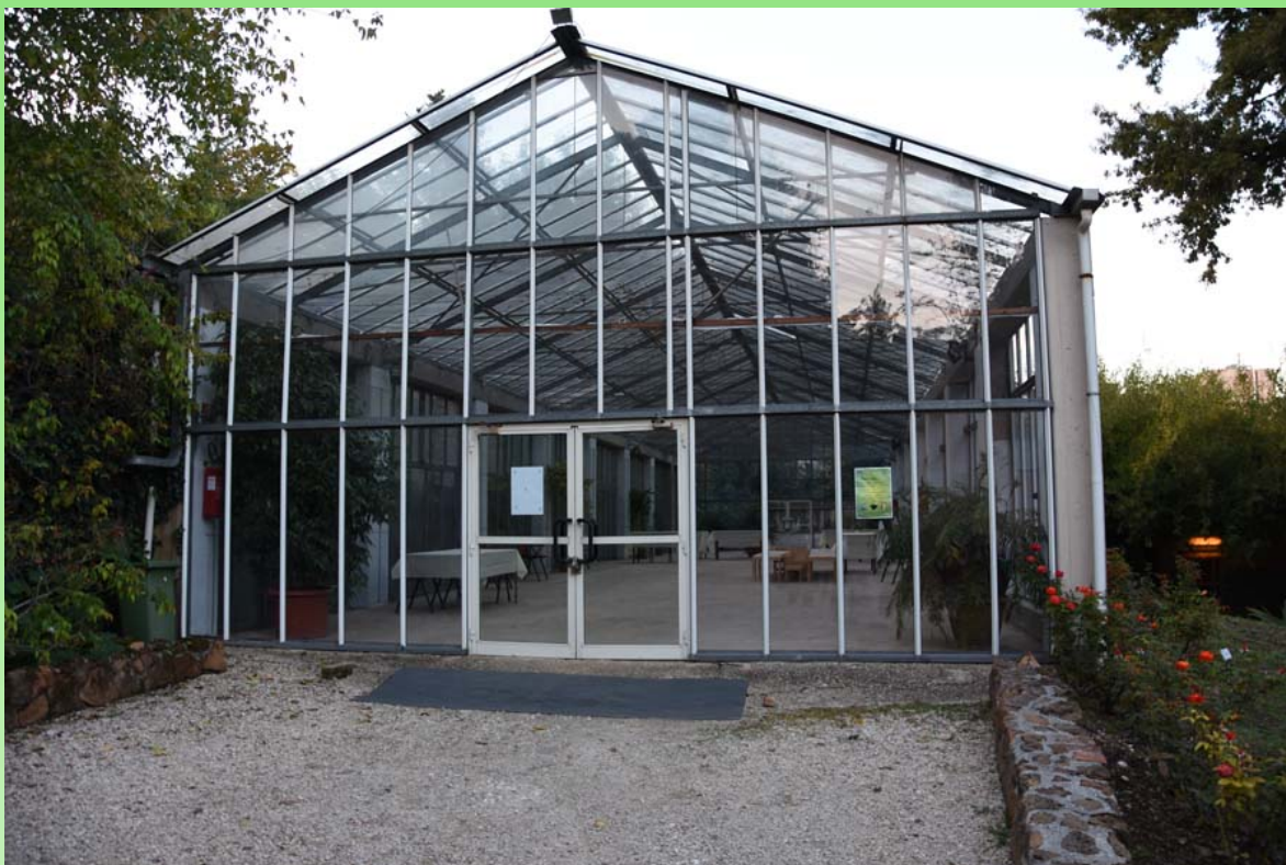
Рис. 20. Одна из оранжерей для приёмов.

Один недостаток был у этой поездки - мы очень поздно по времени приехали в Сад и не смогли обойти его полностью, не увидели многие его редкости и все достопримечательности. Но теперь, зная о нём, вполне можно спланировать поездку так, чтобы с утра оказаться в Саду и оценить его весь по достоинству.