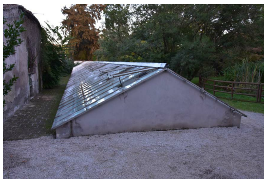
Рис. 12. Задняя сторона теплиц Корсини.