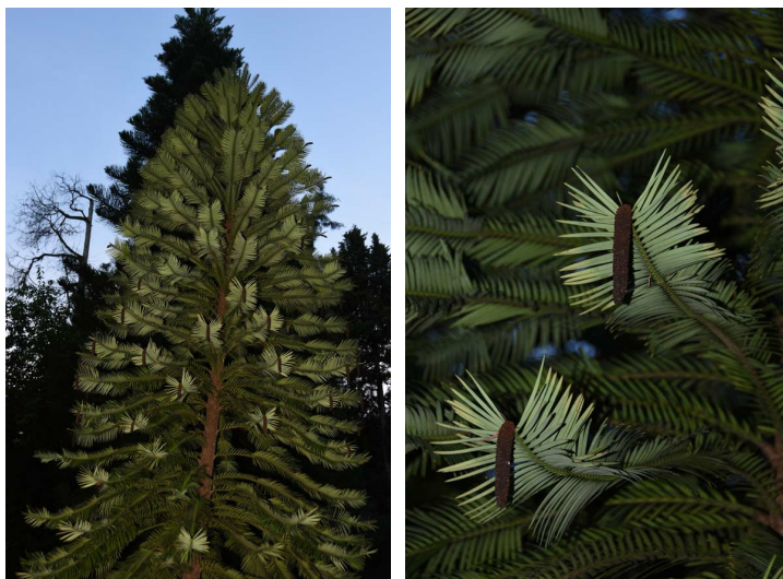
Рис. 18, 19. Wollemia nobilis (Araucariaceae)