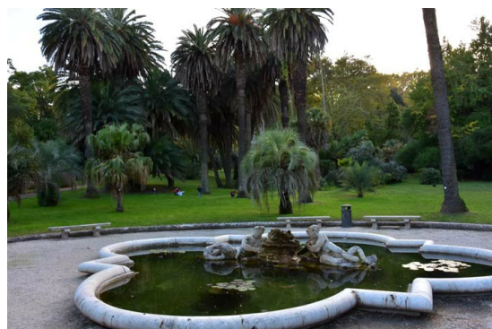
Рис. 17. Фонтан Тритон.

Fig. 16. A lot of information at the Garden is presented in both Italian and English.