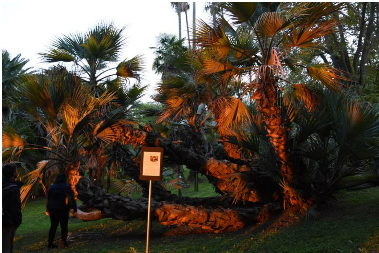
Рис. 4. Уникальный экземпляр пальмы Nannorrhops ritchieana , возраст которого оценивается не менее 200-250 лет.

Fig.4. A unique sample of a palm - Nannorrhops ritchieana , its estimated age is no less than 200-250 years.