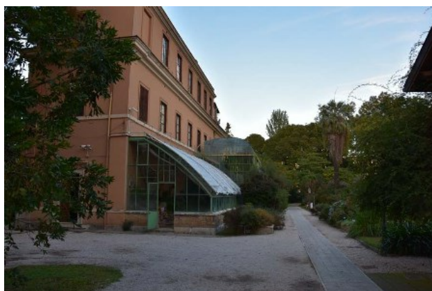
Рис. 3. Первая "монументальная" оранжерея. Вид сбоку.