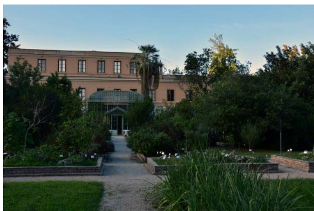
Рис. 2. Первая "монументальная" оранжерея.

Первый директор перенёс существующие коллекции из сада Ranisperna. Он же создал первый "зимний сад" (рис. 2, 3), построенную для этого случая "монументальную" оранжерею. Пьетро Пиррота осуществил строительство двух новых теплиц, и, наконец, значительно увеличил численный видовой состав коллекций Сада. На сегодняшний день число видов выращиваемых в Саду оценивается на уровне около 3500 видов. Однако, в последние годы она продолжает увеличиваться. Многие, ранее неопределённые виды, заново определяют и вводят в коллекции уже с "правильными" названиями; по предварительным оценкам сотрудников Университета на сегодняшний день общее число таксонов уже может достигать 5 тысяч.