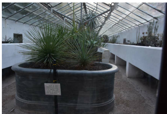
Рис. 13. Исторические вазоны для выращивания кактусов и суккулентов.