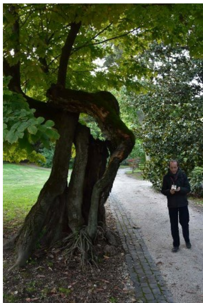
Рис. 5. Уникальный экземпляр Cladrastis kentukea (Dum.Cours.) Rudd., возраст которого оценивают не менее 700 лет.

Fig. 5. A unique sample of Cladrastis kentukea (Dum.Cours.) Rudd ( Sophora kentukea Dum.Cours. = Cladrastis kentukea (Dum.Cours.) Rudd.) estimated age makes at least 700 years