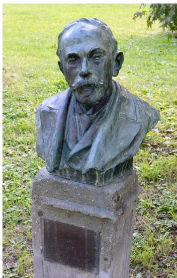
Рис. 1. Первый директор сада – Пьетро Ромуальдо Пиротта (1853–1936).

Лунгара (времена папы Пия VII). А в 1883 году была осуществлена покупка виллы итальянским государством для Академии наук, и был создан городской Ботанический сад (первый директор Сада был P.R. Pirotta – Пьетро Ромуальдо Пиротта [рис. 1]). В то время площадь Сада составляла порядка 30 гектар. Расположен Сад с видом на Палаццо Риарио Корсини 17-го века, который в период 1659-1689 был резиденцией шведской королевы Кристины. В XVII веке часть Ботанического сада была частным садом Палаццо Корсини. После того, как дворец стал собственностью итальянского государства, разрозненные административные части Сада были объединены, в том числе и с существующими папскими садами, сохраняя с тех пор общую историческую планировку.