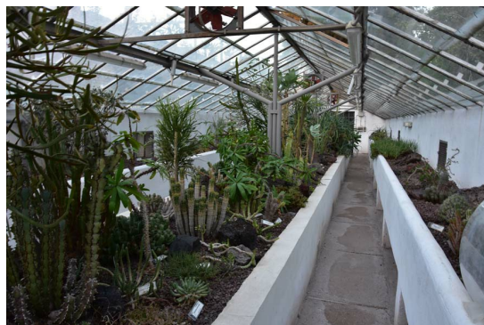
Рис. 15. Экспозиция суккулентов.