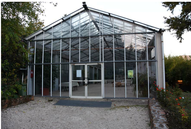
Рис. 20. Одна из оранжерей для приёмов.