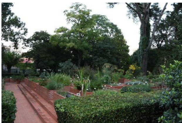
Рис. 8-10. Коллекция лекарственных растений.