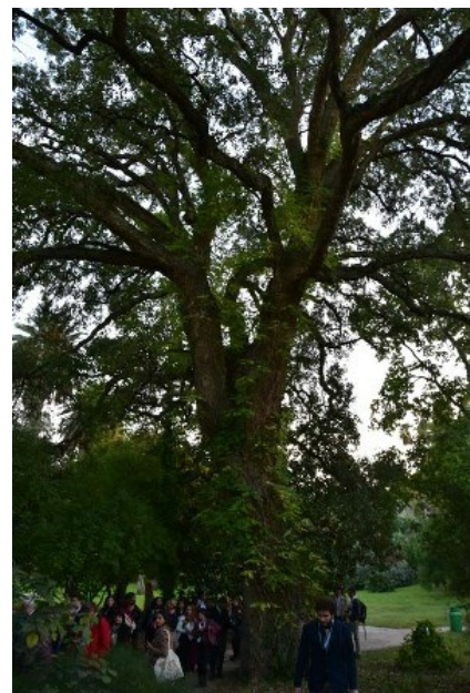
Рис. 6. Уникальный экземпляр Quercus suber , возраст которого примерно тысяча лет.

Fig. 5. A unique sample of Cladrastis kentukea (Dum.Cours.) Rudd ( Sophora kentukea Dum.Cours. = Cladrastis kentukea (Dum.Cours.) Rudd.) estimated age makes at least 700 years