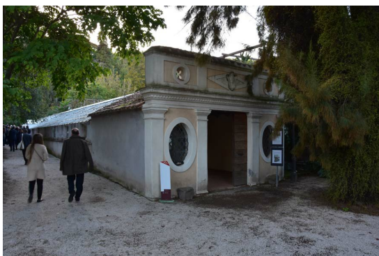
Рис. 11. Вход в теплицы Корсини.

В 1800 году в Саду были построены первые теплицы, которые теперь носят название "теплицы Корсини" (рис. 11-15). Сейчас в них находится коллекция кактусов и суккулентов. Представлены разные виды из семейств Cactaceae , Agavaceae , Euphorbiaceae и Crassulaceae . Ценную часть коллекции представляют «каудексы», которые включают в себя, в частности, виды родов Adenium , Pachypodium и Dioscorea elephantipes (L'Hér.) Engl. (syn. Testudinaria elephantipes (L'Hér.) Burch.).