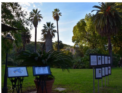
Рис. 16. В Саду много наглядной информации на итальянском и английском языках.

В Саду много наглядной информации (рис. 16) и встречаются малые архитектурные формы (рис. 17).