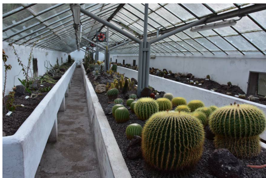
Рис. 14. Экспозиция кактусов.