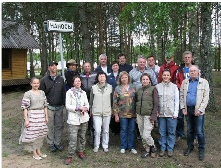
Рис. 5. Экспедиционный выезд 2015 г., этно-культурный комплекс Наносы.