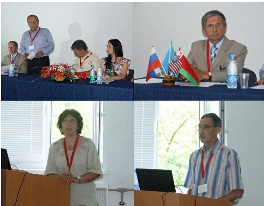
Рис. 2. На международном семинаре с экспедиционным выездом «Стратегия и методы ботанических садов по сохранению и устойчивому использованию биоразнообразия природной флоры - I», 24 июня 2013.