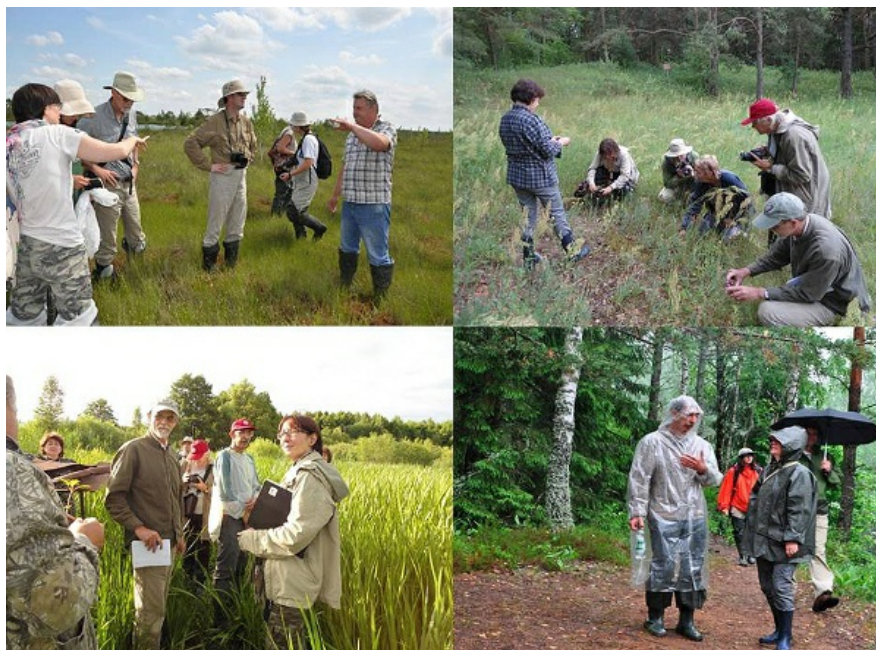
Рис. 3. Экспедиционный выезд - 2013.