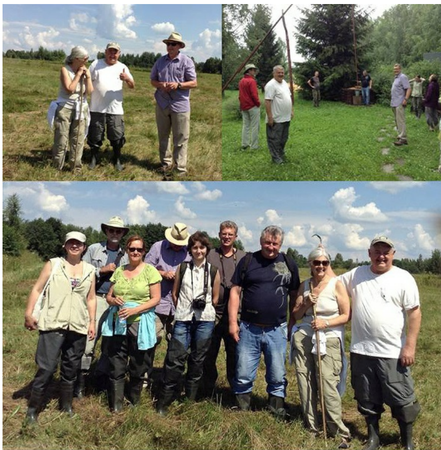
Рис. 4. Экспедиционный выезд - 2014.

семинаре участниками из Беларуси, России и США было сделано 14 докладов на актуальные темы сохранения биоразнообразия растительного мира и роли научного обеспечения для оптимального выполнения задач ГССР. В Семинаре приняло участие 117 человек (согласно списка зарегистрированных участников из научных учреждений Беларуси и зарубежья).