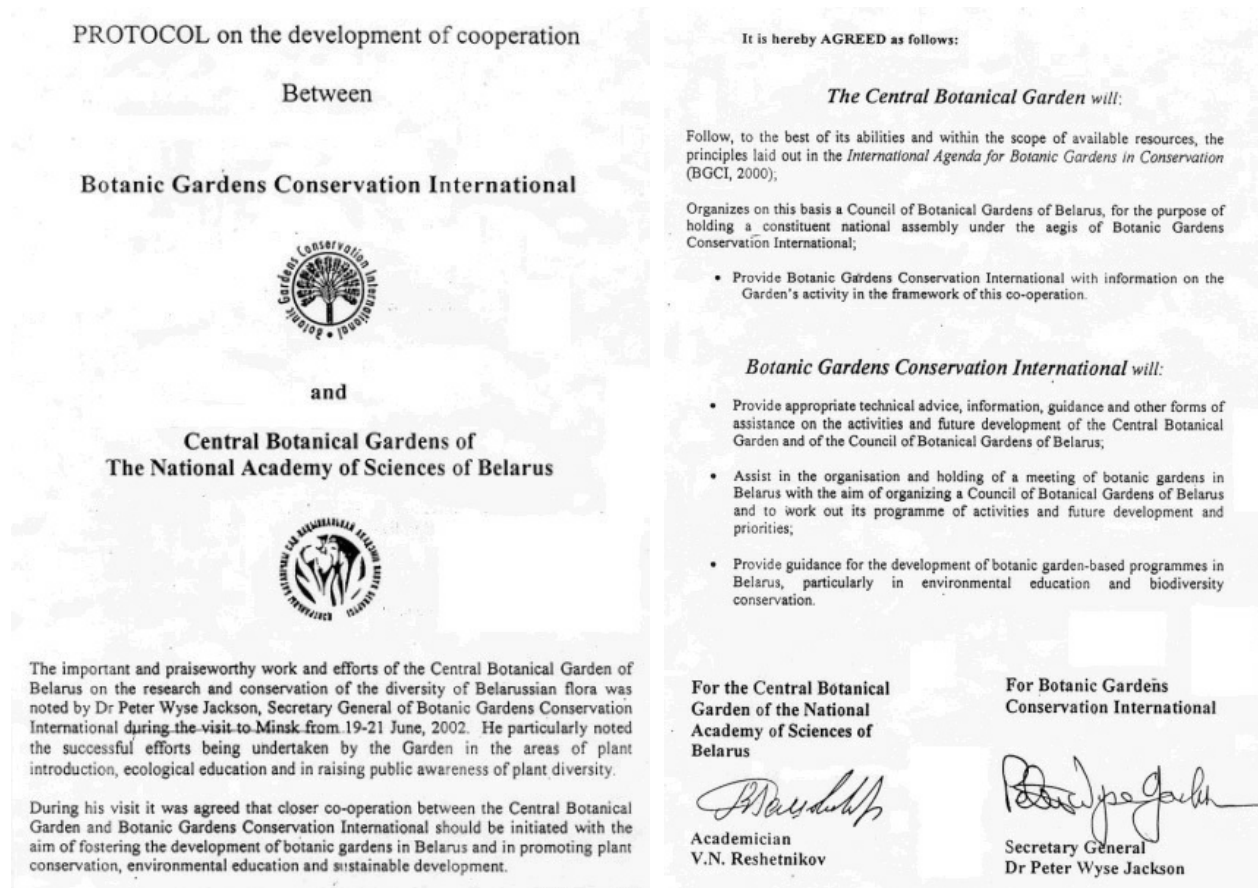
Рис. 1 Протокол о развитии сотрудничества между BGCI и Центральным ботаническим садом, подписанный в 2000 г. директором ЦБС, академиком В. Н. Решетниковым и генеральным секретарем BGCI доктором Питером Вайсом Джексоном.

Джексона в 2000 г. в Центральный ботанический сад НАН Беларуси (ЦБС), по результатам которого был подписан протокол сотрудничества с BGCI (Botanical Garden Conservational International - Международный совет ботанических садов по охране растений; рис. 1).