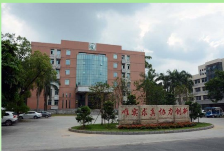
Рис. 2. Главное здание Южно-Китайского института ботаники АН Китая.