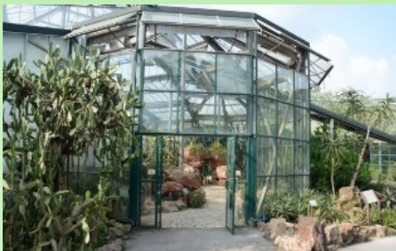
Рис. 5. Оранжерея для кактусов и других суккулентов.

Вся территория Южно-Китайского ботанического сада является уникальным открытым музеем тропических и субтропических растений. В нём собраны редчайшие виды и представлены удивительные экземпляры растений со всего мира, чему во многом способствует мягкий и ровный климат региона. К настоящему времени число таксонов, находящихся в коллекциях живых растений Сада, достигло 14 тысяч. В экспозиционной зоне представлены оранжерейные комплексы (рис. 4). В одном из них (самом крупном), собраны тропические растения (которые у нас являются «комнатными»), в другом представлены растения высокогорий (альпийские), в третьем - кактусы с суккулентами (рис. 5), в четвёртом - различные тропические орхидеи, некоторые папоротники и разнообразные виды семейства Bromeliaceae .