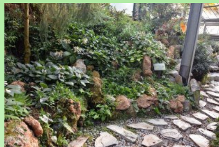
Рис. 10. Разные виды рода Chirita представлены на "камеристых склонах" внутри оранжереи.

В самой же большой оранжерее представлены тропические виды. Внутри комплекса очень удачно расположены и "вписаны в ландшафт" деревянные дорожки для посетителей с местами высадки растений (рис. 11-14). Очень ценно и то, что в самом центре этой оранжереи, в "расщелине скал", оборудован бесплатный общественный туалет. Как раз после того, как посетители осмотрят "водопад в тропическом дождевом лесу". Все "скалы" и многие "каменные глыбы" - это всё творение рук человеческих (каркасы, облепленные раскрашенным бетоном). Если не присматриваться и не щупать - полное впечатление настоящих скал и камней. Но вот все растения в комплексе - настоящие, живые. Хотя иногда есть чувство - а может быть это всё же пластик?