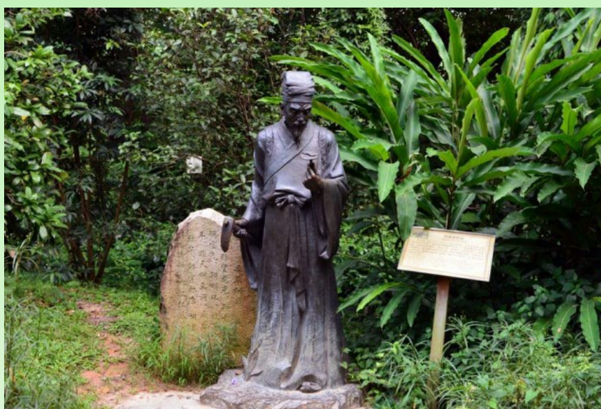
Рис. 23. Памятник Li Shi Zhen'ю (1518-1593).