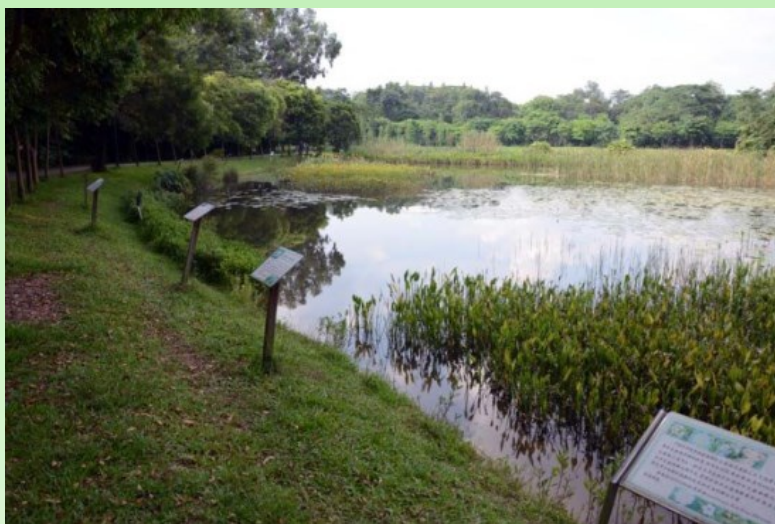
Рис. 25. Коллекция водных растений.