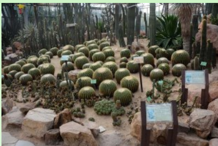
Рис. 7. Часть экспозиции внутри кактусовой оранжереи.