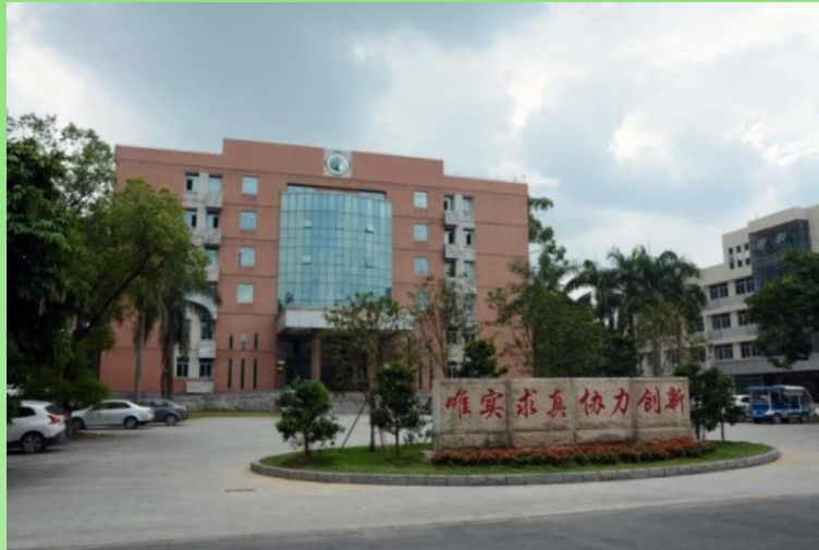
Рис. 2. Главное здание Южно-Китайского института ботаники АН Китая.