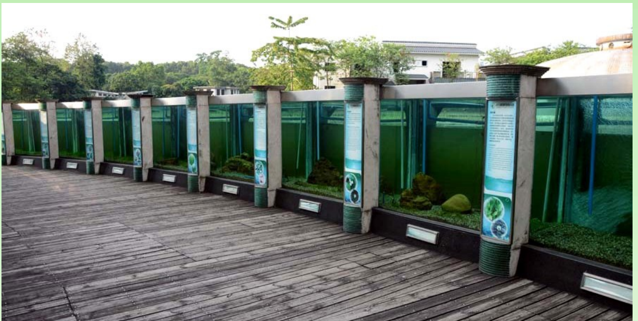
Рис. 29. Аквариумы для демонстрации водных видов растений.

В целом, Сад хорошо организован. Много этикеток расположено на или около растений, достаточно много генеральных аншлагов, на них представлена информация о том, где вы находитесь, где и какие коллекции и экспозиции можно ещё увидеть (рис. 27, 28).