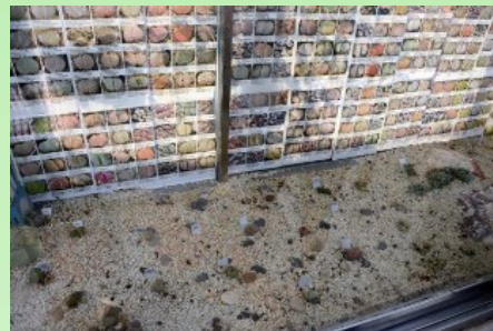
Рис. 6. Часть коллекции-экспозиции видов рода Lithops .