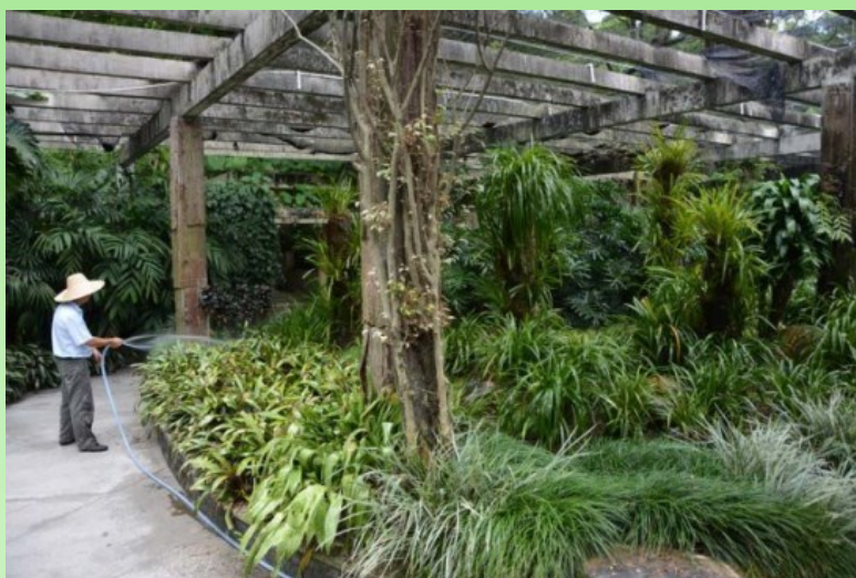
Рис. 21. Часть экспозиции орхидей флоры Китая под лёгким навесом. Момент ухода за растениями.

На выделенной отдельной площади Сада представлены основные лекарственные растения (рис. 22), используемые в традиционной китайской медицине. Перед этой коллекцией стоит памятник доктору Li Shi Zhen'ю (1518-1593) (рис. 23), который написал первый, ставший классическим, лечебник " Compendium of Materia Medica ". В этом манускрипте дано описание 1892 видам лекарственного сырья растительного, животного и минерального происхождения и приведено около 12 тысяч рецептов их применения в традиционной китайской медицине. Начиная с 2017 года вся медицинская общественность Китая начинает широко отмечать 500-летие со дня рождения Ли Ши Чжэня, автора этого важнейшего, краеугольного труда - основы системы всей традиционной китайской медицины.