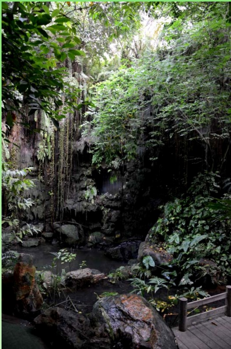
Рис. 14. Часть экспозиции в большой оранжерее - Тропический дождевой лес.