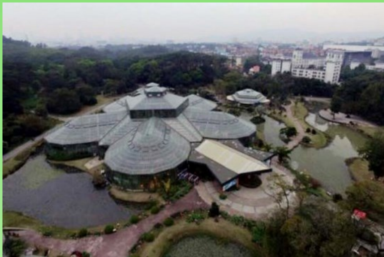
Рис. 4. Оранжерейный комплекс.

Вся территория Южно-Китайского ботанического сада является уникальным открытым музеем тропических и субтропических растений. В нём собраны редчайшие виды и представлены удивительные экземпляры растений со всего мира, чему во многом способствует мягкий и ровный климат региона. К настоящему времени число таксонов, находящихся в коллекциях живых растений Сада, достигло 14 тысяч. В экспозиционной зоне представлены оранжерейные комплексы (рис. 4). В одном из них (самом крупном), собраны тропические растения (которые у нас являются «комнатными»), в другом представлены растения высокогорий (альпийские), в третьем - кактусы с суккулентами (рис. 5), в четвёртом - различные тропические орхидеи, некоторые папоротники и разнообразные виды семейства Bromeliaceae .