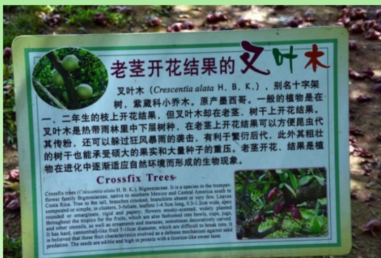
Рис. 27. Crescentia alata (Bignoniaceae). Этикетка.