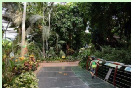
Рис. 11. Внутри большой тропической оранжереи.

В самой же большой оранжерее представлены тропические виды. Внутри комплекса очень удачно расположены и "вписаны в ландшафт" деревянные дорожки для посетителей с местами высадки растений (рис. 11-14). Очень ценно и то, что в самом центре этой оранжереи, в "расщелине скал", оборудован бесплатный общественный туалет. Как раз после того, как посетители осмотрят "водопад в тропическом дождевом лесу". Все "скалы" и многие "каменные глыбы" - это всё творение рук человеческих (каркасы, облепленные раскрашенным бетоном). Если не присматриваться и не щупать - полное впечатление настоящих скал и камней. Но вот все растения в комплексе - настоящие, живые. Хотя иногда есть чувство - а может быть это всё же пластик?