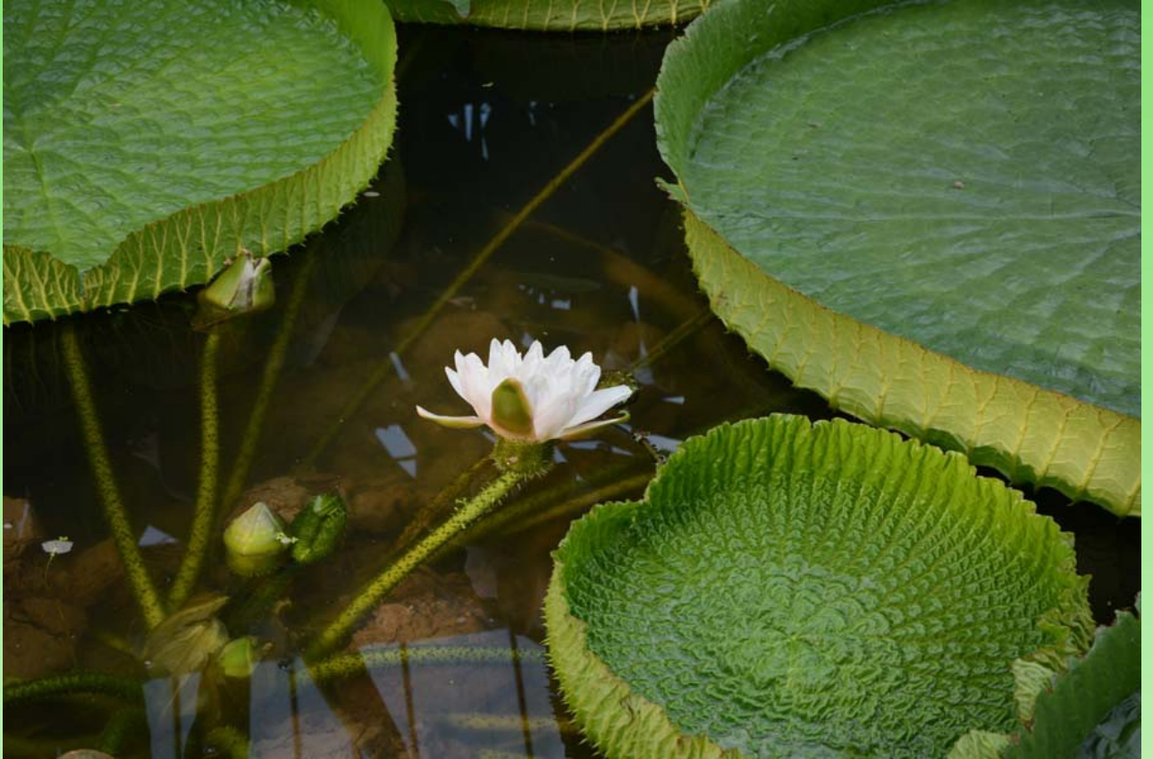
Рис. 13. Victoria sp.