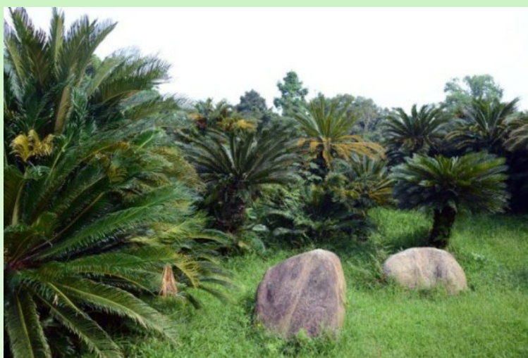
Fig. 14. Part of the collection - Tropical Rain forest.