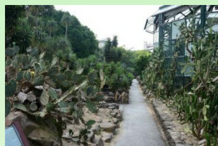
Рис. 8. В открытом грунте представлены разные виды рода Opuntia .