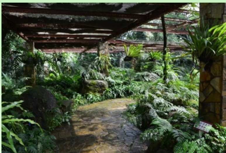
Рис. 18. Часть коллекции-экспозиции папоротников.

Открытые пространства Сада разделены на несколько секторов, где представлены: магнолии, пальмы (кокосовые, финиковые, веерные), разнообразные лианы, редкие и исчезающие виды (прежде всего