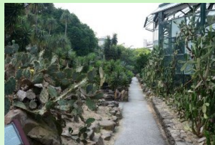
Рис. 8. В открытом грунте представлены разные виды рода Opuntia .

Отдельной гордостью Сада является «аридная» или «пустынная» оранжерея, расположенная в одном из оранжерейных комплексов. В ней находится богатая коллекция кактусов и суккулентов. Общая площадь этой оранжереи 777 м 2 , высота её около 10.5 м. Особое внимание уделено коллекции видов рода Lithops . Все помещения в оранжерее в настоящее время оборудованы самыми современными контролирующими климат технологиями, позволяющими поддерживать оптимальную температуру и