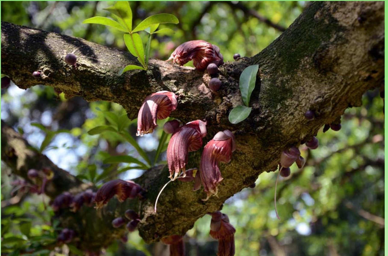
Рис. 28. Criscentia alata (Bignoniaceae). Цветение.