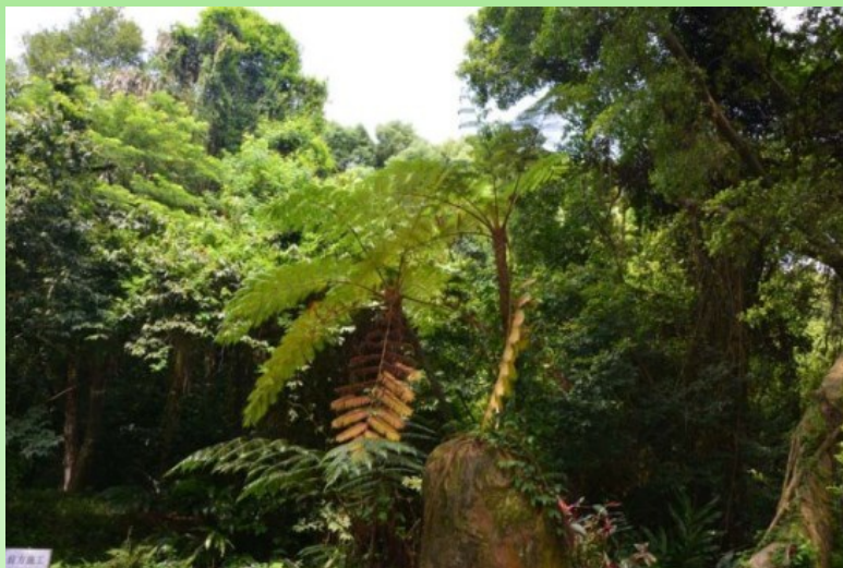
Рис. 17. Древовидные папоротники Sphaeropteris lepifera , растущие в открытом грунте.