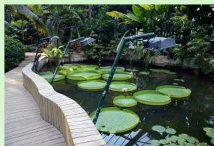
Рис. 12. Victoria sp.