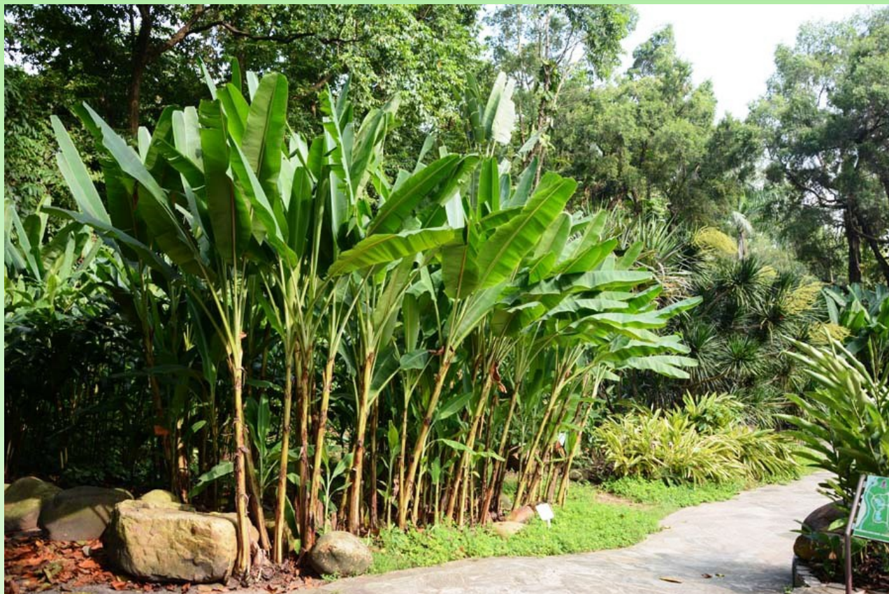
Рис. 19. Начало коллекции видов семейства Zingiberaceae .

В парке есть большая коллекция-экспозиция видов основных родов семейства Zingiberaceae (рис. 19). В Саду много места отведено разнообразным орхидеям не только флоры Китая, но и тропическим видам сопредельных территорий. А расположены экспозиции на специально оборудованных местах: либо под лёгкими тентами, либо на сухих стволах деревьев, либо в небольших (застеклённых или проветриваемых) экспозиционных «тепличках» (рис. 20-21).