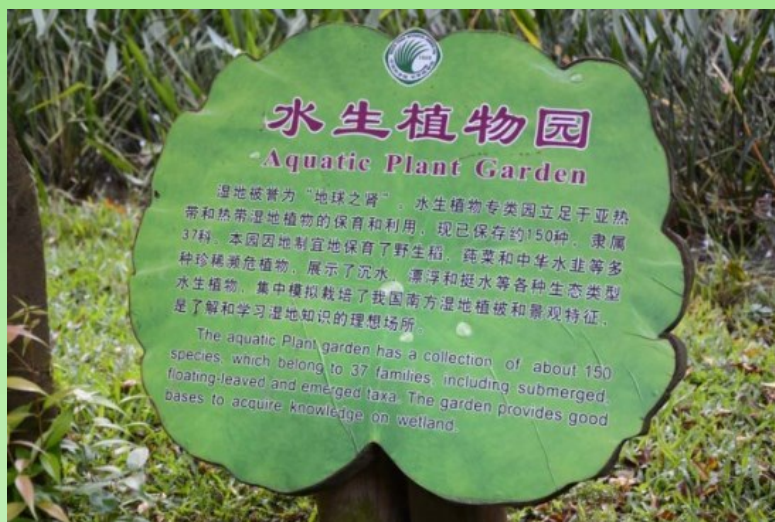
Рис. 24. Типичная этикетка коллекции.

Привожу здесь эти этикетки как образец либо для подражания, либо использования идеи, как нечто подобное можно (или уже нужно) сделать в наших ботанических садах. Ибо такие двуязычные информационные аншлаги очень помогают "неорганизованному" туристу знакомиться с коллекциями, экспозициями. А так же они помогают во время проведения экскурсий, в том числе и для иностранных коллег.