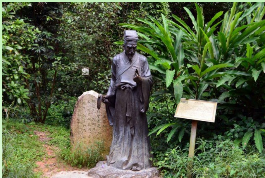
Рис. 23. Памятник Li Shi Zhen'ю (1518-1593).

Южную половину Сада занимают разросшиеся растения тропических и субтропических лесов, плантации цитрусов и бананов, и конечно же в Саду есть бамбуковая роща. Когда есть время, то просто пройти прогулочным шагом с посещением разных уголков сада - истинное удовольствие и наслаждение. Время цветения основной массы видов в Саду - с февраля по конец апреля. В этот период года там ещё не так жарко и не так парно, как в период с июня по сентябрь.