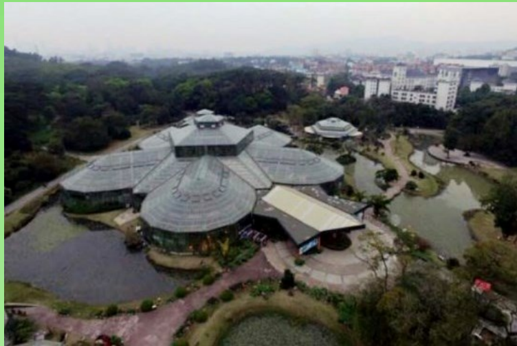
Рис. 4. Оранжерейный комплекс.