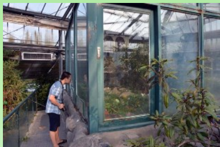
Рис. 9. Внутри "Альпийской" оранжереи, где поддерживается температура +18–20° С, часть растений выращивают внутри закрытых "парничков".

На территории оранжерейных комплексов Ботанического сада построена уникальная для этих территорий оранжерея - Альпийская (рис. 9-10). Она оснащена холодильными установками для содержания, выращивания и демонстрации альпийских и высокогорных, а также растений умеренных широт. Общая площадь этого комплекса около 1200 м 2 , высота, как и кактусовой оранжереи – 10.5 м. Посещение этой коллекции и экспозиции производит незабываемое впечатление на местных жителей и гостей Сада, попадающих в «экстремальные» условия, когда в оранжерее всего +18–20° С, а на улице в это время от + 38 до + 43° С. А для меня же это был момент «отдохновения» от тяжёлой жары и духоты города Гуанчжоу. «Забавным» было видеть в оранжерее, да ещё и за стеклом, виды таких родов как Lupinus , Primula , Digitalis , Viola , Symphytum . При этом, в ней представлены также некоторые низкорослые виды рода Rhododendron , и некоторые представители высокогорной флоры Китая семейства Gesneriaceae (например, виды рода Chirita ). В коллекцию включены редкие и охраняемые виды высокогорий и «полярных» территорий. Всего в этой оранжерее насчитывается около 250 таксонов.