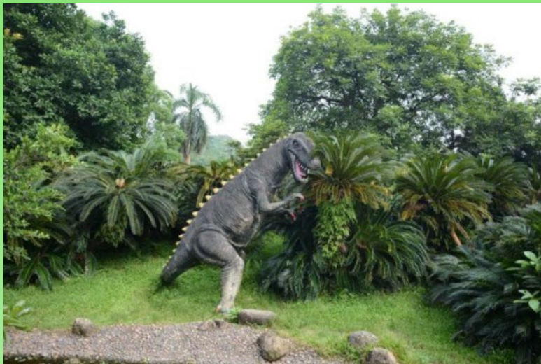
Рис. 15, 16. Цикадовые в экспозициях Сада.