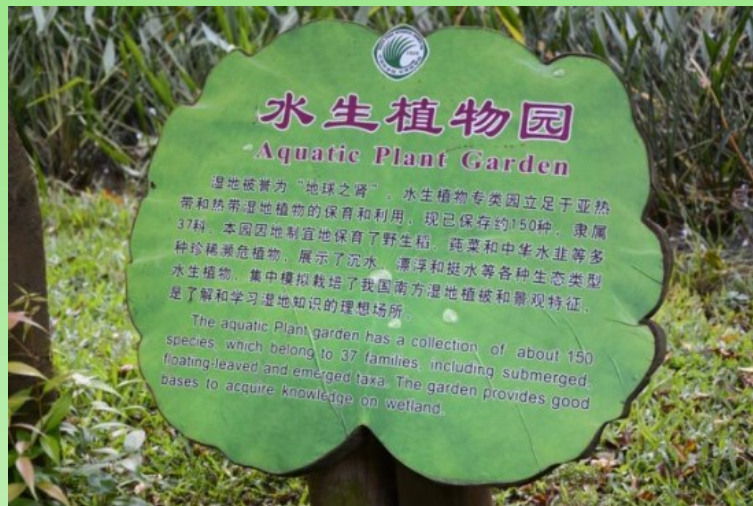
Рис. 24. Типичная этикетка коллекции.

Привожу здесь эти этикетки как образец либо для подражания, либо использования идеи, как нечто подобное можно (или уже нужно) сделать в наших ботанических садах. Ибо такие двуязычные информационные аншлаги очень помогают "неорганизованному" туристу знакомиться с коллекциями, экспозициями. А так же они помогают во время проведения экскурсий, в том числе и для иностранных коллег.