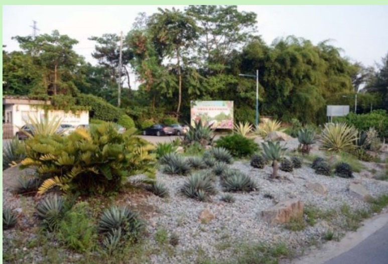
Рис. 3. Вход в Южно-Китайский ботанический сад.