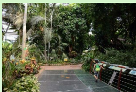
Рис. 11. Внутри большой тропической оранжереи.

В самой же большой оранжерее представлены тропические виды. Внутри комплекса очень удачно расположены и "вписаны в ландшафт" деревянные дорожки для посетителей с местами высадки растений (рис. 11-14). Очень ценно и то, что в самом центре этой оранжереи, в "расщелине скал", оборудован бесплатный общественный туалет. Как раз после того, как посетители осмотрят "водопад в тропическом дождевом лесу". Все "скалы" и многие "каменные глыбы" - это всё творение рук человеческих (каркасы, облепленные раскрашенным бетоном). Если не присматриваться и не щупать - полное впечатление настоящих скал и камней. Но вот все растения в комплексе - настоящие, живые. Хотя иногда есть чувство - а может быть это всё же пластик?