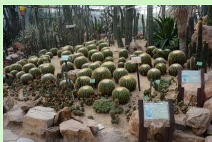
Рис. 7. Часть экспозиции внутри кактусовой оранжереи.