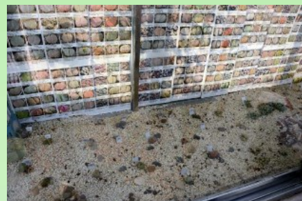
Рис. 6. Часть коллекции-экспозиции видов рода Lithops .