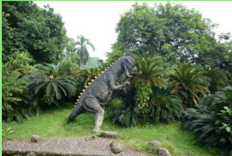
Рис. 15, 16. Цикадовые в экспозициях Сада.