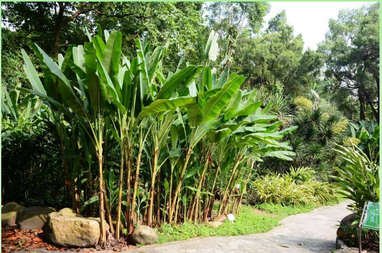
Рис. 19. Начало коллекции видов семейства Zingiberaceae .

В парке есть большая коллекция-экспозиция видов основных родов семейства Zingiberaceae (рис. 19). В Саду много места отведено разнообразным орхидеям не только флоры Китая, но и тропическим видам сопредельных территорий. А расположены экспозиции на специально оборудованных местах: либо под лёгкими тентами, либо на сухих стволах деревьев, либо в небольших (застеклённых или проветриваемых) экспозиционных «тепличках» (рис. 20-21).