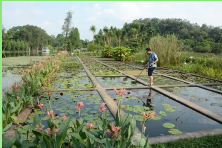
Рис. 26. Коллекция видов и гибридов рода Nymphaea и ряда других красивоцветущих водных видов растений.