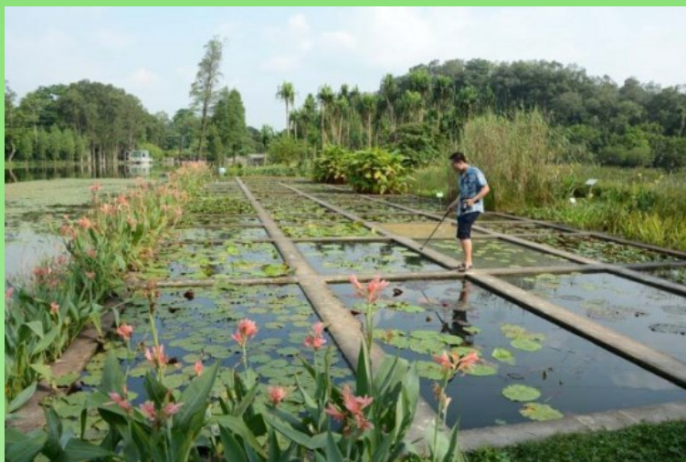
Рис. 26. Коллекция видов и гибридов рода Nymphaea и ряда других красивоцветущих водных видов растений.