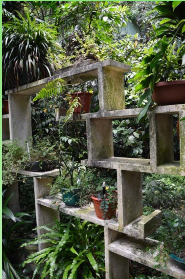
Рис. 22. Часть экспозиции лекарственных растений.