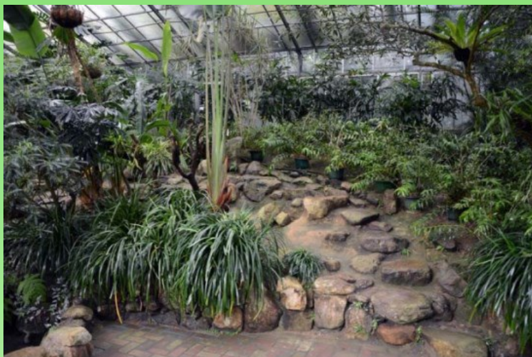
Рис. 20. Часть коллекции орхидей под стеклом.