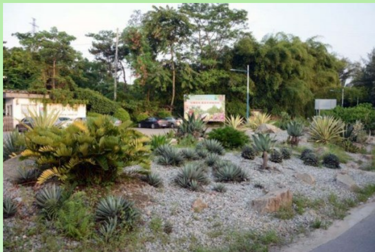
Рис. 3. Вход в Южно-Китайский ботанический сад.