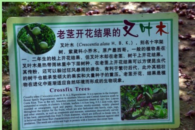
Рис. 27. Criscentia alata (Bignoniaceae). Этикетка.