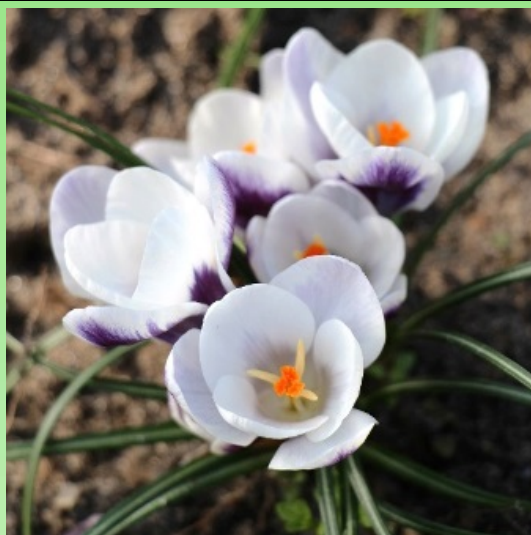
Рис. 7. Крокус золотистый 'Принс Клаус'.

Fig. 6. Crocus tommasinianus 'Ruby Giant'.