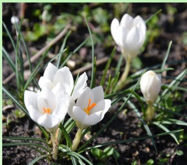
Рис. 3. Крокус двухцветковый 'Мисс Вайн'.