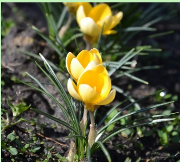
Рис. 2. Крокус золотистый 'Романс'.

Высота растения до 3.4 см, диаметр розетки в начале цветения 17.8 см, в конце – 30.0 см, количество цветков – 4. Цветок: высота – 2.5 см, диаметр – 3.1 см. Окраска долей околоцветника: лимонно-желтый с коричневатыми полосками. Листья узколинейные, прикорневые, растущие пучком, появляются во время цветения. Длина листа 7 см, ширина – 0.2 см. Продолжительность цветения 42 дня. Коэффициент размножения – 3.9.