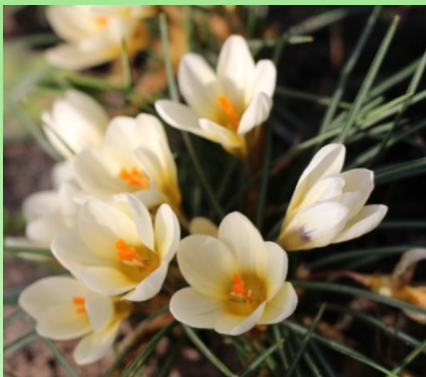
Рис. 4. Крокус золотистый ‘Крем Бьюти’.

Высота растения до 4.4 см, диаметр розетки в начале цветения 19.6 см, в конце – 33.5 см, количество цветков – 9. Цветок чашевидной формы: высотой – 4.3 см, диаметром – 3.0 см. Окраска долей околоцветника: кремовая со слегка бронзовым основанием, несколько темнее внутри, с зеленоватым горлом. Снаружи в основании долей небольшое серо-зеленое пятно. Трубка серовато-кремовая. Пестик длиннее тычинок. Пыльники кремовые. Рыльца пестика крупные, красные. Листья узколинейные, прикорневые, растущие пучком, появляются во время цветения. Длина листа 7.3 см, ширина – 0.2 см. Продолжительность цветения 33 дня. Коэффициент размножения – 3.0.