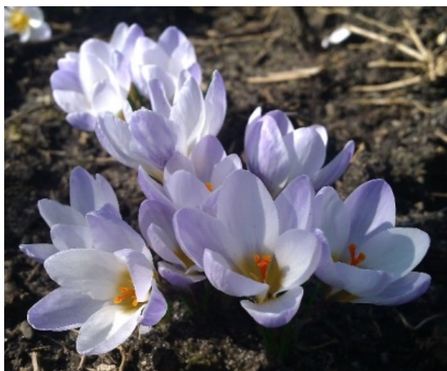
Рис. 5. Крокус золотистый 'Блю Перл'.